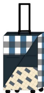
กระเป๋าเดินทางแบบที่ 11