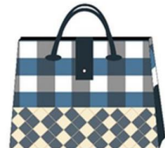
กระเป๋าถือแบบที่ 8