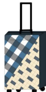
กระเป๋าเดินทางแบบที่ 12