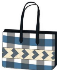
กระเป๋าถือแบบที่ 6