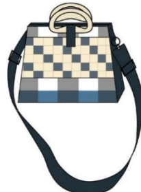
กระเป๋าสะพายแบบที่ 3