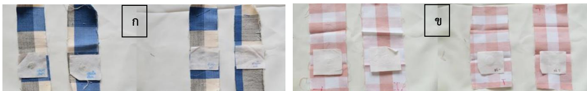
รูปที่ 3 แสดงภาพขึ้นทดสอบความคงทนของสีต่อการขัดถู