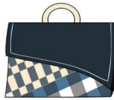
กระเป๋าถือแบบที่ 7