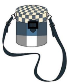
กระเป๋าสะพายแบบที่ 1

เมื่อผู้วิจัยทดสอบคุณสมบัติทางวิทยาศาสตร์เบื้องต้นของผ้าขาวม้า บ้านปางคอม จังหวัดน่าน เพื่อนำมาพัฒนาและออกแบบผลิตภัณฑ์กระเป๋า โดยมีการทำแบบร่างต้นแบบกระเป๋า จำนวน 12 แบบ โดยแบ่งเป็น กระเป๋าสะพาย 4 รูปแบบ กระเป๋าถือ 5 รูปแบบ และกระเป๋าเดินทาง 3 รูปแบบ เพื่อให้ผู้เชี่ยวชาญทางด้านการออกแบบผลิตภัณฑ์สิ่งทอ จำนวน 4 ท่าน ได้คัดเลือกและนำไปสำรวจกับกลุ่มตัวแทนผู้บริโภค โดยมีแบบร่างกระเป๋าดังต่อไปนี้