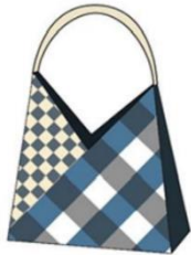
กระเป๋าถือแบบที่ 5