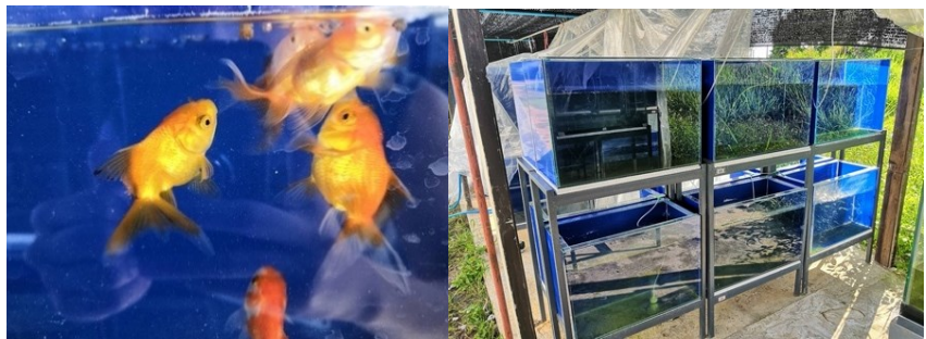
Figure 1 The animal trial and experimental fish tank.

ดำเนินการเตรียมปลาทอง ( Carassius auratus ) ขนาด 5-6 กรัมต่อตัว เลี้ยงปลาทองในตู้กระจก ขนาด 160 ลิตร ตู้ละ 10 ตัว ให้อาหารพื้นฐานเป็นระยะเวลา 2 สัปดาห์ ก่อนเริ่มการทดลอง เพื่อให้ปลาคชินกับสภาพแวดล้อมของการทดลอง โดยทำการทดลองเลี้ยงปลาในหน่วยทดลองสัตว์น้ำ ภาควิชาสัตวศาสตร์และสัตว์น้ำ คณะเกษตรศาสตร์ มหาวิทยาลัยเชียงใหม่ บริเวณพื้นที่ของศูนย์วิจัยสาธิตและฝึกอบรมการเกษตรแม่เหียะ ดังแสดงใน Figure 1 โดยแหล่งน้ำที่ใช้ทดลองเป็นน้ำประปาที่ผ่านกำจัดคลอรีน การพักน้ำก่อนนำมาใช้ มีการตรวจสอบคุณภาพน้ำทุกสัปดาห์ คุณสมบัติของน้ำตลอดทั้งการทดลองมีค่าปริมาณออกซิเจนละลายในน้ำ (DO) เฉลี่ย 5.97 มิลลิกรัมต่อลิตร อุณหภูมิเฉลี่ย 26.8 องศาเซลเซียส ปริมาณแอมโมเนียรวมเฉลี่ย 0.39 มิลลิกรัมต่อลิตร รวมถึงค่าความเป็นกรด-ด่าง (pH) ค่าความเป็นด่าง (Alkalinity) และค่าความกระด้าง (Hardness) โดยเฉลี่ยดังนี้ 7.87, 201.18 และ 28.00 ตามลำดับ