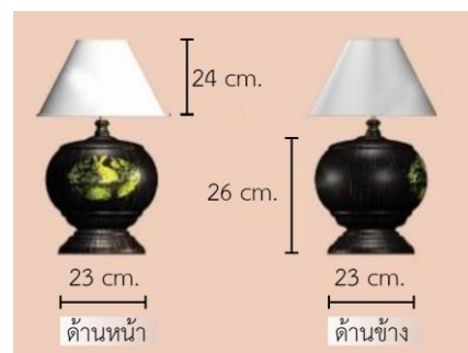
รูปที่ 5 โคมไฟไม้ตาลลวดลายปี่เถาะ