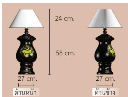
รูปที่ 4 โคมไฟไม้ตาลลวดลายปี่ฆาล