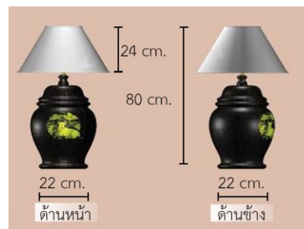
รูปที่ 3 โคมไฟไม้ตาลลวดลายปี่ลู่