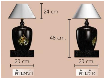
รูปที่ 6 โคมไฟไม้ตาลวดลายปี่มะโรง