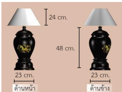
รูปที่ 8 โคมไฟไม้ตาลวดลายปี่มะเมีย