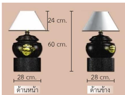
รูปที่ 2 โคมไฟไม้ตาลลวดลายปี่ชวด

ตอนที่ 3 การพัฒนารูปแบบงานหัตถกรรมไม้ตาลภาคกลางเพื่อเพิ่มคุณค่าทางวัฒนธรรมและมูลค่าเชิงพาณิชย์ ใช้รูปแบบศิลปวัฒนธรรมและเป็นเอกลักษณ์ของท้องถิ่น คือ ผลิตภัณฑ์โคมไฟไม้ตาล ลวดลาย 12 นักษัตร โดยใช้ภูมิปัญญาดั้งเดิมคือวิธีการกลึงไม้ตาล และเขียนลวดลายด้วยเทคนิคลายรดน้ำ ดังแสดงในรูปที่ 2 ถึงรูปที่ 13