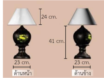
รูปที่ 13 โคมไฟไม้ตาลวดลายปี่กุน