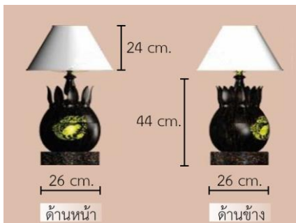
รูปที่ 10 โคมไฟไม้ตาลวดลายปี่วอก