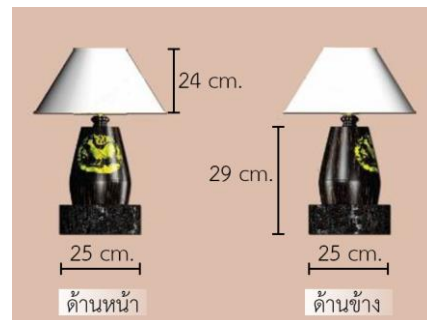
รูปที่ 11 โคมไฟไม้ตาลวดลายปี่ระกา