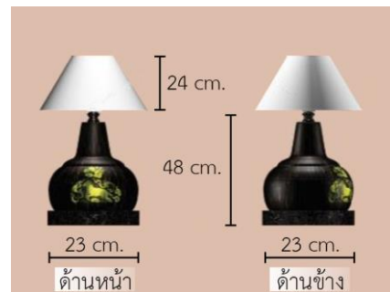
รูปที่ 9 โคมไฟไม้ตาลวดลายปี่มะแมม