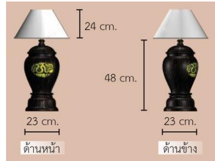
รูปที่ 7 โคมไฟไม้ตาลวดลายปี่มะเส็ง