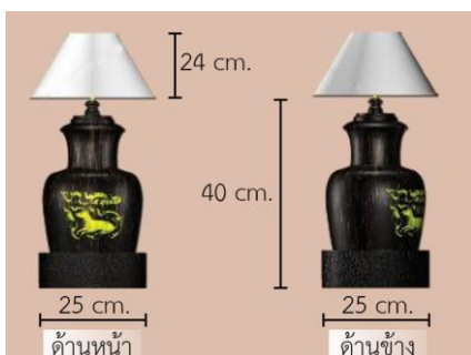
รูปที่ 12 โคมไฟไม้ตาลวดลายปี่จ้อ