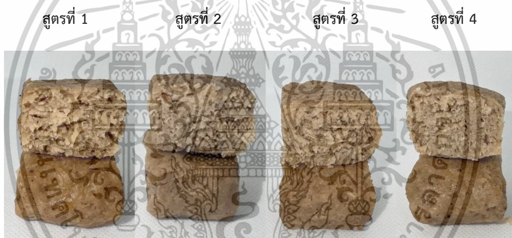
ภาพที่ 4.1 เนื้อเทียมจากเห็ดทั้ง 4 สูตร

จากการตรวจสอบคุณลักษณะทางกายภาพ ได้แก่ ค่าปริมาณวิเคราะห์ค่าปริมาณร้อยละผลผลิต (% Cooking yield) และร้อยละการสูญเสียน้ำหนัก (% Cooking loss) ค่าสี (CIE L*a*b*) ค่าปริมาณน้ำอิสระ (Water Activity, aw) ลักษณะเนื้อสัมผัส และการประเมินทางประสาทสัมผัสของเนื้อเทียมจำนวน 4 สูตรที่แตกต่างกัน แสดงลักษณะปรากฏของเนื้อเทียมได้ดังภาพที่ 4.1 มีผลการตรวจสอบคุณลักษณะทางกายภาพแสดงดังตารางที่ 4.2-4.3 และผลการประเมินความชอบทางประสาทสัมผัสแสดงดังตารางที่ 4.4