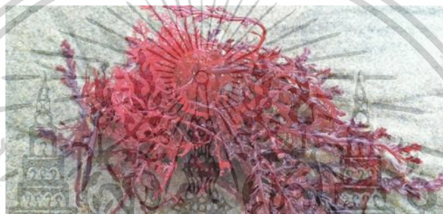
ภาพที่ 2.2 สาหร่ายผสมนาง (Gracilaria)

ในด้านองค์ประกอบของรงควัตถุ สาหร่ายผสมนางมีคลอโรฟิลล์ชนิดเอและดี รวมถึงไฟโคบิลิน เช่น อาร์-ไฟโคอิริทริน (R-phycoerythrin), อาร์-ไฟโคไซยานิน (R-phycoerythrin), ซี-อัลโลไฟโคไซยานิน (C-allophycoerythrin) และกลุ่มคาโรทีนอยด์ เช่น เบต้า-คาโรทีน ( \beta -carotene) และแอนเทอราแซนทิน (Antheraxanthin)