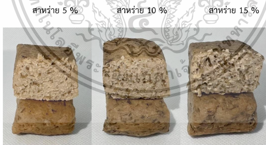
ภาพที่ 4.2 เนื้อเทียมผสมสาหร่ายแดงทั้ง 3 สูตร

จากภาพที่ 4.2 แสดงลักษณะปรากฏของเนื้อเทียมผสมสาหร่ายทั้ง 3 สูตร โดยมีปริมาณสาหร่ายแดงที่แตกต่างกัน 5, 10 และ 15 % ตามลำดับ ลักษณะภายนอกของสูตรที่ 1 (สาหร่ายแดง 5 %) มีผิวเอกสารนี้เป็นเอกสารที่สงวนไว้สำหรับการใช้งานเพื่อการศึกษาเท่านั้น ไม่อนุญาตให้นำไปใช้ประโยชน์ด้านการค้า ไม่ว่าจะกรณีใดๆทั้งสิ้น อีกทั้งห้ามมิให้ตัดแปลงเนื้อหา และต้องอ้างอิงถึงเจ้าของเอกสารทุกครั้งที่มีการนำไปใช้