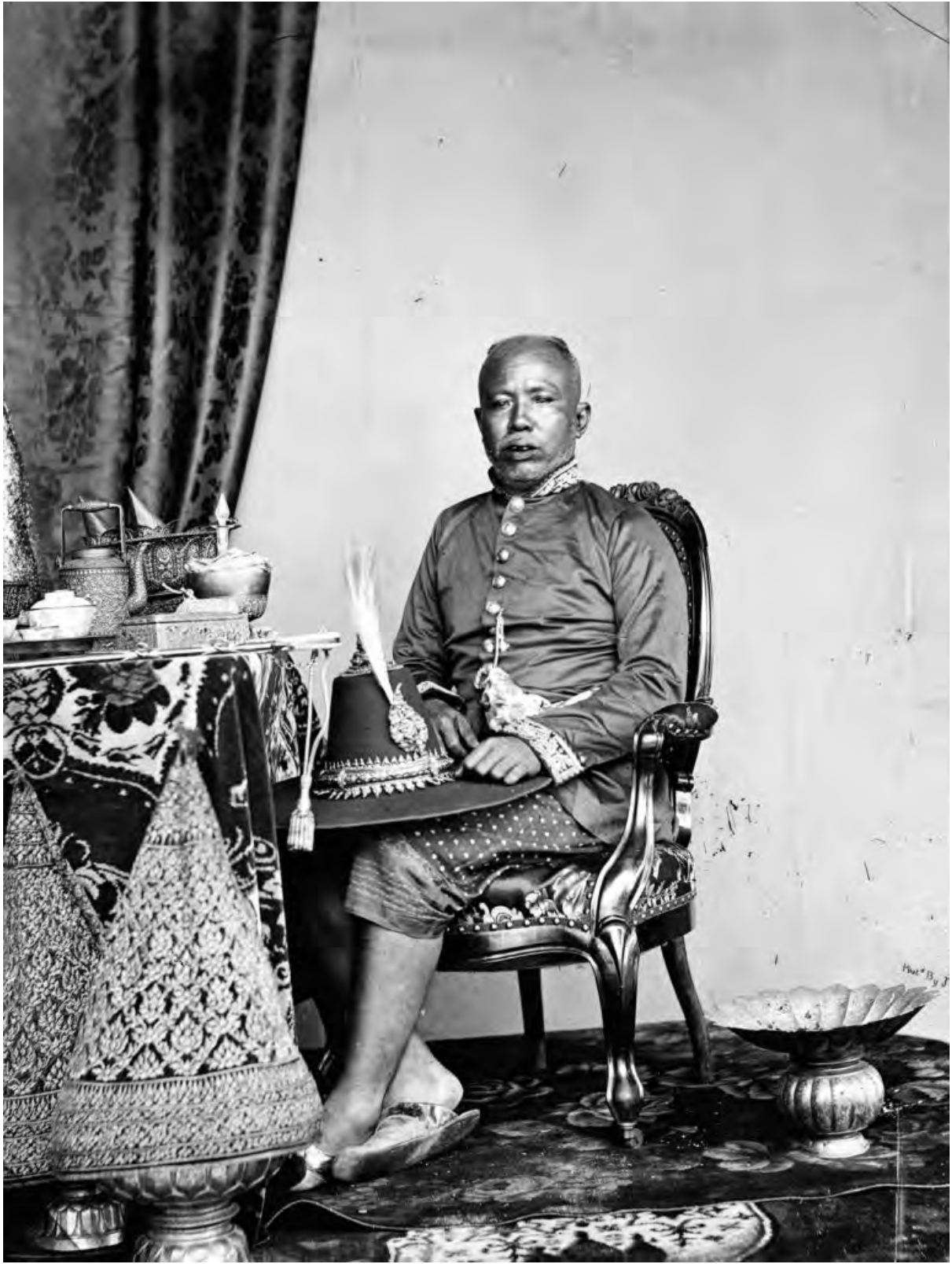
สมเด็จพระเจ้าบรมวงศ์เธอ เจ้าฟ้ามหามาลา กรมพระบำราบปรปักษ์