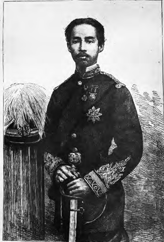
THE KING AS COLONEL OF HIS BODY GUARD

ภาพพระบรมสาทิสลักษณ์ของรัชกาลที่ 5 ในงานฉลองบรมราชาภิเษกสมโภชเมื่อ พ.ศ. 2416 (ค.ศ. 1873) ในช่วงเปลี่ยนแปลงการปกครองเป็นสาธารณรัฐในฝรั่งเศสก็ทรงติดตามความเคลื่อนไหวจากที่นั้นอย่างใกล้ชิด คำว่า Re-Coronation แปลว่า พิธีบรมราชาภิเษก ครั้งที่ 2