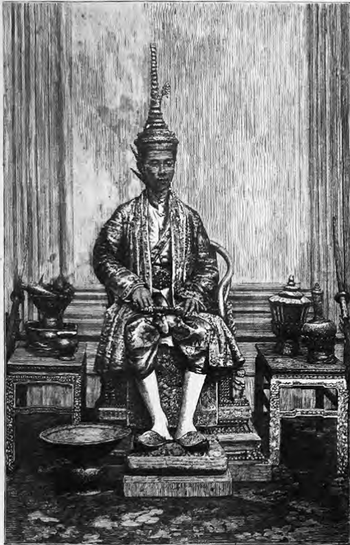
THE KING IN HIS CORONATION ROBES