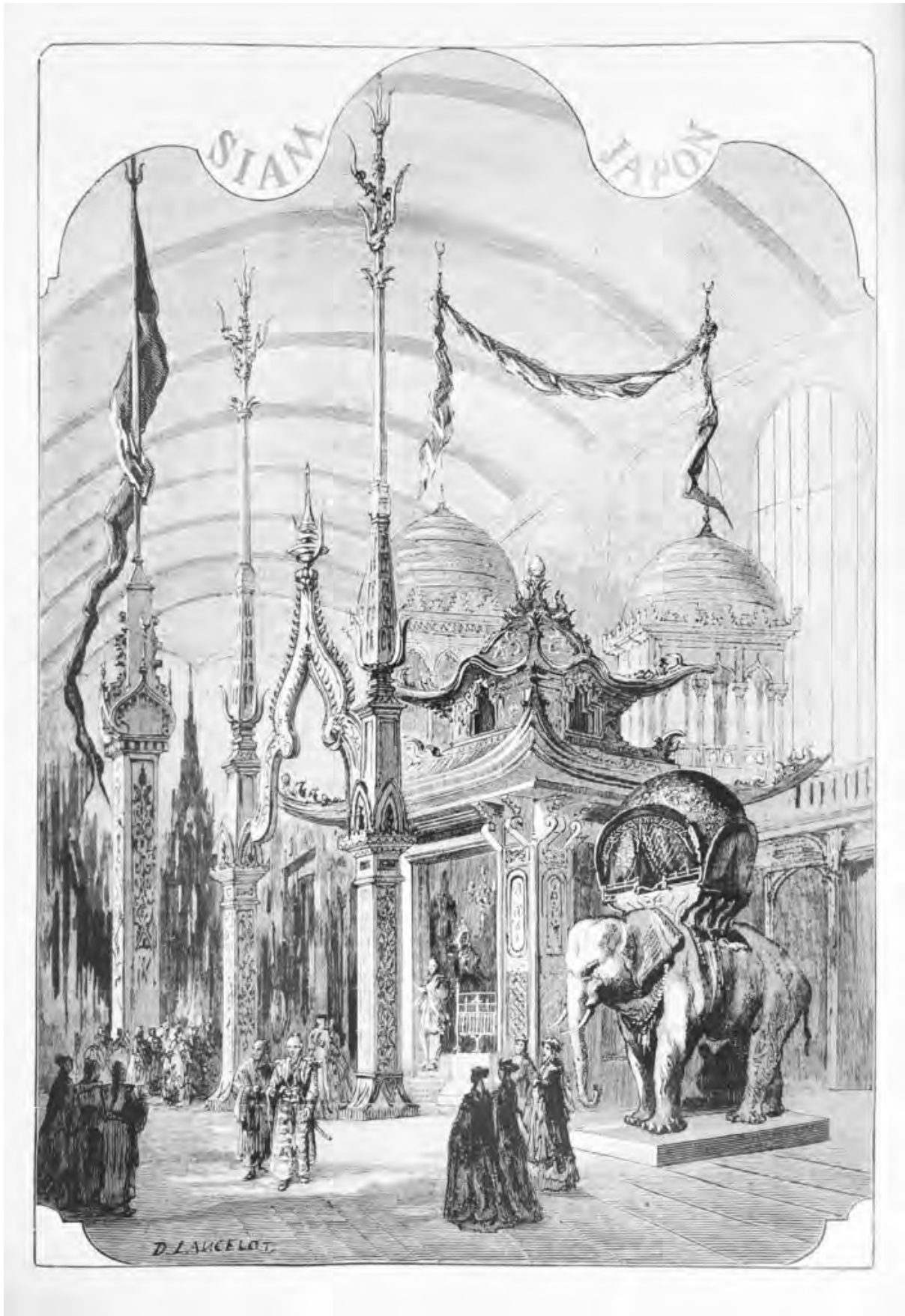
ซุ้มประตูศาลาไทยในงานมหกรรมโลกที่ปารีส ค.ศ. 1867 เมื่อสยามถูกเชิญไปออกร้านในฝรั่งเศส