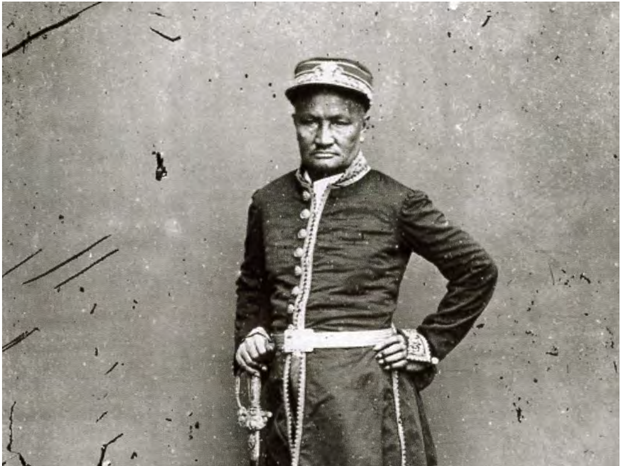
สมเด็จพระยาบรมมหาศรีสุริยวงศ์ (ช่วง บุนนาค)

ทันทีที่พระบาทสมเด็จพระจอมเกล้าเจ้าอยู่หัว เสด็จสวรรคต การประชุมอย่างเป็นทางการเพื่อเลือกพระเจ้าแผ่นดินองค์ใหม่จึงเกิดขึ้น โดยองค์ประชุมประกอบด้วย พระเจ้าวรวงศ์เธอ กรมหมื่นบวรรังสี เจ้าอาวาสวัดบวรนิเวศวิหาร เป็นประธาน, เจ้าพระยาศรีสุริยวงศ์ (ช่วง บุนนาค) เป็นผู้ดำเนินการประชุม ท่ามกลางพระสงฆ์ชั้นผู้ใหญ่ พระบรมวงศานุวงศ์ ตลอดจนข้าราชการชั้นพระยา และเจ้าพระยา