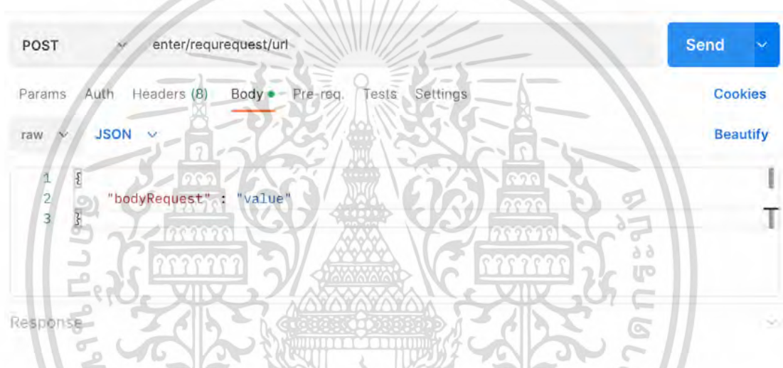
รูปที่ 2.2 Postman

Postman เป็น API Platform สำหรับนักพัฒนาในการสร้าง หรือการทดสอบ APIs โดยจะกล่าวถึงในส่วนของการทดสอบ API เป็นหลัก