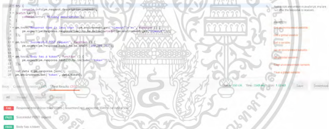
รูปที่ 2.5 Test Result

โดยหลังจากทำการส่ง Request และทำการทดสอบเสร็จสิ้น สามารถดูผลทดสอบได้โดยไปที่แท็บ Test Result ด้านล่างดังรูป 2.5