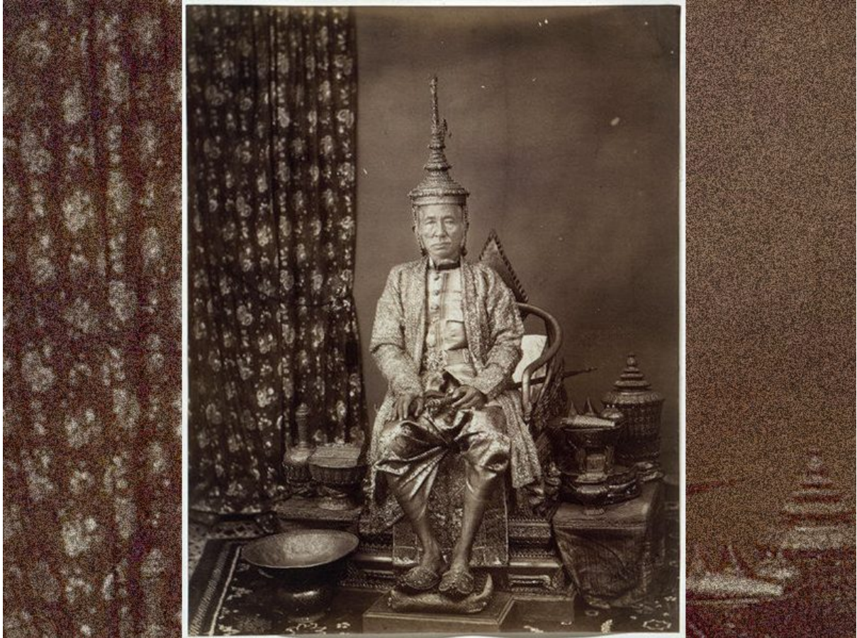
พระบาทสมเด็จพระจอมเกล้าเจ้าอยู่หัว