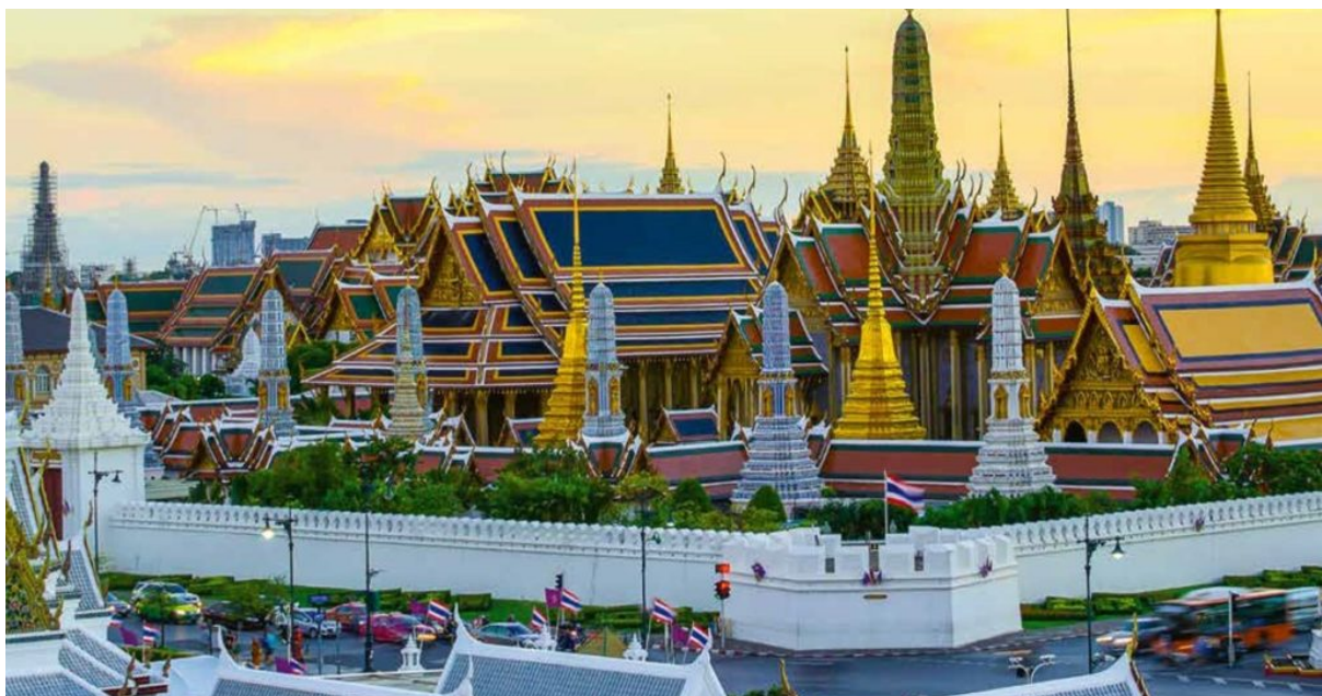
ภาพประกอบเนื้อหา – วัดพระศรีรัตนศาสดาราม (จากหนังสือ พระราชพิธีบรมราชาภิเษก)