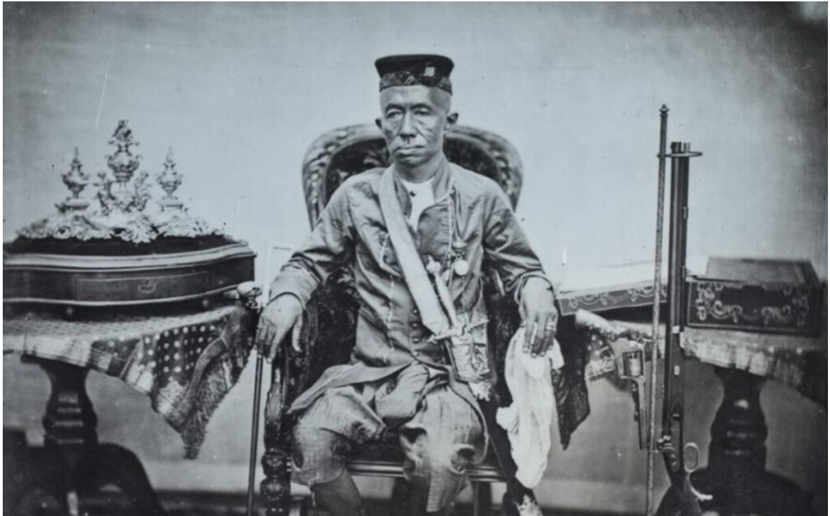
พระบาทสมเด็จพระจอมเกล้าเจ้าอยู่หัว รัชกาลที่ 4