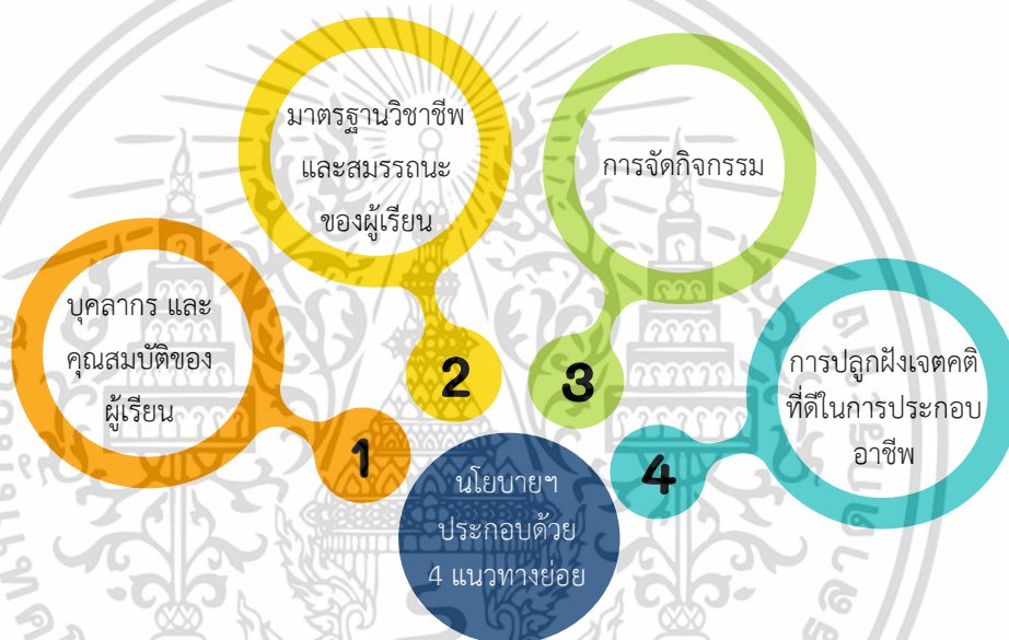
ภาพที่ 4.2 นโยบายการจัดการอาชีวศึกษาสำหรับผู้มีความบกพร่องทางการได้ยิน

นโยบายการจัดการอาชีวศึกษาสำหรับผู้มีความบกพร่องทางการได้ยิน คือ กรอบทิศทางการดำเนินการจัดการศึกษาสำหรับผู้เรียนในสถานศึกษา สังกัดสำนักงานคณะกรรมการการอาชีวศึกษา ที่สูญเสียการได้ยิน หูหนวก หรือหูตึง รวมไปถึงการพูด และการสื่อสาร เพื่อให้ผู้เรียนมีความรู้ ทักษะ เจตคติที่ดีในด้านอาชีพ ตอบสนองความต้องการของตลาดแรงงาน โดยนโยบายการจัดการอาชีวศึกษาสำหรับผู้มีความบกพร่องทางการได้ยินประกอบด้วย 4 แนวทางย่อย ดังนี้