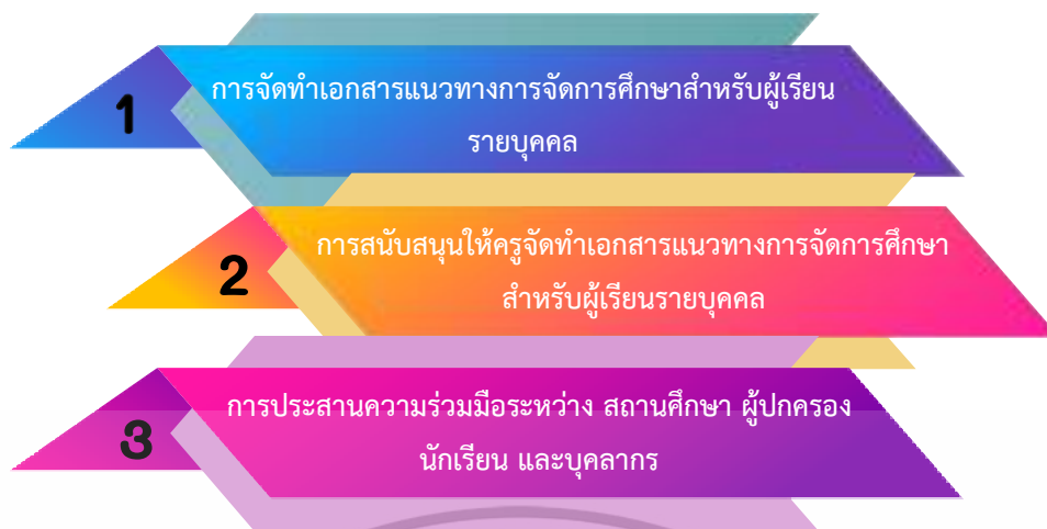
ภาพที่ 4.5 แผนการจัดการศึกษาเฉพาะบุคคล