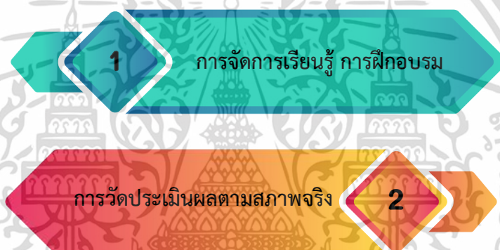
ภาพที่ 4.6 การจัดการเรียนรู้ การฝึกอบรม และการวัดประเมินผลตามสภาพจริง

การจัดการเรียนรู้ การฝึกอบรม และการวัดประเมินผลตามสภาพจริงคือ กระบวนการหรือสถานการณ์ที่ครูในสถานศึกษา สังกัดสำนักงานคณะกรรมการการอาชีวศึกษา จัดให้กับผู้เรียนระดับประกาศนียบัตรวิชาชีพ และประกาศนียบัตรวิชาชีพชั้นสูง ที่สูญเสียการได้ยินหูหนวกหรือหูตึง รวมไปถึงการพูด และการสื่อสาร ได้พัฒนา ฝึกฝน ให้มี ความรู้ ทักษะ และทัศนคติ มีคุณธรรม จริยธรรม ผ่านกระบวนการและเทคนิคต่าง ๆ พร้อมทั้งประเมินผล หรือการตัดสินผลการเรียนรู้ด้วยวิธีการที่หลากหลาย โดยเน้นการประเมินทักษะกระบวนการคิดที่ซับซ้อน สอดคล้องกับการปฏิบัติในสภาพจริง ซึ่งประกอบด้วย 2 แนวทางย่อย ดังนี้