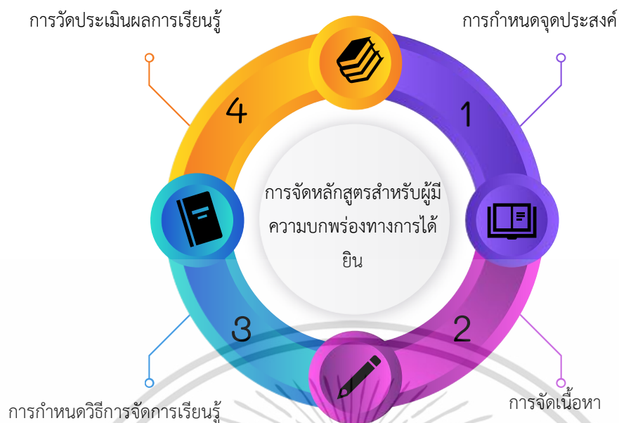
ภาพที่ 4.3 การจัดหลักสูตรสำหรับผู้มีความบกพร่องทางการได้ยิน