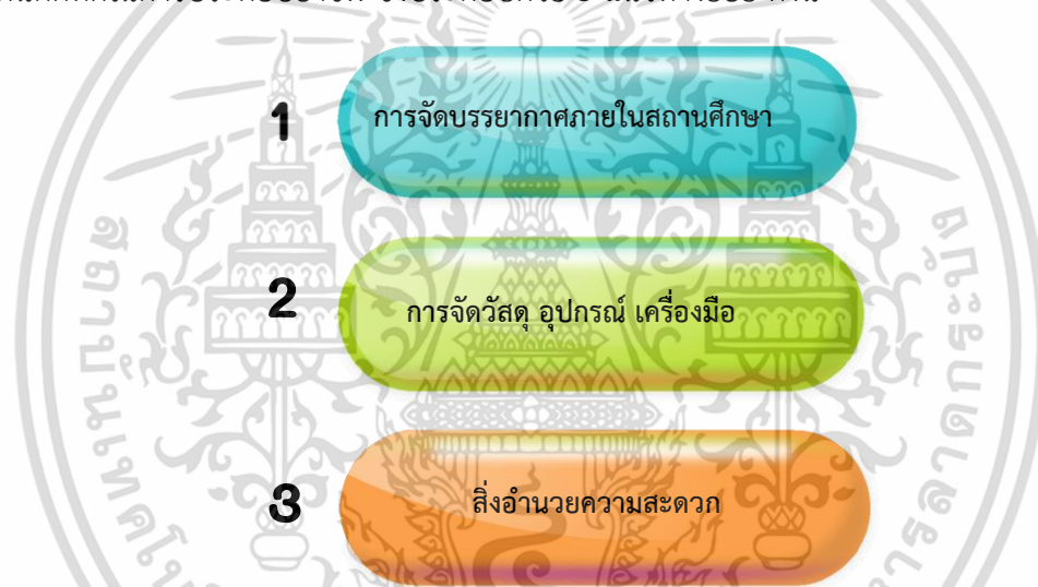
ภาพที่ 4.4 การจัดสภาพแวดล้อม สื่อการสอน และสิ่งอำนวยความสะดวก

การจัดสภาพแวดล้อม สื่อการสอน และสิ่งอำนวยความสะดวก คือ การจัดวัสดุอุปกรณ์ เครื่องมือ และบริการต่าง ๆ ของสถานศึกษา สังกัดสำนักงานคณะกรรมการการอาชีวศึกษา เพื่อ ทดแทนความบกพร่องทางการได้ยิน ให้ผู้เรียนระดับประกาศนียบัตรวิชาชีพ และประกาศนียบัตร วิชาชีพชั้นสูง สามารถปฏิบัติงาน หรือมีส่วนร่วมในกิจกรรมต่าง ๆ และได้รับความรู้ ทักษะ และมี ทักษะที่ดีในการประกอบอาชีพ ซึ่งประกอบด้วย 3 แนวทางย่อย ดังนี้