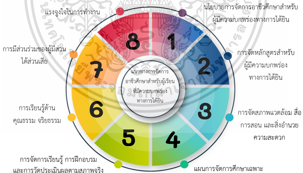
ภาพที่ 4.1 แนวทางการจัดการอาชีวศึกษาสำหรับผู้เรียนที่มีความบกพร่องทางการได้ยิน สังกัดสำนักงานคณะกรรมการการอาชีวศึกษา

แนวทางการจัดการอาชีวศึกษาสำหรับผู้เรียนที่มีความบกพร่องทางการได้ยิน สังกัดสำนักงานคณะกรรมการการอาชีวศึกษา ศึกษาจากกรอบแนวคิด รูปแบบการจัดการศึกษาศูนย์การศึกษาพิเศษ ส่วนกลาง TECPA Model, Vocational Educational Education For students With Special Needs a Teachers' Handbook, เส้นทางการจัดการศึกษาเพื่อเข้าสู่อาชีพของคนพิการ และรูปแบบการบริหารจัดการสถานศึกษาเพื่อการมีงานทำของคนพิการทางการได้ยิน ซึ่งได้นำกรอบแนวคิดข้างต้นมาทำการสังเคราะห์ข้อมูล เป็นกรอบแนวคิดในการจัดทำแนวทางการจัดการอาชีวศึกษาสำหรับผู้เรียนที่มีความบกพร่องทางการได้ยิน สังกัดสำนักงานคณะกรรมการการอาชีวศึกษา ประกอบด้วย 1) นโยบายการจัดการอาชีวศึกษาสำหรับผู้มีความบกพร่องทางการได้ยิน 2) การจัดหลักสูตรสำหรับผู้มีความบกพร่องทางการได้ยิน 3) การจัดสภาพแวดล้อม สื่อการสอน และสิ่งอำนวยความสะดวก 4) แผนการจัดการศึกษาเฉพาะบุคคล 5) การจัดการเรียนรู้ การฝึกอบรม และการวัดประเมินผลตามสภาพจริง 6) การเรียนรู้ด้านคุณธรรม จริยธรรม 7) การมีส่วนร่วมของผู้มีส่วนได้ส่วนเสียและ 8) แรงจูงใจในการทำงาน โดยนำกรอบแนวคิดดังกล่าวไปสัมภาษณ์กลุ่มผู้ให้ข้อมูลสำคัญใน 4 วิทยาลัย ซึ่งเป็นศูนย์บริการสนับสนุนนักเรียน นักศึกษาพิการ หรือ Disability Support Services Center (DSS) ที่จัดการศึกษาสำหรับผู้เรียนที่มีความบกพร่องทางการได้ยิน การประกอบด้วย วิทยาลัยเทคนิคบางแสน วิทยาลัยการอาชีพพุทธมณฑล วิทยาลัยสารพัดช่างอุดรธานี และวิทยาลัยสารพัดช่างสุรินทร์ ซึ่งนำผลการสัมภาษณ์มาทำการสังเคราะห์ข้อมูลสามารถสรุปได้ดังภาพที่ 4.1