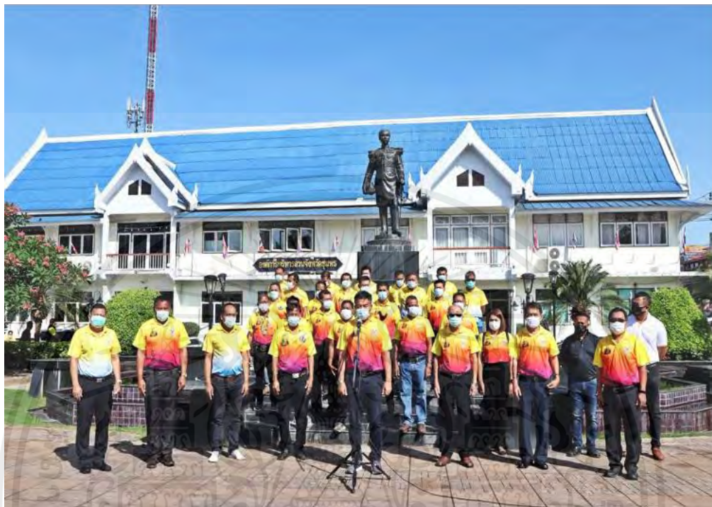
ภาพที่ 1.1 ภาพสถานประกอบการ