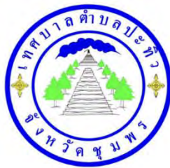
ภาพ 2.1 ตราสัญลักษณ์ของเทศบาลตำบลปะทิว จังหวัดชุมพร