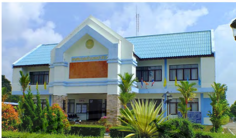
ภาพที่ 1.1 ภาพสถานประกอบการ