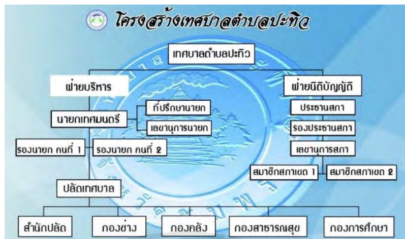
ภาพที่ 2.2 โครงสร้างองค์กรเทศบาลตำบลปะทิว จังหวัดชุมพร