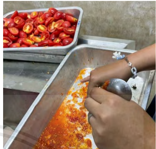
ภาพผนวกที่ 1 การนำมะเขือเทศสีดามาหั่นและนำเอาเมล็ดออกให้หมด