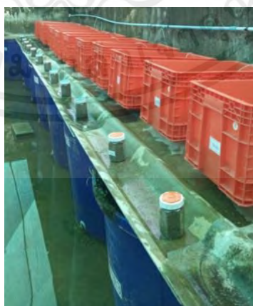
ภาพผนวกที่ 6 เรียงอาหารตามเลเวลให้ตรงกับถัง เตรียมทำการให้อาหารปลา