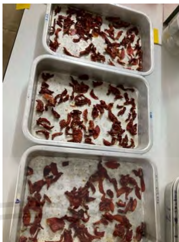
ภาพผนวกที่ 4 มะเขือเทศสีดาหลังจากเข้าตู้อบจะมีความแห้งกรอบ