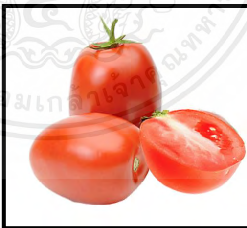
ภาพที่ 2 มะเขือเทศสีดา