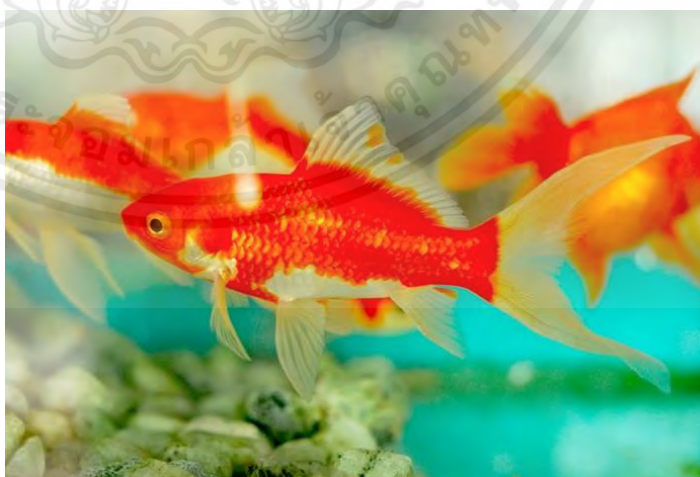
ภาพที่ 1 ปลาทองโคเมท