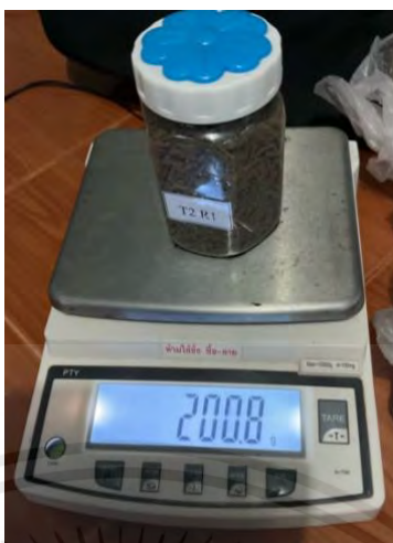
ภาพผนวกที่ 7 ซังอาหารปลาให้ครบ 200 g. เท่ากันทุกกระปุก