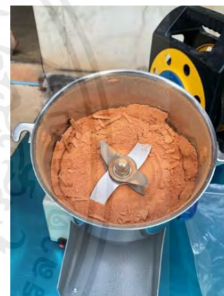
ภาพผนวกที่ 5 นำมะเขือเทศสีดาไปบดในเครื่องบดใบมีดค้อน (Hammer) ให้ละเอียดเป็นผง