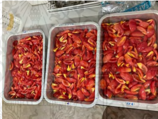
ภาพผนวกที่ 2 เอาเมล็ดออกเรียบร้อยแล้ว ล้างทำความสะอาด