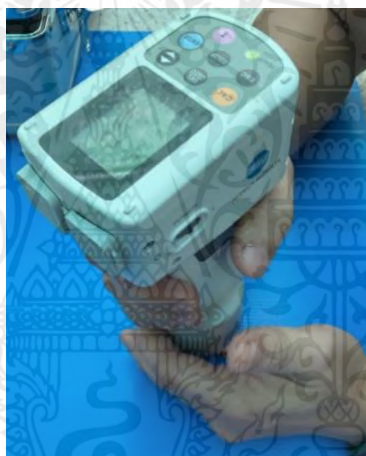
ภาพผนวกที่ 8 วัดค่าสีปลาทองโคเมท