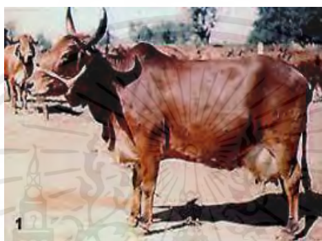
ภาพที่ 14 แสดงโคนมพันธุ์ซาฮิวาล

โคนมพันธุ์ซาฮิวาล มีแหล่งกำเนิดทางประเทศอินเดีย จัดเป็นโคพันธุ์ขนาดกลาง มีน้ำหนักตัวของโคเพศเมีย 400- 450 กิโลกรัม และโคเพศผู้ 500-600 กิโลกรัม มีลักษณะของใบหูใหญ่พับตก มีโหนก เหนียงที่ชัดเจน ผิวหนังห้อยยาน แนวสันหลังแอ่น และโค้งมนไปทางบั้นท้าย สีสล้าตัวเป็นสีน้ำตาลอ่อนถึงเข้ม ตลอดล้าตัวเป็นโคที่ปรับตัวได้ดีในสภาพอากาศร้อน ทนทาน ต่อโรคได้ดีโดยเฉพาะโรคไข้เห็บ มักเป็นโคที่นิยมนำมาใช้เป็นโคพื้นฐานของการปรับปรุงโคนมเขตร้อน มีอัตราการให้น้ำนม 2,300-2,800 กิโลกรัม ต่อช่วงการให้น้ำนม