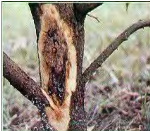
ภาพที่ 9 แสดงโรครากเน่าและโคนเน่าของทุเรียน ที่มา : นิพนธ์ (2552)