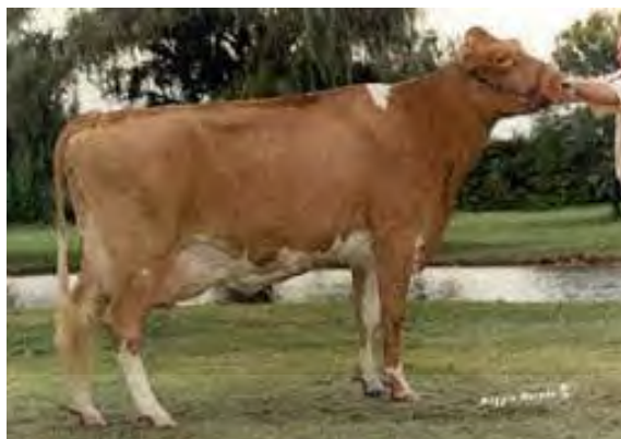
ภาพที่ 12 แสดงโคนมพันธุ์เกอร์นซี