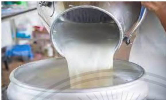
ภาพที่ 19 แสดงภาพน้ำนมดิบ

นมดิบ (raw milk) หมายถึง นมโคที่รีดมาจากเต้านมโคแล้วยังไม่ได้ผ่านกรรมวิธีฆ่าเชื้อ ดังนั้นจึงห้ามดื่มนมดิบ การผลิตนมดิบคุณภาพดี นมดิบที่จะมีคุณภาพดีนั้นจะต้องเป็นนมที่สะอาดปราศจากสิ่งปลอมปน