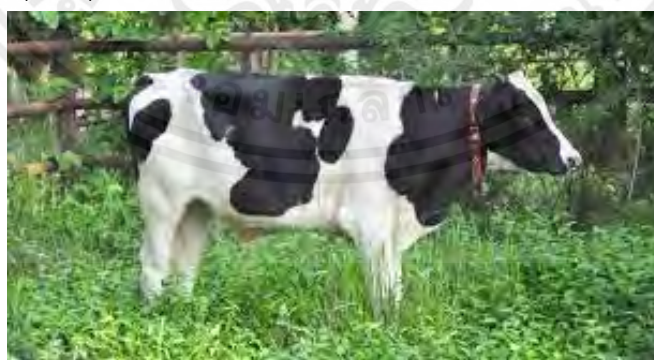
ภาพที่ 17 แสดงโคนมพันธุ์ที เอ็ม แซด

2. พันธุ์ทีเอ็ม แซด (Thai Milking Zebu) หรือเกษตรกรทั่วไปมักเรียกว่า “โคเลือด 75” หมายถึง โคนมลูกผสมที่มีเลือดโคนมพันธุ์โฮลส์ไตน์ฟริเซียน 75 เปอร์เซ็นต์ ส่วนสายเลือดที่เหลือ 25 เปอร์เซ็นต์ เป็นโคพันธุ์ซิมู โคพันธุ์นี้เหมาะสำหรับเกษตรกรรายใหม่ กลุ่มที่ได้มีการผสมพันธุ์และคัดเลือกแล้วให้ผลผลิต น้ำนมเฉลี่ยประมาณ 3,000 – 4,000 กิโลกรัม ต่อระยะการให้นมในส่วนของกรมปศุสัตว์ได้มีการเลี้ยง และศึกษาโคนมพันธุ์นี้ที่ศูนย์วิจัยและบำรุงพันธุ์สัตว์ลำพูนกลาง จังหวัดนครราชสีมา