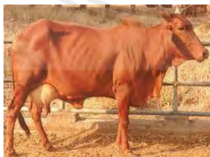
ภาพที่ 15 แสดงโคนมพันธุ์เรดซินดี

โคนมพันธุ์เรดซินดี มีแหล่งกำเนิดทางประเทศอินเดีย จัดเป็นโคพันธุ์ขนาดกลางเช่นซาฮิวาล น้ำหนักตัวของโคเพศเมีย 350-450 กิโลกรัม และโคเพศผู้ 450-500 กิโลกรัม มีลักษณะทั่วไปคล้ายโคซาฮิวาล มีโหนก เหนียงที่ชัดเจน ผิวหนังห้อยยาน มีแนวสันหลังแอ่นมากและโค้งมนไปทางบั้นท้ายมากกว่าโคซาฮิวาล สีสล้าตัวเป็นสีน้ำตาลเข้มถึงสีแดงตลอดล้าตัว เป็นโคทนต่อสภาพอากาศร้อน ทนทานต่อโรคได้ดีเป็น โคที่นิยมนำมาใช้เป็นโคพื้นฐานของการปรับปรุงพันธุ์โคนมในระยะแรก