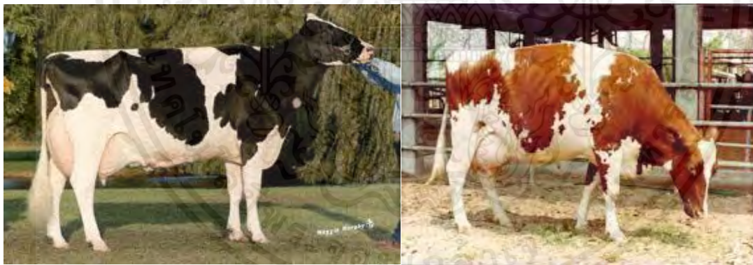
ภาพที่ 10 แสดงโคนมสายพันธุ์โฮลสไตน์ฟรีเซียน

โคนมพันธุ์โฮลสไตน์ฟรีเซียนจัดเป็นโคพันธุ์หนัก มีขนาดลำตัวใหญ่ในบรรดาโคนมด้วยกัน โคนมเพศเมียโตเต็มที่ มีน้ำหนัก 1,500 ปอนด์ (680 กิโลกรัม) ในขณะที่โคเพศผู้โตเต็มที่ มีน้ำหนัก 2,200-2,400 ปอนด์ (997-1,087 กิโลกรัม) ให้ผลผลิตน้ำนม 16,648 ปอนด์ (7,542 กิโลกรัม) ต่อปีลักษณะสีของน้ำนมจะเป็นสีขาว ไขมันในน้ำนมเฉลี่ย 3.64 เปอร์เซ็นต์ ซึ่งต่ำสุดในบรรดาโคนม ด้วยกัน เป็นโคที่ทนต่ออากาศร้อน และความเครียดได้ดี โคนจะมีสีดำขาวเป็นลักษณะเด่นของโคพันธุ์นี้ มักจะเรียกโคพันธุ์นี้ว่า โคพันธุ์ขาว-ดำ ลักษณะสีที่นิยมเลี้ยงกันจะมีสีขาวเป็นพื้นและมีสีดำแต้มเป็นแผ่นสีโคอาจจะมีสีเกือบขาวทั้งลำตัว หรือเกือบดำทั้งลำตัว โดยทั่วไปมักจะนิยมให้มีสัดส่วนของสีดำและขาวอย่างละครึ่ง ซึ่งลักษณะของสีสามารถปรับปรุงได้โดยวิธีใช้ mass selection นอกจากสีขาว-ดำ แล้ว โคพันธุ์นี้ยังมีสีขาว-แดง แต่จะพบเห็นได้ไม่มาก และก็สามารถขึ้นทะเบียนเป็นโคพันธุ์โฮลสไตน์ฟรีเซียนเช่นกัน ถึงแม้ว่าจะเป็นโคมีขนาดใหญ่ แต่โคพันธุ์โฮลสไตน์ฟรีเซียนก็มีรูปร่างกลมกลืนได้สัดส่วน โดยเฉพาะในโคเพศเมียจะมีการพัฒนาของรูปร่าง และลักษณะการให้นมที่ชัดเจน โคนจะไม่มียลักษณะของการให้เนื้อหรือสะสมเนื้อและไขมันโค