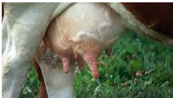
ภาพที่ 21 แสดงโรคเต้านมอักเสบ