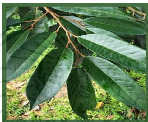
ภาพที่ 2 แสดงใบของต้นทุเรียน

ทุเรียนเป็นไม้ผลยืนต้น เป็นพืชที่ไม่มีการผลัดใบ ทรงพุ่มแผ่กว้าง มีความสูง 20-40 เมตร(เพาะเมล็ด) สำหรับต้นที่ปลูกจากการเสียบยอด มีความสูง 8-12 เมตร ใบเป็นใบเดี่ยว ยาว 8-20 เซนติเมตรกว้าง 4-6 เซนติเมตร เป็นพืชใบเลี้ยงคู่ ปลายใบแหลม มีก้านใบสีน้ำตาลบนใบสีเขียวแก่ถึงเขียวเข้ม ด้านใต้ใบ เป็นสีน้ำตาล เส้นใบทุเรียนสานกันมีลักษณะเป็นร่างแห ใบของทุเรียนในแต่ละพันธุ์ก็มีความแตกต่างกันไปตามสายพันธุ์นั้นๆ ด้วย (ลักษณะทางพฤกษศาสตร์ของต้นทุเรียน, 2560)