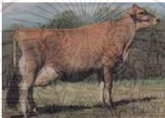
ภาพที่ 11 แสดงโคนมพันธุ์เจอร์ซี่

การสะสมกล้ามเนื้อชัดเจน จะมีกล้ามเนื้อมากบริเวณไหล่และแผงคอ ส่วนลักษณะอื่นๆ เหมือนลักษณะโคเพศเมีย ลักษณะเด่นมีลีนดำ ทางดำ ส่วนสีผิวจะไม่ค่อยเน้นมาก จะพบเห็นสีได้ตั้งแต่สีเทาอ่อน สีเทาแก่ปนเหลือง และสีน้ำตาลแกมเหลืองเข้ม ส่วนใหญ่จะมีสีเข้มบริเวณใบหน้า, โหนกคอก เข้มกว่าสีบริเวณอื่นๆ ของลำตัว การให้น้ำนมของเจอร์ซี่จะเฉลี่ย 11,268 ปอนด์ ต่อปี (5,104 กิโลกรัม) และไขมันเฉลี่ย 4.82 เปอร์เซ็นต์ ซึ่งจัดเป็นโคที่มีการให้น้ำมันสูงที่สุดกว่าโคนมพันธุ์อื่น เจอร์ซี่จะเป็นโคที่ปรับตัวได้ดีในสภาพ อากาศร้อนหรือ การเลี้ยงแบบปล่อยทุ่งหญ้า ปรับตัวได้ดีมากเมื่อเทียบกับโคพันธุ์อื่นๆ จึงทำให้เจอร์ซี่มีเลี้ยงกันทั่วไปในหลายประเทศ ทั้งเขตร้อนและเขตหนาว มีประสิทธิภาพ ในการกินและใช้ประโยชน์จาก อาหารได้ดี เจอร์ซี่เป็นโคที่มีอายุถึงวัยโตเต็มที่เร็ว และมีอายุการให้น้ำนมเร็วกว่าพันธุ์อื่นๆ และยังเป็นพันธุ์ที่มีความทนทานในการให้นม มีอายุการให้นมยาวนานกว่าหลายๆ พันธุ์ ปัจจุบันมีความพยายาม ปรับปรุงพันธุ์เจอร์ซี่ให้มีขนาดลำตัว และเต้านมใหญ่ขึ้น เพื่อประสิทธิภาพในการผลิตน้ำนม