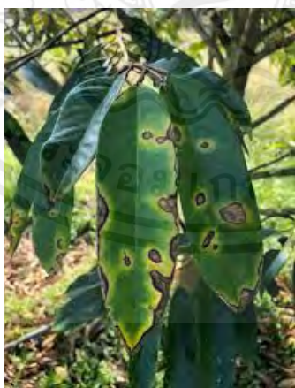
ภาพที่ 7 แสดงโรคใบจุดสนิม