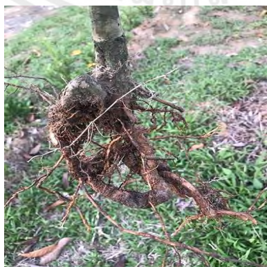
ภาพที่ 3 แสดงรากของต้นทุเรียน

รากทุเรียนมีรากหาอาหารบริเวณผิวดินจนถึงระดับ 50 เซนติเมตร มีรากพิเศษที่เกิดจากบริเวณ โคนต้นอยู่มากมายตามผิวดิน แตกกออกมาลักษณะตีนตะขาบเรียกว่า “รากตะขาบ” รากแก้วของทุเรียน ทำหน้าที่ยึดลำต้น ทุเรียนนนท์ส่วนใหญ่ ไม่มีรากแก้วเพราะปลูกจากกิ่งตอน แต่จะมีรากพิเศษแทนหรือรากแขนง ที่แตกต่างจากรากพิเศษที่ยังลึกลงไปใต้ดินทำหน้าที่คล้ายรากแก้วและสามารถหยั่งลึกไปถึงระดับน้ำใต้ดินได้ มีรากฝอยเป็นรากหาอาหารออกมาจากรากพิเศษมีหน้าที่ในการดูดอาหาร