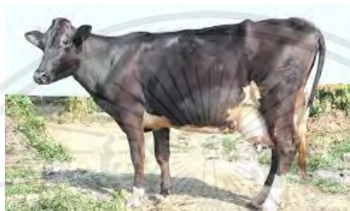
ภาพที่ 16 แสดงโคนมพันธุ์ไทยโฮลส์ไตน์ฟริเซียน

1. พันธุ์ไทยฟริเซียน (Thai Friesian) หรือเกษตรกรทั่วไปมักเรียกว่า “โคเลือดสูง” หมายถึง โคนมลูกผสมที่มีเลือดโคนมพันธุ์โฮลส์ไตน์ฟริเซียนมากกว่า 75 เปอร์เซ็นต์ ปัจจุบันเกษตรกรเลี้ยงกันมากใน จังหวัดสระบุรี, นครราชสีมา, ลพบุรี และราชบุรีรวมทั้งจังหวัดอื่นๆ โคพันธุ์นี้ให้ผลผลิตน้ำนมค่อนข้างสูงจากข้อมูลสำหรับฟาร์มที่มีการจัดการด้านอาหารอย่างเหมาะสมให้ผลผลิตน้ำนมเฉลี่ยประมาณ 4,000 – 5,000 กิโลกรัมต่อระยะการให้นม หรือผลผลิตน้ำนมในระยะให้นมสูง (peak) หลังคลอดไม่ต่ำกว่า 15 กิโลกรัม โคพันธุ์นี้เหมาะสำหรับเกษตรกรที่มีประสบการณ์ในการเลี้ยงโคนมมาแล้ว