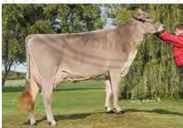
ภาพที่ 13 แสดงโคนมพันธุ์บราวสวิด

โคนมพันธุ์บราวสวิด เป็นโคนมพันธุ์ใหญ่ เช่น โคโฮลส์ไตน์ฟรีเซียนเช่นกัน โคเพศเมียโตเต็มที่มีน้ำหนัก 1,300-1,800 ปอนด์ (589-815 กิโลกรัม) ส่วนโคเพศผู้มีน้ำหนัก 1,800-2,600 ปอนด์ (815-1,178 กิโลกรัม) ลักษณะ สีตัวจะมีสีน้ำตาลอ่อนถึงน้ำตาลเข้ม ส่วนใหญ่ผู้เลี้ยงนิยมสีเข้มบางกลางถึงเข้มมาก แต่บราวสวิดจะมีสีอ่อน บริเวณแนวสันหลังและรอบเขา รอบปากจะมีสีออกขาว ขณะที่สีบริเวณลำตัวส่วนใหญ่จะเป็นสีเข้ม แต่เข้มน้อยกว่าตรงไหล่กับคอ สีเต้านมจะออกขาวหรือเทา กีบเท้าและหางมีสีเข้มดำ จมูกและลิ้นจะมีสีเกือบดำ ส่วนลักษณะการให้น้ำนมจะเฉลี่ย 13,588 ปอนด์ต่อปี (6,155 กิโลกรัม) มีเปอร์เซ็นต์ไขมัน 4.08 เปอร์เซ็นต์ มีความทนทานในการให้น้ำนมได้ดีมีความสามารถในการทะเล็มแปลงหญ้าได้ดี เพราะเป็นโคที่ลำตัวใหญ่ และเลี้ยงดูง่ายเอาใจใส่น้อย โคนสามารถออกหากินเองได้เก่ง