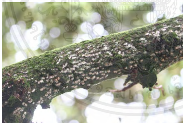
ภาพที่ 8 แสดงโรคราสีชมพู