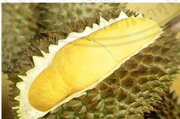
ภาพที่ 5 แสดงผลของต้นทุเรียน

ผลของทุเรียนมีเปลือกหนา มีหนามแหลมแข็งเป็นรูปปิรามิดตลอดผล ทรงของผลทุเรียนมีหลายรูปแบบแล้วแต่ชนิดพันธุ์ของทุเรียน เช่นพันธุ์กลม (ก้านยาว กระดุม) พันธุ์ก้นป้าน (หมอนทอง ทองย้อย) เป็นต้น ผลมีเส้นผ่าศูนย์กลางประมาณ 10-20 เซนติเมตรความยาวอยู่ที่ลักษณะของทุเรียน เนื้อของทุเรียนมีสีจําปาหรือเนื้อสีเหลืองอ่อน ขึ้นอยู่กับสภาพของดินและพันธุ์ของทุเรียน เปลือกทุเรียนมักถูกมองว่าเป็นเศษเหลือทางการเกษตรซึ่งหมายถึงเป้าหมายทางเศรษฐกิจที่มีใช้เป้าหมายหลักส่วนผลิตภัณฑ์ของพืชผลที่เกษตรกรปลูก เปลือกทุเรียนมีสัดส่วนมากกว่า 50 เปอร์เซ็นต์ ของการผลิตทุเรียนแต่มีการค้นพบว่าทุเรียนมีคุณค่าทางยาแผนโบราณในเอเชียตะวันออกเฉียงใต้ (Yan et al. , 2021)