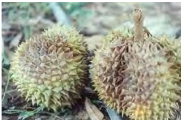
ภาพที่ 6 แสดงโรคผลเน่าในทุเรียน