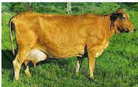
ภาพที่ 18 แสดงโคนมพันธุ์เอ เอฟ เอส

4. พันธุ์ เอ เอฟ เอส (Australian Friesian Sahiwal) เป็นพันธุ์ที่นำเข้ามาจากประเทศออสเตรเลีย เป็นโคนมลูกผสมระหว่างพันธุ์โฮลส์ไตน์ฟรีเซียน และพันธุ์ซาฮิวาล โดยมีสายเลือดโคนมพันธุ์โฮลส์ไตน์ฟรีเซียนที่ 75 เปอร์เซ็นต์ (โค AFS 3), 62.5 เปอร์เซ็นต์ (โค AFS2) และ 56.25 เปอร์เซ็นต์ (โค AFS 1) พบว่า ให้ผลผลิตน้ำนมเฉลี่ยรวมทุกระยะการให้นมของโค เอ เอฟ เอสทั้ง 3 สายพันธุ์ได้แก่ AFS3 , AFS2 และ AFS1 & AFS เท่ากับ 2,459 กิโลกรัม, 2,345 กิโลกรัม และ 2,606 (สมชาย, 2558)