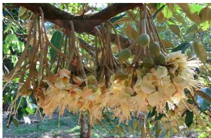
ภาพที่ 4 แสดงดอกของต้นทุเรียน

ทุเรียนมีลักษณะคล้ายระฆัง มีส่วนของ ดอกครบถ้วนและเป็นดอกสมบูรณ์เพศ มีรังไข่อยู่เหนือส่วนอื่นของดอกแต่ละ ดอกประกอบด้วย กลีบเลี้ยงอยู่ชั้นนอกสุดมีสีเขียวอมน้ำตาล หุ้มดอกไว้มิดชิดโดยไม่มีก้านกลีบแต่เมื่อดอกใกล้แย้ม จึงแยกออกเป็นสองหรือสามกลีบ กลีบรองลักษณะ คล้ายหม้อตาลโตนดอยู่ถัดเข้าไปจากกลีบเลี้ยง กลีบดอกสีขาวนวลมี 5 กลีบ เกสรตัวผู้มี 5 ชูด ประกอบด้วยก้านเกสร 5-8 อัน ทุเรียนมักออกดอกเป็นช่อๆ หนึ่งมีตั้งแต่ 1-30 ดอก ดอกมักอยู่รวมกันเป็นพวงๆ มี 1-8 ดอก