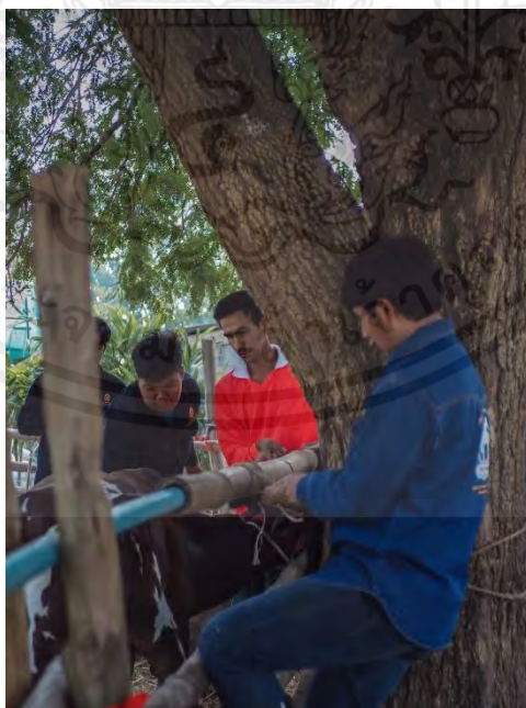
ภาพที่ ก2 ฉีดยาบำรุงและถ่ายพยาธิโค

เอกสารนี้เป็นเอกสารที่สงวนไว้สำหรับการใช้งานเพื่อการศึกษาเท่านั้น ไม่อนุญาตให้นำไปใช้ประโยชน์ด้านการค้า ไม่ว่ากรณีใดๆ ทั้งสิ้น อีกทั้งห้ามมิให้ตัดแปลงเนื้อหาและต้องอ้างอิงถึงเจ้าของเอกสารทุกครั้งที่มีการนำไปใช้