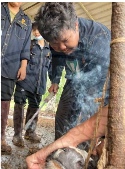
ภาพที่ ก1 การสุญเขาโค