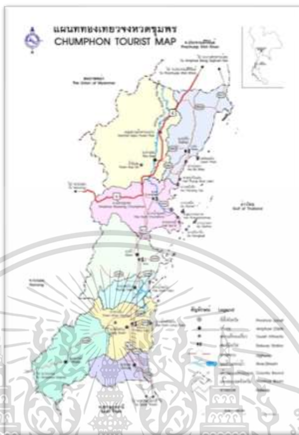
ภาพที่ 2.1 แผนที่ท่องเที่ยวจังหวัดชุมพร