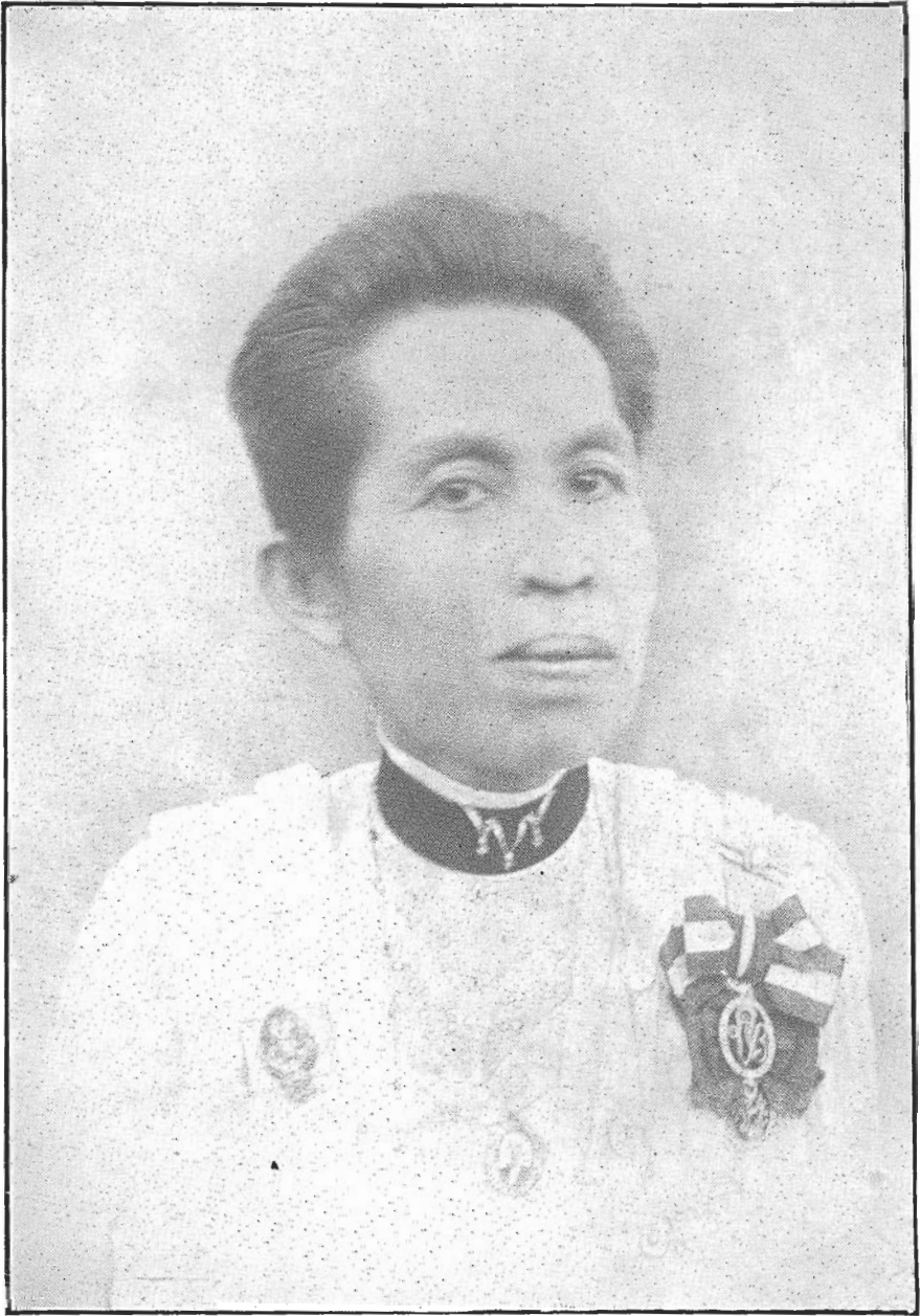
พระเจ้าบรมวงศ์เธอ พระองค์เจ้าอรุณวดี