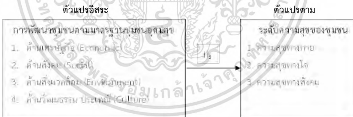
รูป 1 กรอบแนวคิดการศึกษาอิสระ

ผู้วิจัยได้พัฒนากรอบแนวคิด การพัฒนาชุมชนตามมาตรฐานชุมชนอุดมสุขที่ส่งผลต่อความสุขของชุมชนตำบลท่ายาง จังหวัดชุมพร ดังนี้