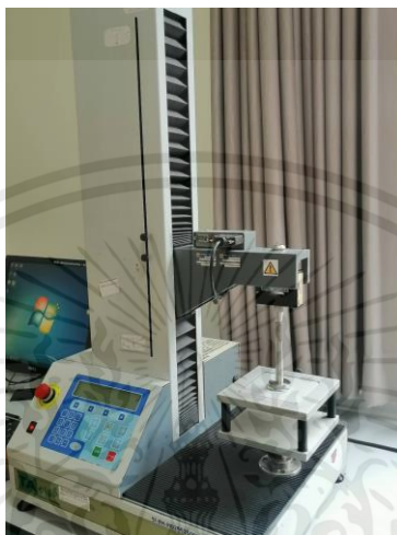
ภาคผนวกที่ ค. 1 การวัดค่าความแน่นเนื้อของผลิตภัณฑ์มอสซาเรลลาชีส