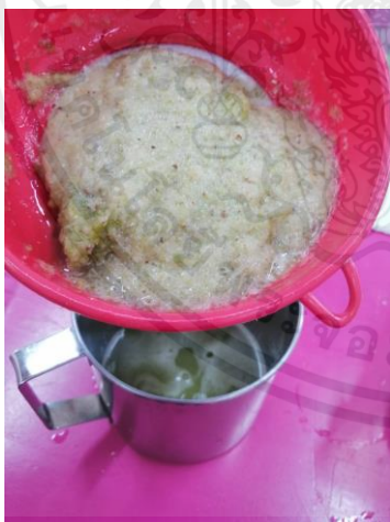
นำมากรองเพื่อแยกกาก