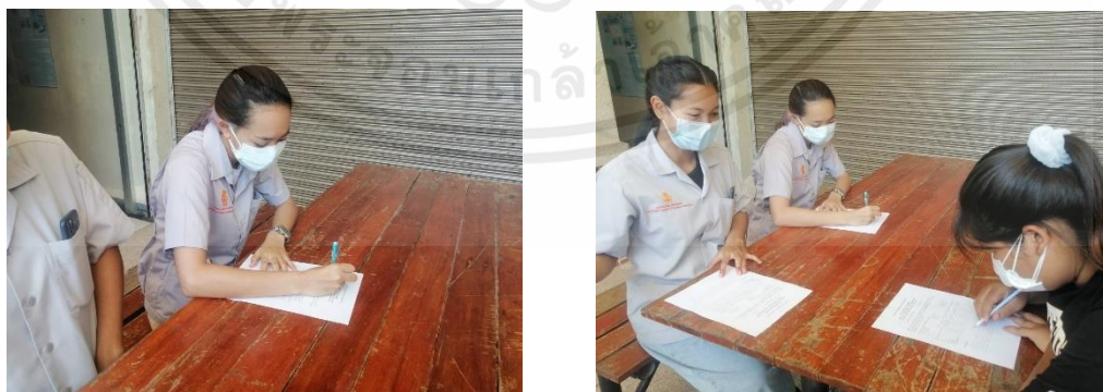
ภาพผนวกที่ ข.1 ผู้ทดสอบประเมินคุณภาพทางประสาทสัมผัส

เอกสารนี้เป็นเอกสารที่สงวนไว้สำหรับการใช้งานเพื่อการศึกษาเท่านั้น ไม่อนุญาตให้นำไปใช้ประโยชน์ด้านการค้าไม่ว่ากรณีใดๆ ทั้งสิ้น อีกทั้งห้ามมิให้ดัดแปลงเนื้อหาและต้องอ้างอิงถึงเจ้าของเอกสารทุกครั้งที่มีการนำไปใช้