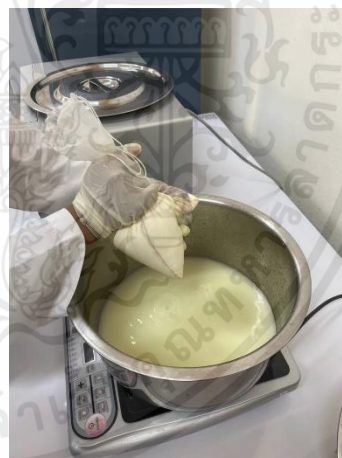
ตักเคิร์ดที่ได้ใส่ถุงกรอง และบีบเวย์ออกจากเคิร์ดให้ได้มากที่สุด

เอกสารนี้เป็นเอกสารที่สงวนไว้สำหรับการใช้งานเพื่อการศึกษาเท่านั้น ไม่อนุญาตให้นำไปใช้ประโยชน์ด้านการค้า ไม่ว่ากรณีใดๆ ทั้งสิ้น อีกทั้งห้ามมิให้ดัดแปลงเนื้อหาและต้องอ้างอิงถึงเจ้าของเอกสารทุกครั้งที่มีการนำไปใช้