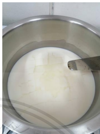
ใช้สแปตูล่าตัดเคิร์ดเป็นสี่เหลี่ยมเล็กๆ