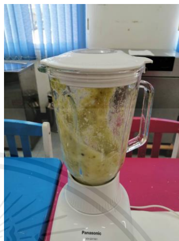
นำตะลิงปลิงไปปั่น เพื่อคั้นน้ำ