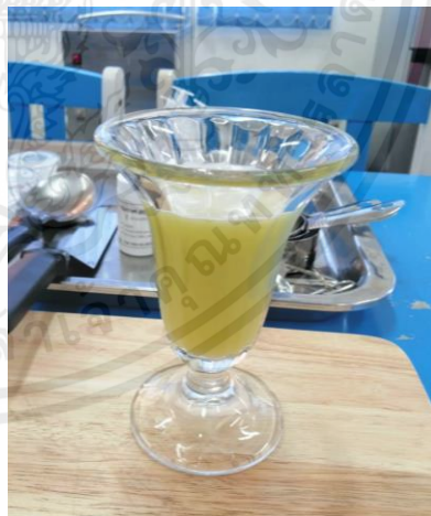
น้ำตะลิงปลิงที่ได้