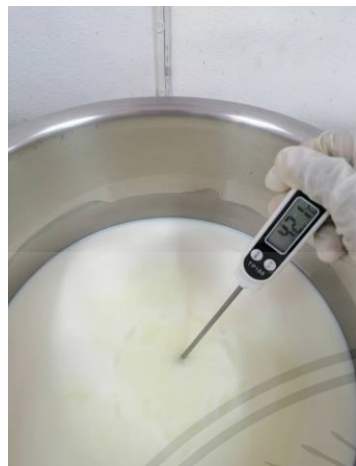
เปิดเตาอุ่นให้อุณหภูมิ 42 องศาเซลเซียส