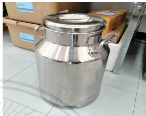
ภาพผนวกที่ ก.1 ส่วนผสมที่ใช้ในการผลิตมอสซาเรลลาชีสจากกรดตะลิงปริง