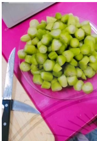
หั่นตะลิงปลิงเป็นชิ้นเล็กๆ