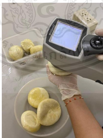
ภาคผนวกที่ ค. 2 การวัดค่าสี ( L^* a^* b^* ) ของผลิตภัณฑ์มอสซาเรลลาชีส

เอกสารนี้เป็นเอกสารที่สงวนไว้สำหรับการใช้งานเพื่อการศึกษาเท่านั้น ไม่อนุญาตให้นำไปใช้ประโยชน์ด้านการค้า ไม่ว่าจะกรณีใดๆ ทั้งสิ้น อีกทั้งห้ามมิให้ดัดแปลงเนื้อหาและต้องอ้างอิงถึงเจ้าของเอกสารทุกครั้งที่มีการนำไปใช้