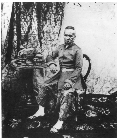
สมเด็จพระยาบรมมหาศรีสุริยวงศ์ (ช่วง บุนนาค) เป็นผู้กราบทูลขอกภัยโทษให้กับเจ้าจอมมารดาช่อนกลิ่น

สมุหพระกลาโหมเข้าเฝ้ารัชกาลที่ 4 อย่างรีบเร่ง แต่ไม่ได้กราบทูลเรื่องเจ้าจอมมารดาช่อนกลิ่นโดยตรง ท่านทำเป็นไม่รู้ โดยกราบบังคมทูลว่า การประกาศแต่งตั้งเจ้าเมืองนั้นล่าช้าเนื่องจากยังไม่ได้พิมพ์และออกประกาศโดยทั่ว จึงไม่มีใครทราบว่ารัชกาลที่ 4 โปรดเกล้าฯ แต่งตั้งตำแหน่งดังกล่าวไปแล้ว เรื่องจึงเป็นอันยุติ ไม่นานจากนั้นเจ้าจอมมารดาช่อนกลิ่นจึงถูกปล่อยตัวออกจากคุกมีตัว