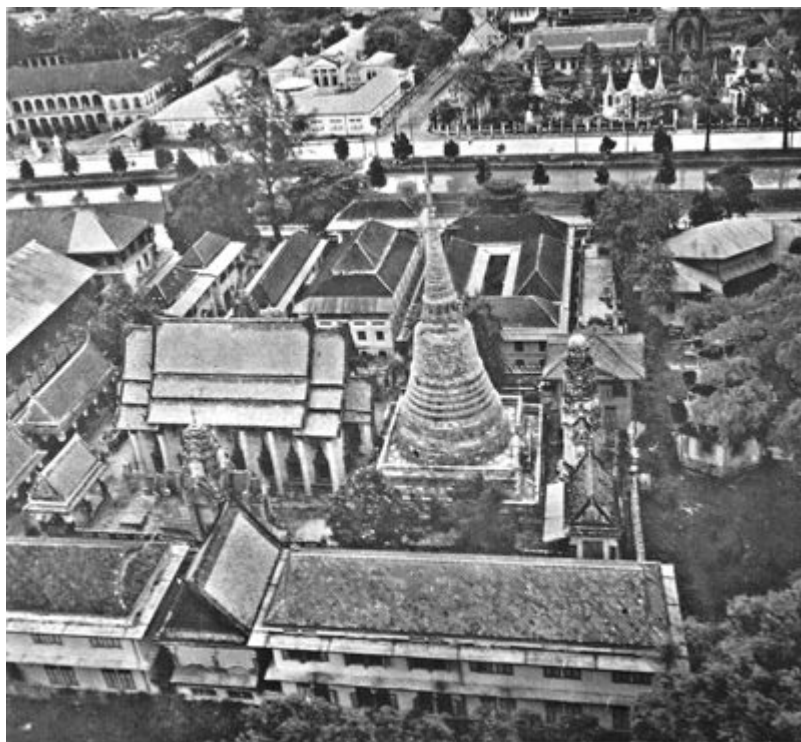
วัดราชประดิษฐสถิตมหาสีมาราม พระอารามหลวงสร้างในสมัยพระบาทสมเด็จพระจอมเกล้าเจ้าอยู่หัว มีจารึกอักษรอริยกะอยู่ด้านหลังพระอุโบสถ

ดังนั้น “อักษรอริยกะ” จึงเป็นอักษรที่ได้รับอิทธิพลทางรูปแบบตัวอักษรและอิทธิพลทางด้านอักษรวิธีในการเขียนจาก “อักษรโรมัน” นั่นเอง