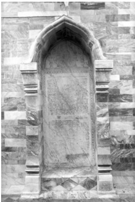
ศิลาจารึกวัดราชประดิษฐ์ เป็นจารึกหินอ่อนสีขาว จารึกเป็นอักษรอริยกะและอักษรไทยอยู่ที่ผนังด้าน หลังพระวิหารหลวง

เมื่อพิจารณารูปแบบอักษรอริยกะแล้วจะพบว่าอักษรอริยกะเป็นอักษรที่ได้อิทธิพลรูปแบบตัวอักษรจากอักษร “โรมัน” เป็นอย่างมาก ทั้งนี้เห็นได้จากรูปแบบตัวอักษรและในลักษณะที่มีการแบ่งอักษรอริยกะเป็น 2 กลุ่ม คือ