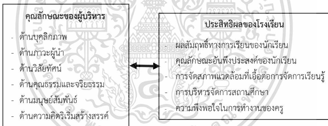
ภาพที่ 1.1 กรอบแนวคิดในการวิจัย

จากแนวคิดดังกล่าวผู้วิจัยสามารถสรุปกรอบแนวคิดในการวิจัยได้ ดังภาพที่ 1.1