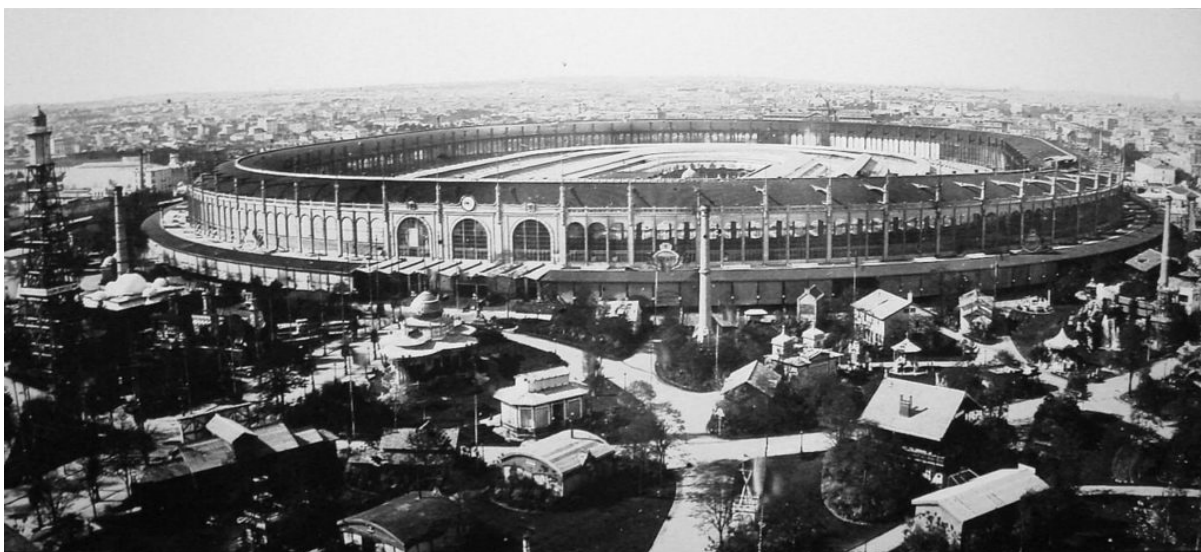
อาคารหลักในงานมหกรรมโลก Paris Exposition Universelle ณ กรุงปารีส ฝรั่งเศส ค.ศ. 1889

งานจัดขึ้นในบริเวณช็องเดอมาร์ส (Champ de Mars) ริมน้ำแซน เนื้อที่จัดงานราว 119 เอเคอร์ หรือประมาณ 300 ไร่ ซึ่งแต่เดิมเป็นที่สวนสนามของทหารฝรั่งเศส มีการก่อสร้างอาคารหลักขนาดใหญ่เป็นรูปสี่เหลี่ยมผืนผ้าปลายมน ยาว 1,608 ฟุต (490 ม.) กว้าง 1,247 ฟุต (380 ม.) ภายในอาคารมีส่วนแสดงนวัตกรรมและของแปลกประหลาดจากทั่วทุกมุมโลก รวมถึงความบันเทิงหลายรูปแบบ และร้านค้าจำนวนมากที่จำหน่ายสินค้าและของที่ระลึกต่าง ๆ จากต่างประเทศ ส่วนบริเวณนอกอาคารก็ล้อมรอบด้วยอาคารย่อย ๆ อีกหลายร้อยอาคาร มีพื้นที่กิจกรรมอื่น ๆ รวมถึงศาลาของชาติต่าง ๆ