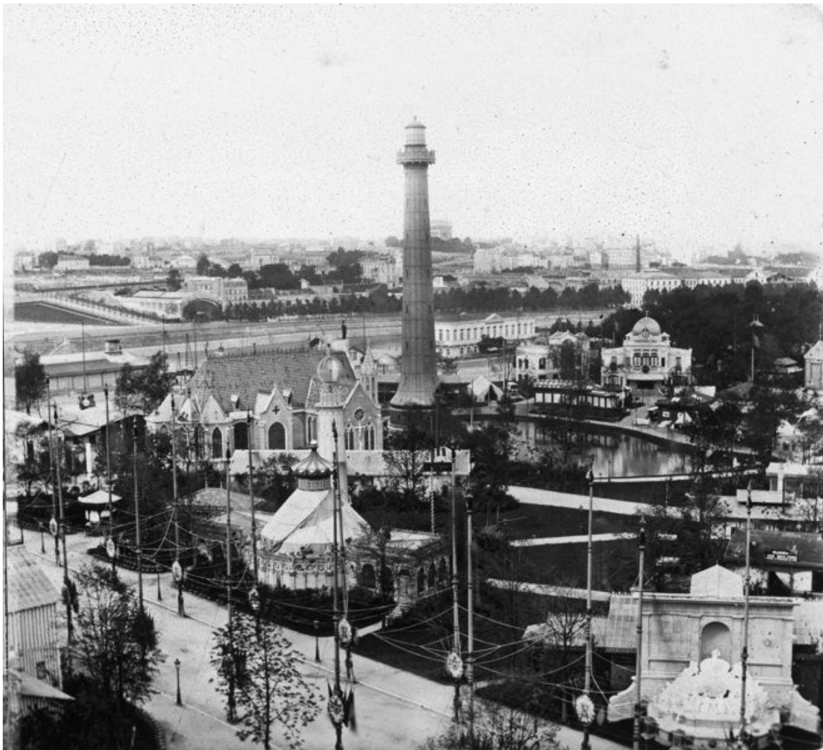
ศาลา (Pavilion) ของชาติต่าง ๆ ในงานมหกรรมโลก Paris Exposition Universelle ณ กรุงปารีส ฝรั่งเศส ค.ศ. 1867