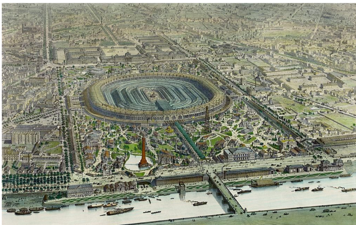
งานมหกรรมโลก Exposition Universelle ณ กรุงปารีส ฝรั่งเศส ค.ศ. 1867

คณะราชทูตออกเดินทางจากกรุงเทพฯ ในวันอาทิตย์ที่ 20 มกราคม พ.ศ. 2409 (ค.ศ. 1867) โดยเรือกำปั่นชื่อเจ้าพระยา และเจ้าพระยาสุรวงศ์ไวยวัฒน์ได้พาภรรยาหลวงของท่านคือ ท่านผู้หญิงอ่วม เดินทางไปกับคณะราชทูตด้วย ท่านผู้หญิงอ่วมจึงถือเป็นสตรีชาวสยามคนแรกๆ ที่เดินทางไปทวีปยุโรป (ไกรฤกษ์ นานา, 2552 : 28)