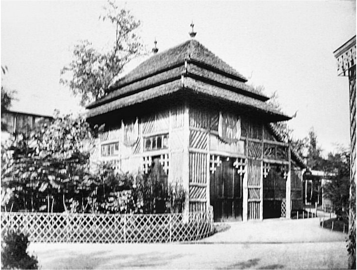
ศาลาของประเทศไทย งานมหกรรมโลก Paris Exposition Universelle ณ กรุงปารีส ฝรั่งเศส ค.ศ. 1867