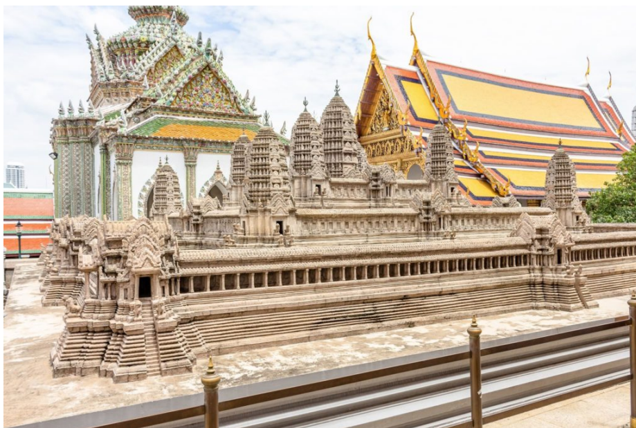
ปราสาทนครวัดจำลอง บนฐานไฟที่ข้างพระมณฑป วัดพระศรีรัตนศาสดาราม

หมายเหตุ ค้นคว้าเพิ่มเติมได้ใน ชาญวิทย์ เกษตรศิริ. วิถีไทย การท่องเที่ยวทางวัฒนธรรม. 2540. หรืออ่านเพิ่มเติม http://lib.dtc.ac.th/ebook/SocialScience/tbj174.pdf