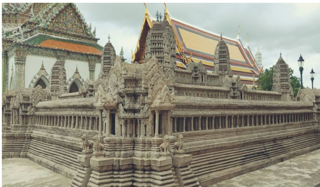
ปราสาทนครวัดจำลอง วัดพระศรีรัตนศาสดาราม

แต่ที่น่าสนใจก็คือ การรื้อถอนปราสาทหินครั้งนั้นล้มเหลว และพระราชพงศาวดารฯ กล่าวไว้ว่า น่าตกใจว่า มีเขมรประมาณ 300 คนออกมาแต่ป่า เข้ายิงฟันพวกรื้อปราสาท ฆ่าพระสุพรรณพิศาลตายคน 1 พระวังตายคน 1 บุตรพระสุพรรณพิศาลตายคน 1 ไล่แทงฟันพระมหาดไทย พระยกกระบัตรป่วยเจ็บหลายคน แต่ไพร่นั้นไม่ทำอันตรายแล้วหนีเข้าป่าไป