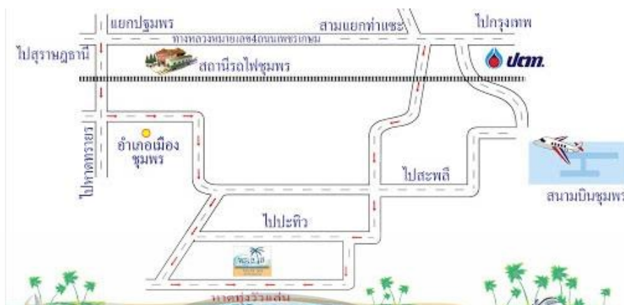
ภาพที่ 4 แผนที่การเดินทางหาดทุ่งวัวแล่น จังหวัดชุมพร