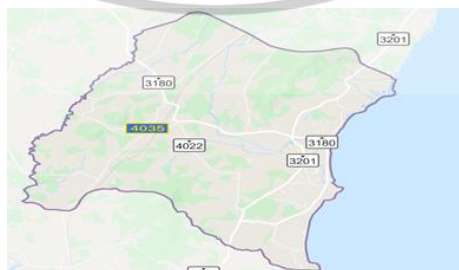
ภาพที่ 2 แผนที่อาณาเขตตำบลสะพลี

ตำบลสะพลี เป็นตำบลที่ตั้งอยู่ในเขตการปกครองของอำเภอปะทิว ประกอบด้วย 10 หมู่บ้าน ได้แก่ หมู่ 1 บ้านหนองปลาไหล หมู่ 2 บ้านปากด่าน หมู่ 3 บ้านดอนคา หมู่ 4 บ้านควน หมู่ 6 บ้านพรุใหญ่ หมู่ 7 บ้านคลองใหญ่ หมู่ 8 บ้านทุ่งวัวแล่น หมู่ 9 บ้านห้วยตาอ่อน หมู่ 10 บ้านฝายเขา มีอาณาเขต ดังนี้ ทิศเหนือติดกับตำบลบางสน อำเภอปะทิว จังหวัดชุมพร ทิศใต้ติดกับ ตำบลนาชะอัง อำเภอเมือง จังหวัดชุมพร ทิศตะวันออกติดกับอ่าวไทย และทิศตะวันตกติดกับตำบลนากระตาม อำเภอท่าแซะ จังหวัดชุมพร (สำนักเทศบาลตำบลสะพลี, 2557)