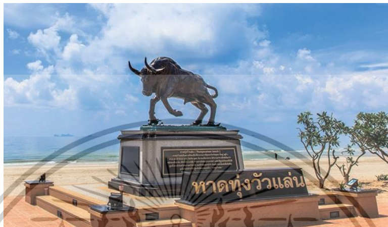
ภาพที่ 3 หาดทุ่งวัวแล่น

ผ่านมา จึงช่วยกันกระหน่ำกระสุนใส่วัวผู้เคราะห์ร้ายลงไปในอนแดดจ้า ร้องโอดครวญก่อนหมดลมหายใจ จากนั้นเหล่านายพรานจึงนำวัวไปแล้วเนื้อเพื่อเตรียมย่างกิน พร้อมคุ้ยไม้ไผ่อดไฟมือ แต่ไม่ทันขาดคำวัว เจ้าวัวที่โดนถลกหนังไปครึ่งตัวกลับลุกขึ้นมาอย่างหืดหอบ และวิ่งหนีเข้าป่าไปเหล่านายพรานถึงกับตกตะลึงและหวาดผวา จึงเป็นที่มาของ“หาดทุ่งวัวแล่น”