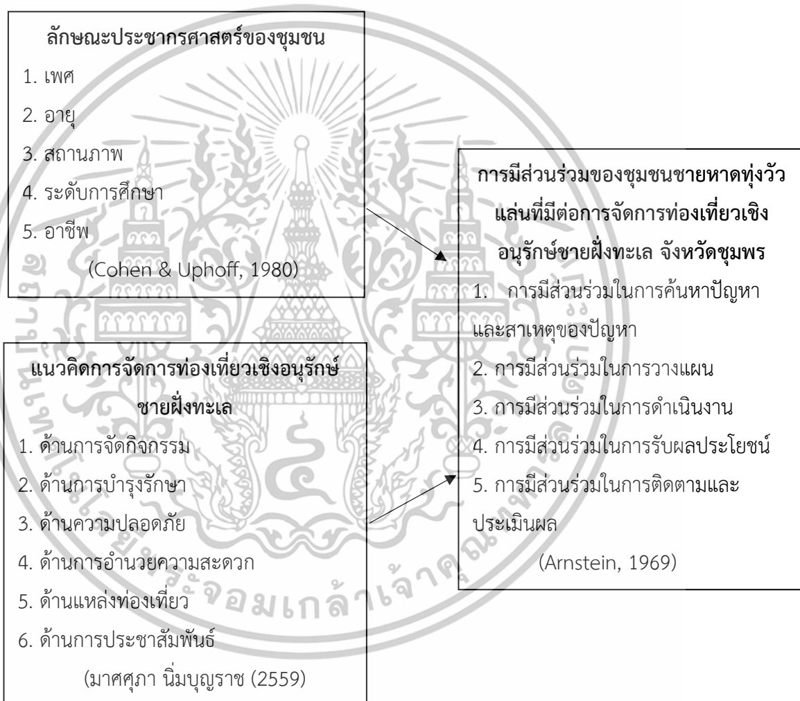
ภาพที่ 1 กรอบแนวคิดการศึกษา