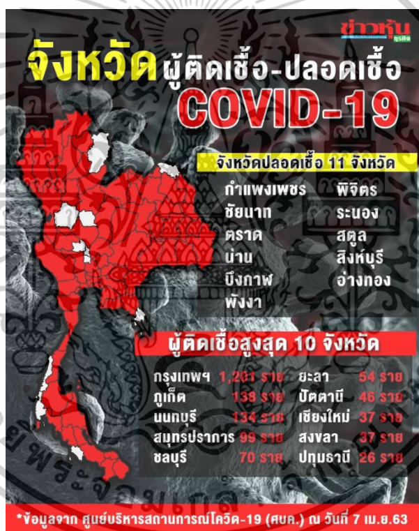
ภาพที่ 1.1 แสดงจังหวัดผู้ติดเชื้อ - ปลอดเชื้อ COVID – 19 ณ วันที่ 7 เมษายน พ.ศ. 2563

การป้องกันการแพร่ระบาดของไวรัสโควิด-19 ของเมืองเล็ก ๆ ในประเทศไทย ที่อยู่ห่างไกลจากเมืองหลวง อย่างจังหวัดระนอง พื้นที่ไกล ที่ขาดแคลนบุคลากรทางการแพทย์ พยาบาล ที่มีเป็นจำนวนน้อย แต่ด้วยมาตรการความร่วมมือร่วมใจของชาวระนองกว่า 1.9 แสนคน สามารถที่จะยับยั้งมือรักษาพื้นที่ จ.ระนอง ให้เป็นสีขาวปลอดจากโรคระบาดร้ายโควิด-19 ได้ยาวนาน จนถึงปัจจุบัน ทำให้กลายเป็น “ระนองโมเดล ปลอด Covid-19” ที่หลายประเทศสนใจและเตรียมเก็บข้อมูลศึกษา เนื่องจากนานาประเทศมลรัฐต่าง ๆ ในยุโรป อเมริกาที่มีความพร้อมมากกว่า จังหวัดระนอง หลายเท่าตัว ยังไม่สามารถรับมือกับสถานการณ์การแพร่ระบาดของโรคในครั้งนี้ ได้ดีเท่าจังหวัดระนอง โรคระบาดที่แพร่ขยายอย่างรวดเร็ว ผู้คนในเมืองเหล่านั้นเจ็บป่วยล้มตายเป็นจำนวนมาก แต่พื้นที่สีขาวเล็ก ๆ ของจังหวัดระนองยังสามารถยืนหยัดอยู่ได้ แม้รอบข้างจะถูกไวรัสโอบล้อมจ่อข้ามแดนแล้วก็ตามที่