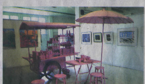
ชมงานศิลปะหลากหลายแนวที่หอศิลป์วิทยาลัยช่างศิลป์ลาดกระบัง