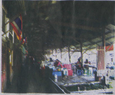
ตลาดเก่าหัวตะเข้ที่ค่อนข้างเงียบเหงา