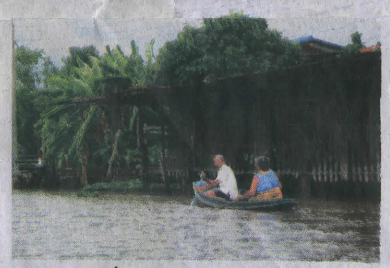
ภาพวิถีชีวิตที่พบเห็นได้ริมคลอง

แวะเข้าไปที่ "โรงเจเฮงเต๋ว" ซึ่งมีองค์เขียน หรือ พระโพธิสัตว์เมื่เคี้ยว ซึ่งเมื่อร้อยปีก่อนท่านได้เดินทางมาจากเมืองจีนมาพำนักอยู่ในแถบลาดกระบังนี้ ท่านเป็นผู้ยึดมั่นในหลักธรรมคำสั่งสอนของพระพุทธเจ้าด้วยการถือศีลกินเจ สวดมนต์ภาวนาอยู่ในโรงเจแห่งนี้จนได้ฌานสมาบัติ ละสังขารไปในขณะกำลังนั่งสมาธิอยู่ ร่างที่ไม่เก่าเบียดของท่านยังคงมีผู้มาเคารพกราบไหว้กันที่โรงเจแห่งนี้