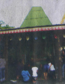
สักการะอนุสาวรีย์เจ้าจอมมารดาภินที่วัดสุทธาโภชน

สอบถามรายละเอียดการนั่งเรือท่องเที่ยว คลองประเวศบุรีรัมย์ได้ที่สำนักงานเขตลาดกระบัง โทร.0-2326-9149