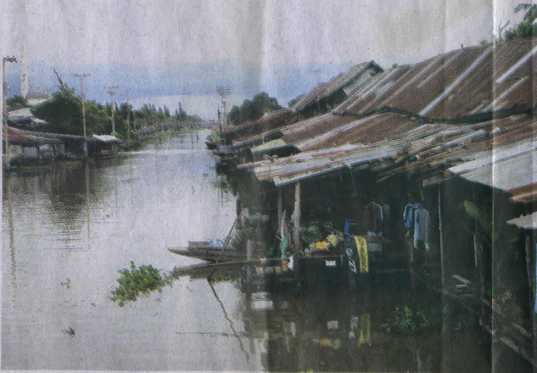
บรรยากาศริมคลองประเวศบุรีรัมย์

ประเวศบุรีรัมย์ และต่อมายังได้ขุดคลองแยกจากคลองประเวศบุรีรัมย์อีก 4 คลอง คือ คลองหนึ่ง คลองสอง คลองสาม และคลองสี่