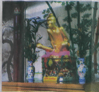
หุ่นองค์เขียนที่โรงเจเฮงเต๋ว