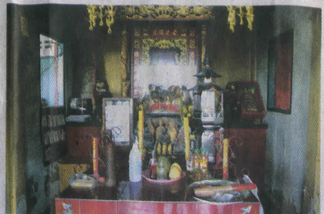
ชมหัวและหางกระเซ่ที่ศาลเจ้าพ่อหัวตะเข้