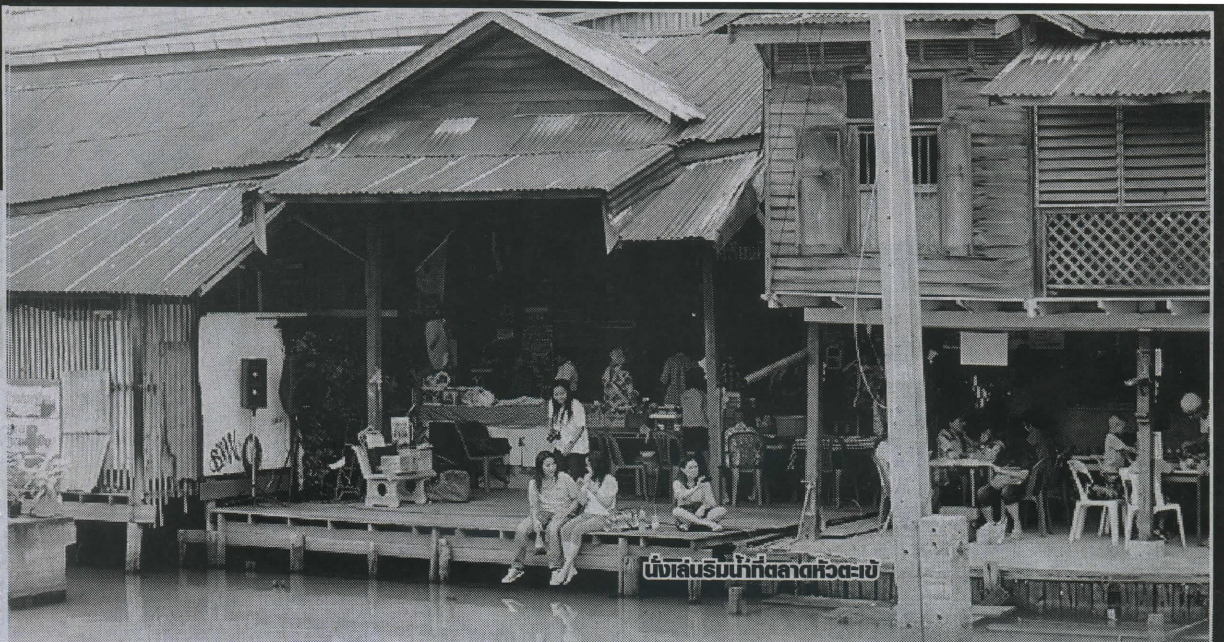
นั่งเล่นรับน้ำที่ตลาดหัวตะเข้