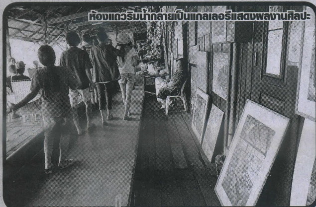
ห้องแกลอรีบ้านกลายเป็นแกลลอรีแสดงผลงานศิลปะ