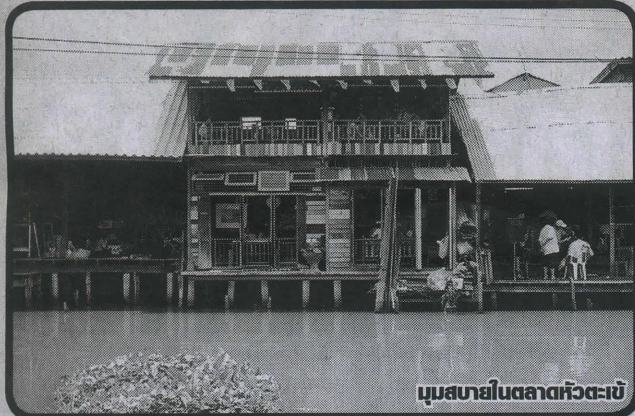
มุมสบายในตลาดหัวตะเข้