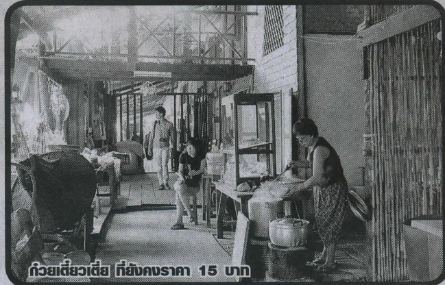
ก๊วยเตี่ยวเตี้ย ที่ยังคงราคา 15 บาท