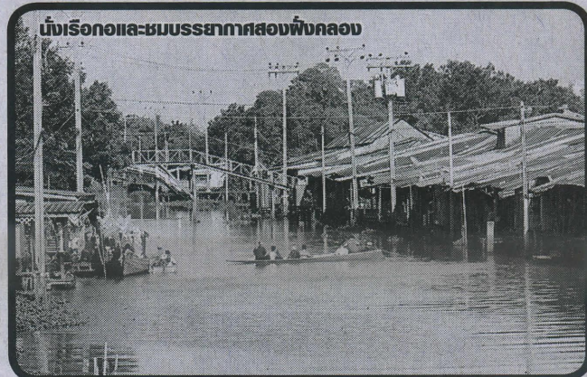
บ้านเรือกลและชมบรรยากาศสองฝั่งคลอง