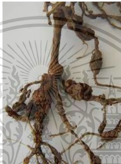
ภาพที่ 6 โรคเน่าของเหง้าสั๊ก

โรคเน่าของเหง้าสั๊กเกิดจากเชื้อสาเหตุชื่อลัสซิโอดีปโพลเดียอีโอโบรมี ( Lasiodiplodia theobromae ) เกิดจากเชื้อราเข้าทำลายเหง้าขณะเก็บรักษา ดังนั้นควรตัดแต่งส่วนของเหง้าสั๊กแล้วจุ่มสารเคมีป้องกันเชื้อรา ผึ่งให้แห้ง ก่อนนำไปเก็บเพื่อรอการปลูก