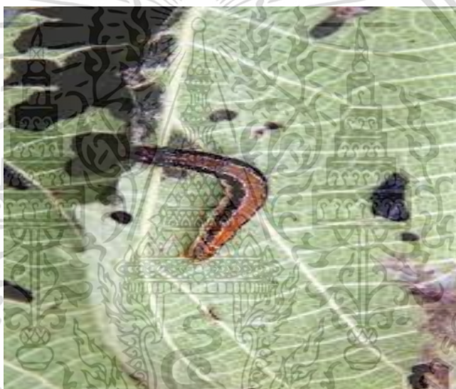
ภาพที่ 7 หนอนผีเสื้อเจาะต้นสัก

รอยแตก หรือใต้เปลือกสักแล้ววางไข่เป็นฟองเดี่ยว รูปร่างเล็ก มีสีเหลืองสด อยู่เรียงกันรวมเป็นกลุ่ม ระยะการฟักไข่ ประมาณ 10-15 วัน แล้วเข้าระยะหนอน (Larva) ซึ่งหนอนจะมีลำตัวเป็นปล้อง ชัดเจน แต่ละปล้องมีแถบสีขาวสลับกับแถบสีชมพู หนอนเจาะเข้าทำลายเนื้อไม้ ของต้นสักขณะที่ต้นสักยังมีชีวิต ทำให้เนื้อไม้เป็นรูหรือร่องในเนื้อไม้อย่างถาวร รูนี้อาจจะสะสมทุกๆ ปี ตลอดการเติบโตของต้นสัก ต้นสักไม่ตายแต่เนื้อไม้ภายใน ต้นสักถูกเจาะทำลายเป็นร่อง ทำให้ไม้มีคุณภาพไม่ดี เมื่อแปรรูป แผ่นไม้จะมีรู มีร่อง เป็นจำนวนมาก หนอนผีเสื้ออาศัยในต้นสัก ประมาณ 9-10 เดือน แล้วเข้าดักแด้ (Pupa) ภายในต้นสัก บริเวณด้านในสุดของรู หรือร่องที่หนอนเจาะ ลักษณะดักแด้ รูปทรงกระบอกเรียวปลาย มีสีน้ำตาล ไม่มี รยางค์ โครคและแมลงศัตรูสัก (ม.ป.ป)