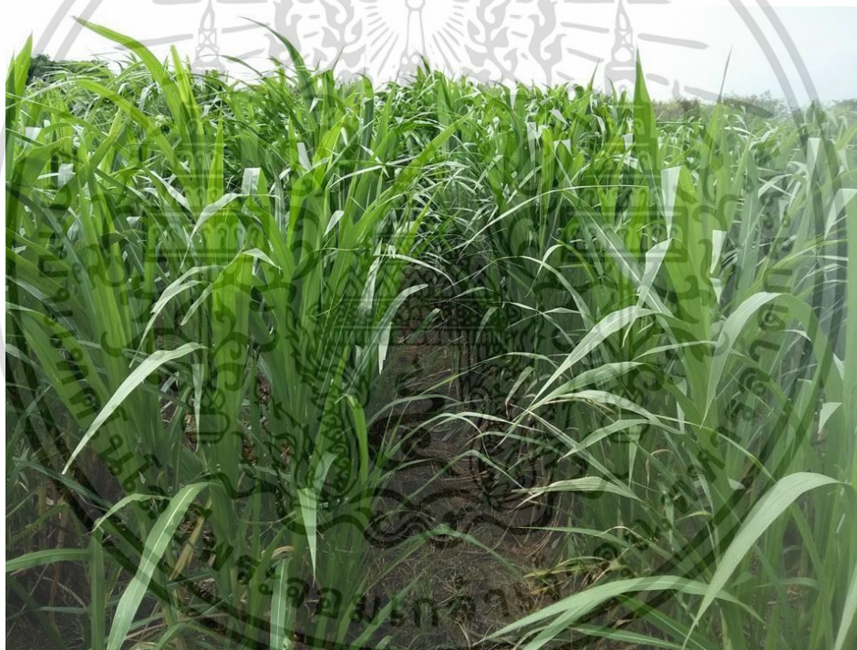
ภาพที่ 10 หญ้าเนเปียร์(Napier Grass)