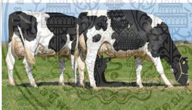
ภาพที่ 8 โคนมพันธุ์โฮลส์ไตน์ฟรีเซียน

1. โคนมพันธุ์โฮลส์ไตน์ฟรีเซียน (Holstein Friesian) เป็นโคนมพันธุ์ที่กรมปศุสัตว์ได้คัดเลือกให้เป็นพันธุ์หลักในการปรับปรุงพันธุ์โคนมของประเทศ โคนพันธุ์นี้มีถิ่นกำเนิดในประเทศเนเธอร์แลนด์ ซึ่งอยู่ในทวีปยุโรป สำหรับโคนพันธุ์นี้ในทวีปยุโรปมักนิยมเรียกว่าพันธุ์ฟรีเซียน (Friesian) ซึ่งชื่อนี้สอดคล้องกับเมืองฟรีแลนด์(Friesland) ซึ่งอยู่ทางตอนเหนือของเนเธอร์แลนด์ แต่ในทวีปอเมริกาเหนือ โดยเฉพาะประเทศสหรัฐอเมริกา และ แคนาดา เรียกโคนมพันธุ์นี้ว่า พันธุ์โฮลส์ไตน์ (Holstein) ซึ่งคาดว่าเรียกตามชื่อรัฐ Holstein ซึ่งอยู่ในประเทศเยอรมัน แต่สำหรับประเทศไทยรวมทั้งหลาย ๆ ประเทศได้มีการนำเข้าน้ำเชื้อ และตัวโคจากประเทศในยุโรป, สหรัฐอเมริกา และแคนาดาจึงมีการเรียกโคนพันธุ์นี้รวมว่าพันธุ์โฮลส์ไตน์ฟรีเซียน (Holstein Friesian) โคนพันธุ์นี้มีขนาดใหญ่เพศผู้หนัก 800 – 1,000 กิโลกรัม เพศเมียน้ำหนัก 500 – 800 กิโลกรัม ผลิตน้ำนมเฉลี่ย 6,000 - 7,000 กิโลกรัม ต่อ ระยะเวลาให้นม มีนิสัยค่อนข้างเชื่อง รีดนมง่ายไม่ตะเะ หรือ อั้นน้ำนม