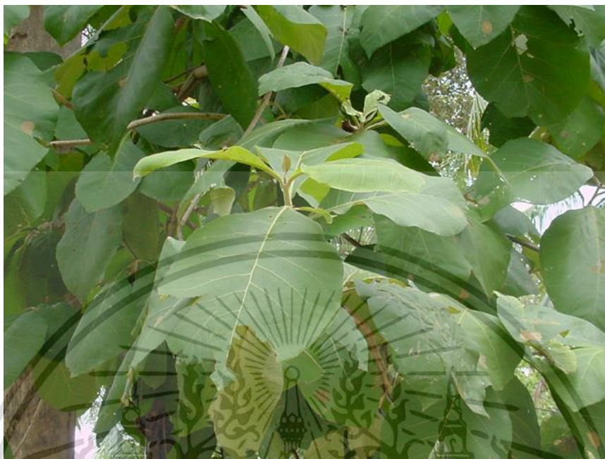
ภาพที่ 1 ต้นสัก