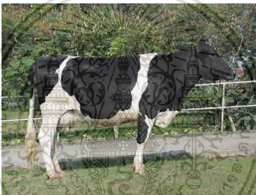
ภาพที่ 9 โคไทยฟรีเซียน

2. โคไทยฟรีเซียน (Thai Friesian Cattle) โคไทยฟรีเซียน เป็นโคนมพันธุ์ผสมที่มีเลือดโคนมพันธุ์โฮลสไตน์ฟรีเซียนสูงกว่า 75% หรือที่เกษตรกรทั่วไปเรียกว่า โคนมเลือดสูง เหมาะสำหรับเกษตรกรที่มีประสบการณ์การเลี้ยงโคนมมาแล้ว ภายใต้ระบบการเลี้ยงดูที่มีระดับการจัดการอาหารที่ดีให้ผลผลิตน้ำนมสูงและที่สำคัญสามารถปรับตัวเข้ากับสภาพแวดล้อมของ ประเทศไทยได้ลักษณะประจำพันธุ์ สีลำตัวสีขาวตัดกับดำโดยเด็ดขาด บางตัวอาจจะมีสีขาวหรือสีดำมาก ขนาด เพศเมียมีน้ำหนักโตเต็มที่ 500 กิโลกรัม เพศผู้มีน้ำหนักโตเต็มที่ 550 - 600 กิโลกรัม ส่วนหัว กลมกลืน เนื้อนุ่มใหญ่ รูจมูกเปิดกว้าง กรามแข็งแรง ตาใส ตาโต หน้าผากกว้างเป็นจานเล็กน้อย ตั้งจมูกตรง ใบหูขนาดปานกลาง ดูกระตือรือร้น