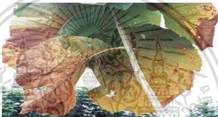
ภาพที่ 2 โรคราสนิม

โรคราสนิมเกิดจากเชื้อสาเหตุชื่อโอลิเวียเทคโทนี ( Olivea tectonae ) ซึ่งเชื้อสามารถเจริญได้บนผิวใบและหลังใบ ลักษณะของแผลเป็นตุ่มสีสนิม เมื่อแผลแตกจะปรากฏกลุ่มของสปอร์สีเหลืองส้ม โรคนี้สามารถกระจายได้ทุกภาค ของประเทศ ถ้าความชื้นสูงอาการของโรคจะเห็นได้ชัดเจน ความเสียหายจะไม่รุนแรง เพราะเชื้อราไม่สามารถทำให้ต้นสั๊กตายได้ เนื่องจากต้นสั๊กจะมีการผลัดใบ เมื่อสั๊กผลิใบใหม่อาการจะดีขึ้นตามธรรมชาติ จึงไม่มีความจำเป็นต้อง ใช้สารเคมีฆ่าเชื้อราควบคุมโรค