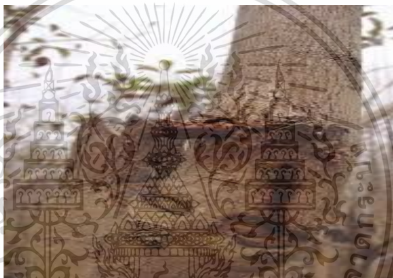
ภาพที่ 4 โรคแผลแตกตามลำต้น

โรคแผลแตกตามลำต้นเกิดจากเชื้อสาเหตุใด ยังไม่ทราบแน่ชัด เป็นอาการที่เกิดจากต้นสักถูกเชื้อราเข้าทำลายภายหลังจากการเกิดรอยแผลจาก การลิดกิ่ง แมลงเจาะ ไฟไหม้หรือเกิดความเครียดจากภัยแล้งเป็นเวลานาน เชื้อรา จึงเป็น Secondary-infection ในการก่อโรค หากพบอาการไม่รุนแรงให้ฉากเปลือก บริเวณแผลส่วนที่มีสีน้ำตาล หรือสีดำออกทาด้วยสารเคมีควบคุมเชื้อราเช่นโคเฟน จะช่วยแผลสมานและปิดเร็วขึ้น