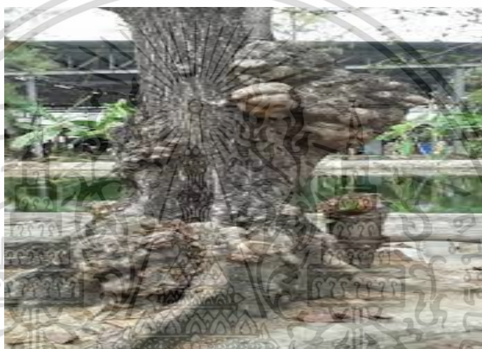
ภาพที่ 5 โรคปุ่มปม

โรคปุ่มปมเกิดจากเชื้อสาเหตุใด ยังไม่ทราบแน่ชัด อาการปุ่มปม เป็นลักษณะผิดปกติของต้นสัก ปุ่มปมจะเกิดบริเวณกิ่ง และลำต้น ทำให้เกิด เป็นรอยแผลแตกตามยาวตลอดแนวที่เกิดปุ่มปม หากเกิดรุนแรงต้นสักจะยืนต้นตาย สาเหตุการเกิดปุ่มปม ยังไม่ทราบแน่ชัด