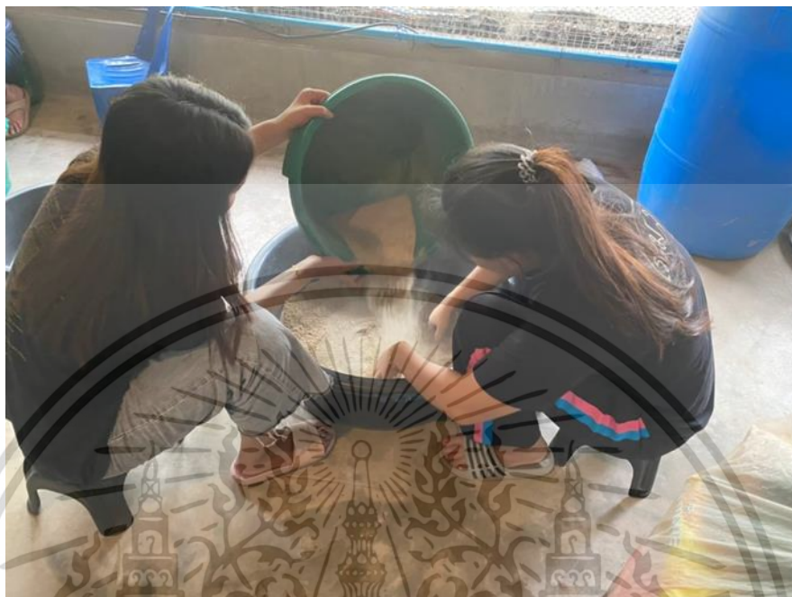
ภาพผนวกที่2 การผสมไบโอพรีคในสูตรอาหาร