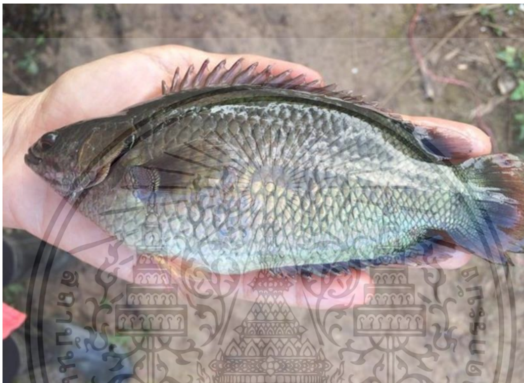
ภาพที่ 1 ปลาหมอ (Climbing perch)