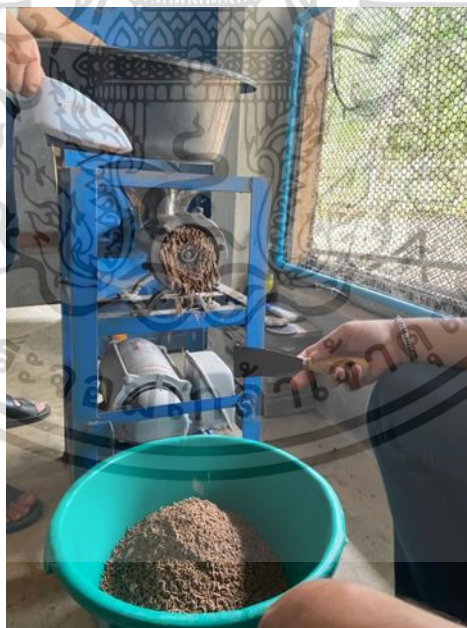
ภาพผนวกที่3 นำอาหารที่ผสมแล้วมาเข้าเครื่องอัดอาหารเม็ดจน

เอกสารนี้เป็นเอกสารที่สงวนไว้สำหรับการใช้งานเพื่อการศึกษาเท่านั้น ไม่อนุญาตให้นำไปใช้ประโยชน์ด้านการค้า ไม่ว่าจะกรณีใดๆ ทั้งสิ้น อีกทั้งห้ามมิให้ดัดแปลงเนื้อหาและต้องอ้างอิงถึงเจ้าของเอกสารทุกครั้งที่มีการนำไปใช้