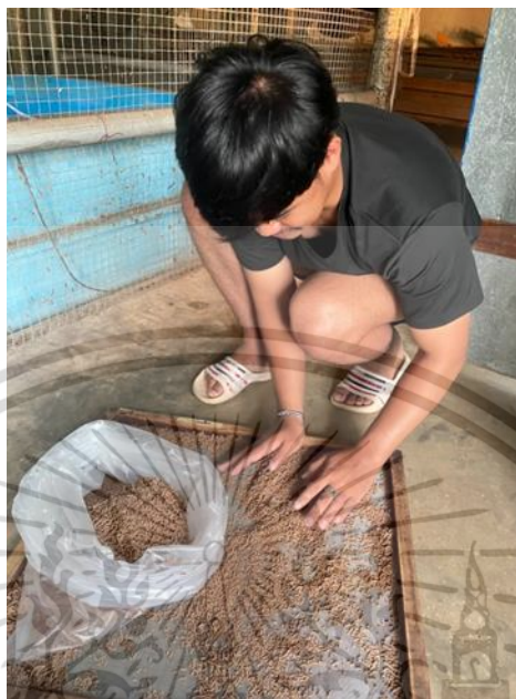
ภาพผนวกที่7 เมื่ออาหารแห้งเก็บใส่ถุงซึ่งน้ำหนักเก็บไว้ในที่แห้ง