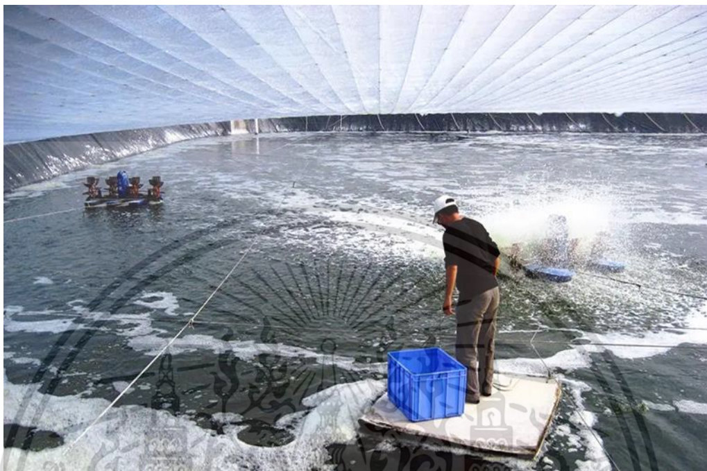
ภาพที่ 2 Biofloc ในบ่อกุ้ง

ที่มา : Global Aquaculture Alliance's, 2010