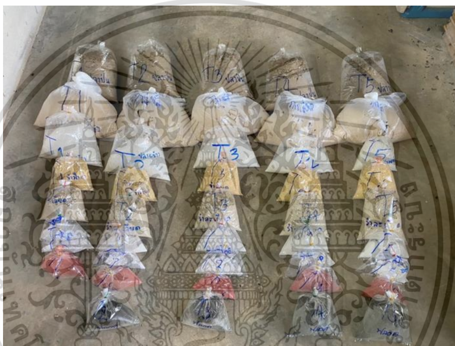
ภาพผนวกที่1 เตรียมวัตถุดิบเพื่อผสมไบโอพรอดในสูตรอาหาร

เอกสารนี้เป็นเอกสารที่สงวนไว้สำหรับการใช้งานเพื่อการศึกษาเท่านั้น ไม่อนุญาตให้นำไปใช้ประโยชน์ด้านการค้า ไม่ว่ากรณีใดๆ ทั้งสิ้น อีกทั้งห้ามมิให้ตัดแปลงเนื้อหาและต้องอ้างอิงถึงเจ้าของเอกสารทุกครั้งที่มีการนำไปใช้