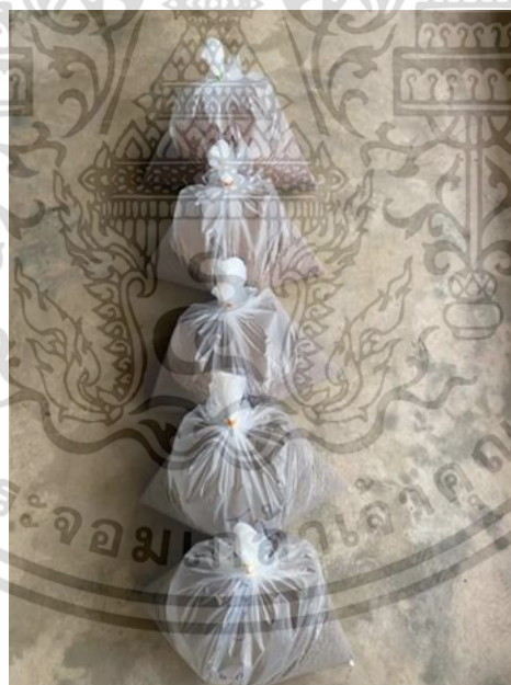
ภาพผนวกที่8 บรรจุอาหารที่แห้งสนิทใส่ถุงซึ่งน้ำหนักเรียบร้อย