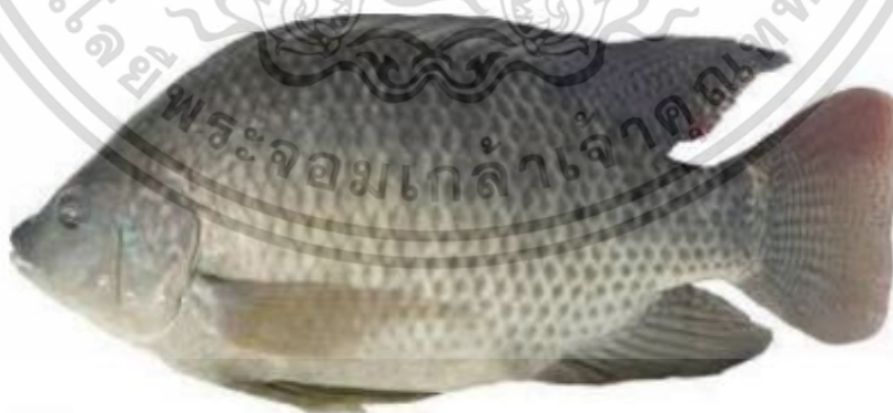
ภาพที่1 : ปลานิล (Nile tilapia)