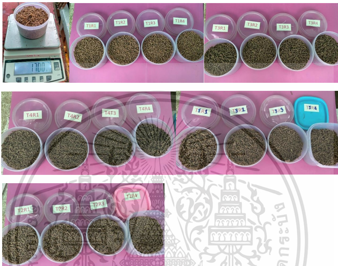
ภาคผนวกที่ 6 ซังอาหารก่อนให้ครั้งแรก 170 กรัม