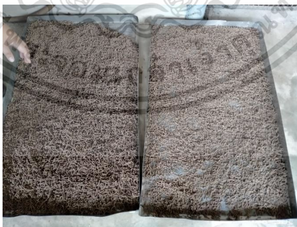
ภาคผนวกที่ 5 อาหารที่อบแห้ง

เอกสารนี้เป็นเอกสารที่สงวนไว้สำหรับการใช้งานเพื่อการศึกษาเท่านั้น ไม่อนุญาตให้นำไปใช้ประโยชน์ด้านการค้า ไม่ว่าจะกรณีใดๆ ทั้งสิ้น อีกทั้งห้ามมิให้ดัดแปลงเนื้อหาและต้องอ้างอิงถึงเจ้าของเอกสารทุกครั้งที่มีการนำไปใช้