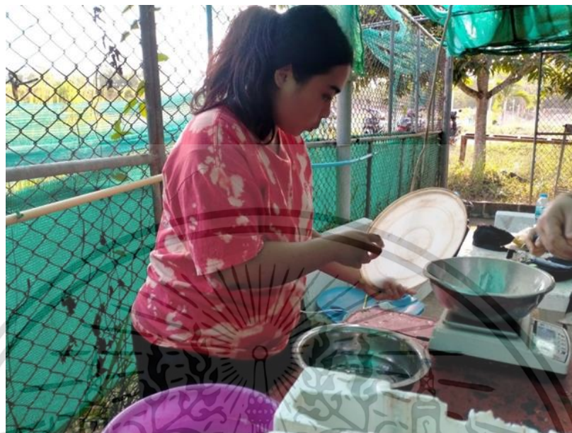
ภาคผนวกที่ 1 ชั่งขนาดปลาเริ่มต้นการทดลอง