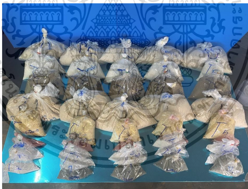
ภาคผนวกที่ 2 วัตถุดิบอาหารที่ชั่งแล้วจัดเรียงตามทริทเมนต์

เอกสารนี้เป็นเอกสารที่สงวนไว้สำหรับการใช้งานเพื่อการศึกษาเท่านั้น ไม่อนุญาตให้นำไปใช้ประโยชน์ด้านการค้า ไม่ว่าจะกรณีใดๆ ทั้งสิ้น อีกทั้งห้ามมิให้ตัดแปลงเนื้อหาและต้องอ้างอิงถึงเจ้าของเอกสารทุกครั้งที่มีการนำไปใช้