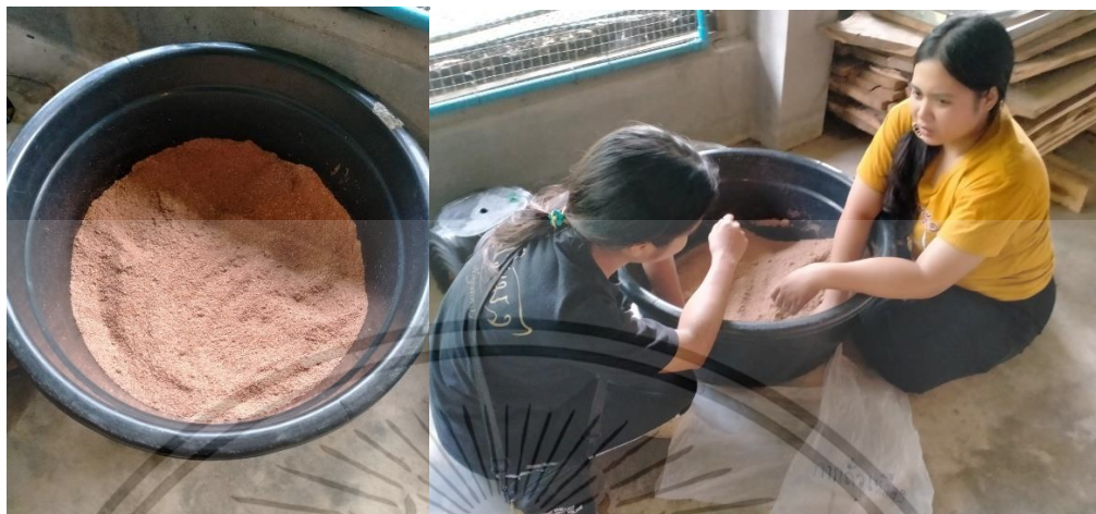
ภาคผนวกที่ 3 การผสมอาหาร