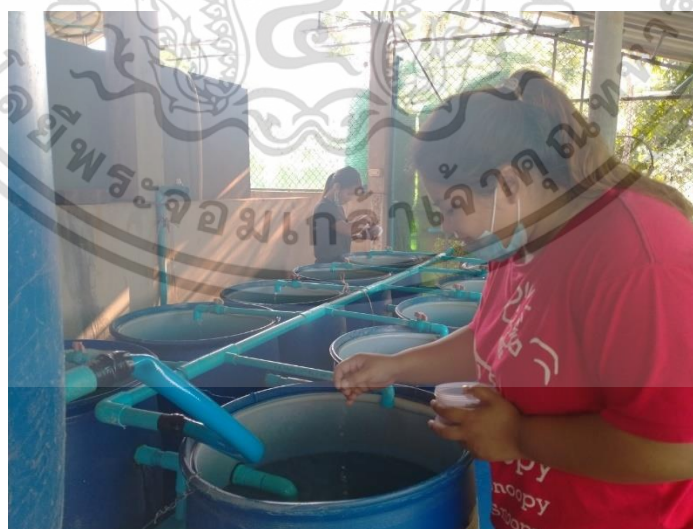
ภาคผนวกที่ 7 การให้อาหารปลานิล

เอกสารนี้เป็นเอกสารที่สงวนไว้สำหรับการใช้งานเพื่อการศึกษาเท่านั้น ไม่อนุญาตให้นำไปใช้ประโยชน์ด้านการค้า ไม่ว่าจะกรณีใดๆ ทั้งสิ้น อีกทั้งห้ามมิให้ตัดแปลงเนื้อหาและต้องอ้างอิงถึงเจ้าของเอกสารทุกครั้งที่มีการนำไปใช้