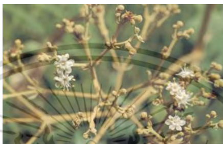
ภาพที่ 3 แสดงดอกต้นสัก

เป็นสีเขียวนวล มีกลีบดอก 6 กลีบ โคนกลีบดอกเชื่อมติดกันเป็นหลอดและมีขนทั้งด้านนอกและด้านใน ดอกมีเกสรเพศผู้ 5-6 อัน ยื่นยาวพ้นออกจากดอก ส่วนเกสรเพศเมียจะยาวเท่ากับเกสรเพศผู้และมี 1 อัน ที่รังไข่มีขนอยู่หนาแน่น ต้นสักจะออกดอกช่อดอกช่อแรกที่ปลายยอดสุดของแกนลำต้นก่อนกิ่งอื่น ๆ แล้วจึงจะเกิดดอกที่ปลายยอดของกิ่ง และดอกจะบานเพียง 1 วัน หลังจากนั้นดอกที่ได้รับการผสมจะเปลี่ยนแปลงไปเป็นผลต่อไปในช่วงเดือนกรกฎาคมถึงเดือนตุลาคม (พีชอนุรักษ์ อพ.สธ, 2557)