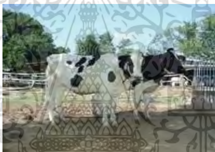
ภาพที่ 20 แสดงโคนมพันธุ์ ที เอ็ม แซด

โคพันธุ์นี้ให้ผลผลิตน้ำนมปานกลาง ความสมบูรณ์พันธุ์สูงทนทานต่อโรคและแมลงเหมาะกับสภาพแวดล้อมของประเทศลักษณะสีขาวตัดกับดำโดยเด็ดขาด บางตัวอาจจะมีสีขาวสีดำมาก ขนาดแม่โคนมโตเต็มที่ขณะให้นมควรมีน้ำหนักประมาณ 450 กิโลกรัม ส่วนหัวกลมกลืน เนื้อนุ่มใหญ่ รูจมูกเปิดกว้าง กรามแข็งแรง ตาใส ตาโต หน้าผากกว้าง เป็นจานเล็กน้อย ตั้งจมูกตรง ใบหูขนาดปานกลาง ดูกระตือรือร้น ผลผลิตน้ำนมเฉลี่ย 3,500 กก. (สำนักพัฒนาพันธุ์สัตว์, 2558)