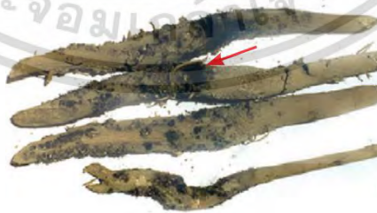
ภาพที่ 9 แสดงโรคเน่าของเหง้าสัก