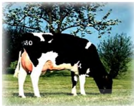
ภาพที่ 18 แสดงโคนมพันธุ์โฮลสไตน์ฟรีเซียน