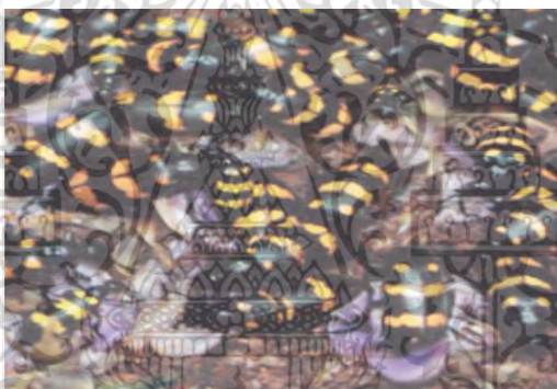
ภาพที่ 14 แสดงตัวน้ำมัน

ตัวน้ำมัน ชื่อวิทยาศาสตร์คือ Mylabris phalerata Pall อยู่ในวงศ์ Meloidae เป็นด้วงขนาดกลาง ยาวประมาณ 2.5 เซนติเมตร ตัวสีดำ ขาสีดำปีกมีแถบสีเหลืองส้มพาดขวาง 3 แถบ ปีกนิ่มไม่แข็งเหมือนด้วงปีกแข็งทั่วไป หนวดสั้น ส่วนหัวและอกเล็กกว่าลำตัว ตัวด้วงกินดอกและผลอ่อนของสัก ทำให้ดอกสักและผลอ่อนของสักได้รับความเสียหายอย่างมากดอกและผลอ่อนไม่สามารถพัฒนาเป็นผลแก่ได้ ก่อให้เกิดปัญหาการผลิตเมล็ดพันธุ์สักในสวนผลิตเมล็ดพันธุ์ พบการระบาดในช่วงที่สักออกดอกและมีผลอ่อน ตัวน้ำมันมีพืชอาหารหลายชนิด เช่น ดอกของพืชตระกูลถั่ว ตระกูลแตง ขบา และดอกไม้้อีกหลายชนิด