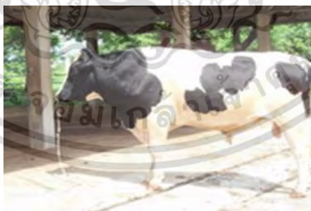
ภาพที่ 19 แสดงโคนมพันธุ์ไทยฟรีเซียน

และที่สำคัญสามารถปรับตัวเข้ากับสภาพแวดล้อมของประเทศได้ลักษณะสีขาวตัดกับดำโดยเด็ดขาด บางตัวอาจจะมีสีขาว สีดำนาก ขนาดแม่โคขนาดโตเต็มที่ขณะให้นมควรมีน้ำหนักประมาณ 500 กิโลกรัม ส่วนหัวกลมกลืน เนื้อนุ่มใหญ่ รูจมูกเปิดกว้าง กรามแข็งแรง ตาใส ตาโต หน้าผากกว้าง เป็นจานเล็กน้อย ตั้งจมูกตรง ใบหูขนาดปานกลาง ดูกระตือรือร้น ผลผลิตน้ำนมเฉลี่ย 3,600 กก.