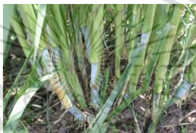
ภาพที่ 16 แสดงราก และลำต้น

หญ้าเนเปียร์ เป็นหญ้าที่มีลำต้นขนาดใหญ่ ลำต้นแตกเป็นกอหรือแตกต้นใหม่ได้ ลำต้นมีลักษณะแข็งแรง มีลำต้นสั้นๆบางส่วนอยู่ใต้ดิน ลำต้นเหนือดินมีลักษณะทรงกลม และตั้งตรง ขนาดลำต้น 2-2.5 เซนติเมตร สูง 2-6 เมตร ลำต้นมีลักษณะเป็นข้อปล้อง ประมาณ 15-20 ข้อ ส่วนรากมีเฉพาะระบบรากฝอยที่แตกออกจากเหง้าจำนวนมาก