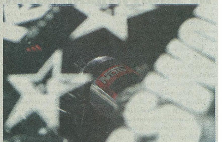
ถึงในตรีส ใน RX-7 คันแรก ที่ส่งตรงจากญี่ปุ่นเพื่อขานนี้