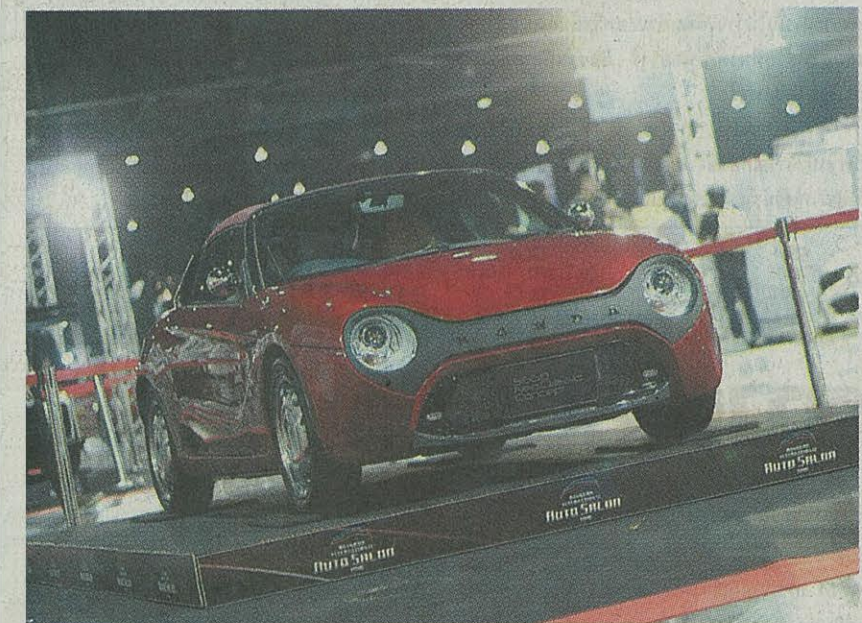
ฮอนด้า S660 NEO Classic Concept คันเล็ก น่ารัก แต่งตามเทลิอชนาต