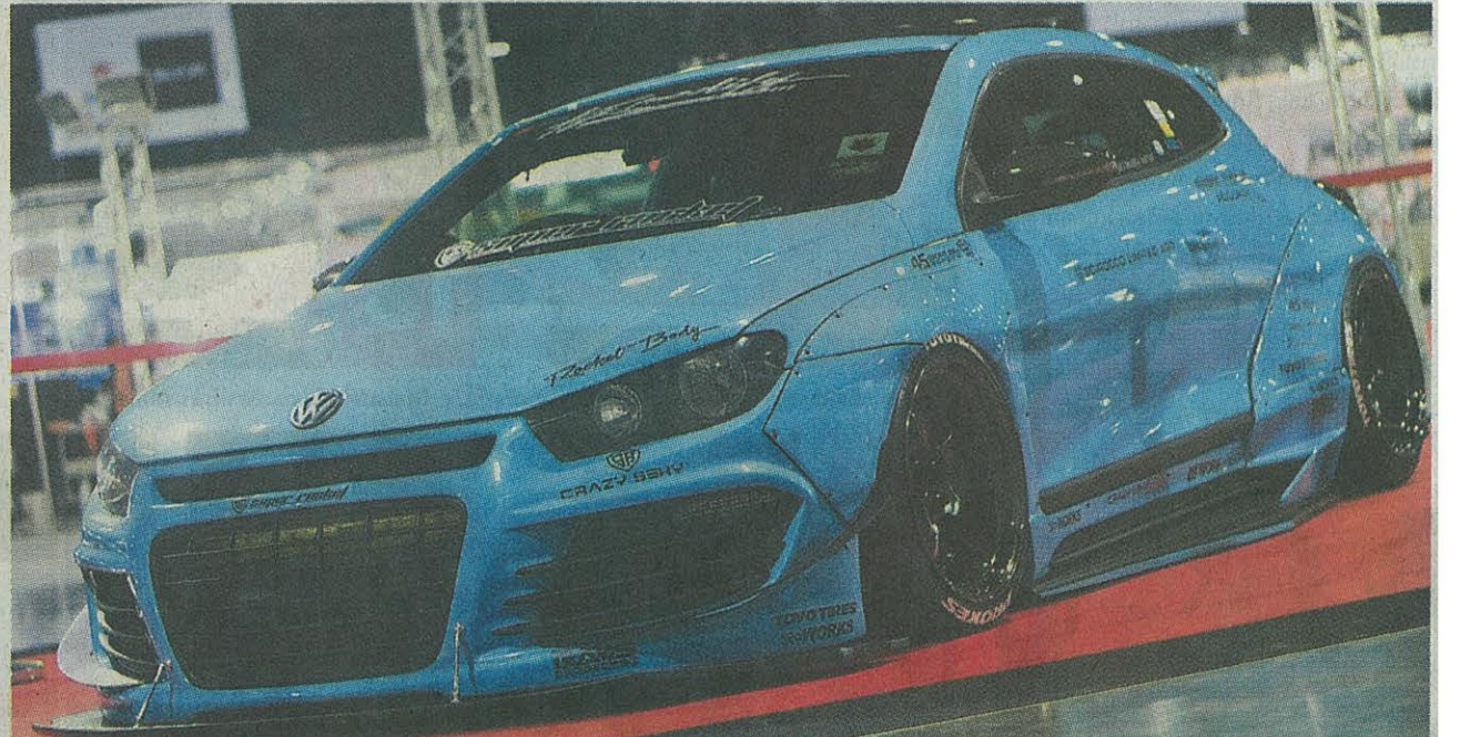
โพลิศวาทาน สวยดูโดนใจแฟนคนรักความเร็วแน่นอน