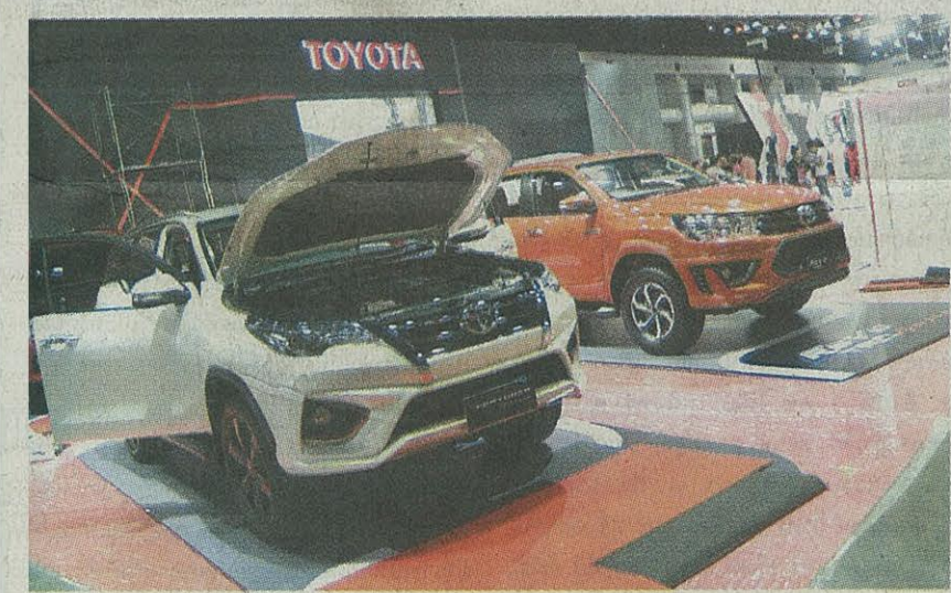
โดยตำนำรถยนต์นำของค่ายพร้อมให้คนจ้กรอดได้ชมและจับจอยกันอย่างแน่นอน