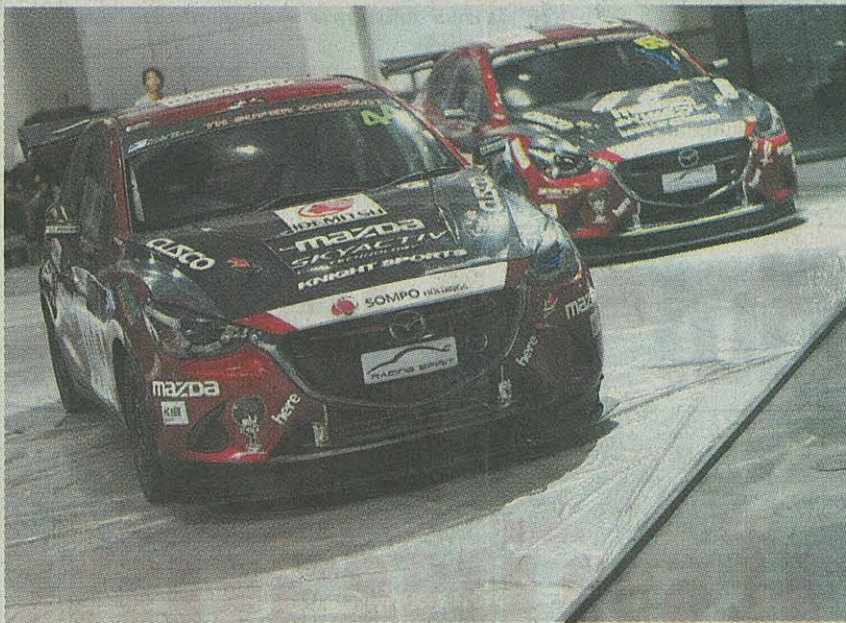
บูตมาสด้าเตรียมรถสวยๆ ให้จอยชม