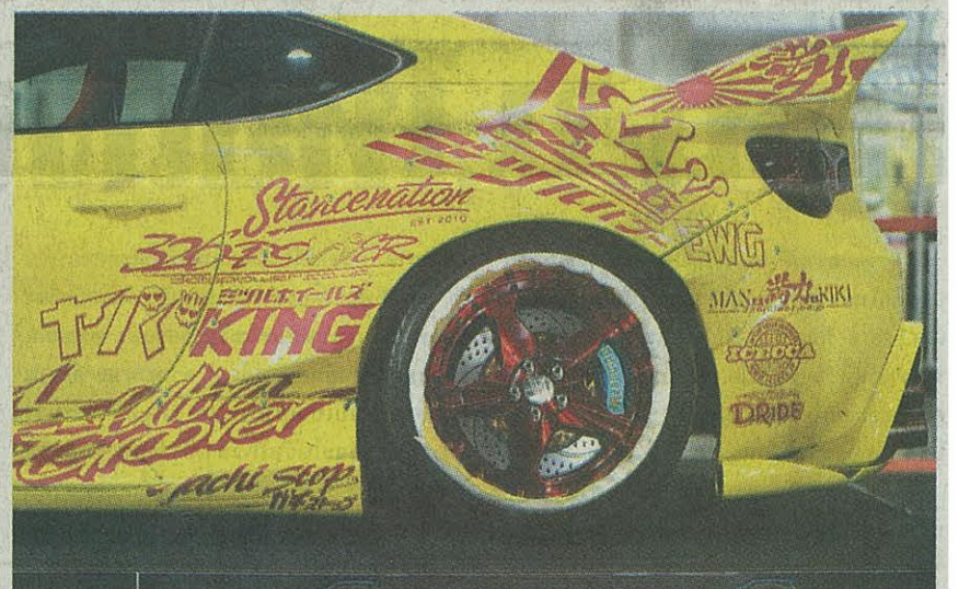
แต่ด้านซ้ายก็กินขาดสำหรับ TOYOTA 86 คันนี้