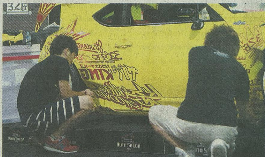
ทีมงานช่างจากญี่ปุ่นเซตรถให้พร้อม ก่อนงาน Bangkok International Auto Salon 2016

เช่นเดียวกับอุปกรณ์ตกแต่ง อุปกรณ์ โมดิฟายรถยนต์ชั้นนำของญี่ปุ่นที่ชนผลิตกันขยับทะเลมาจัดจำหน่ายในราคาพิเศษแบบ “มิดเชียร์เซล” โดยมีสินค้าแต่งรถจากผู้ผลิตในไทยต่างพร้อมใจระหนาราคาเพื่อมอบเป็นโอกาสพิเศษแก่คนรักรถยนต์เช่นเดียวกัน