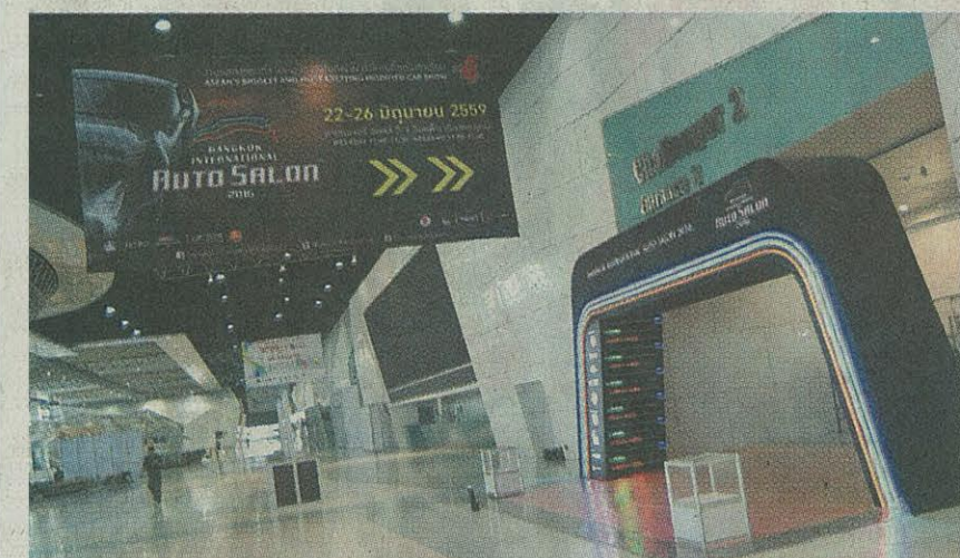
Bangkok International Auto Salon 2016 เปิดฉากให้แฟนฯ คนจ้กรดแต่งได้เข้ามาเลือกชมและซื้อสินค้าแล้ว ระหว่าง 22-26 มิ.ย.นี้