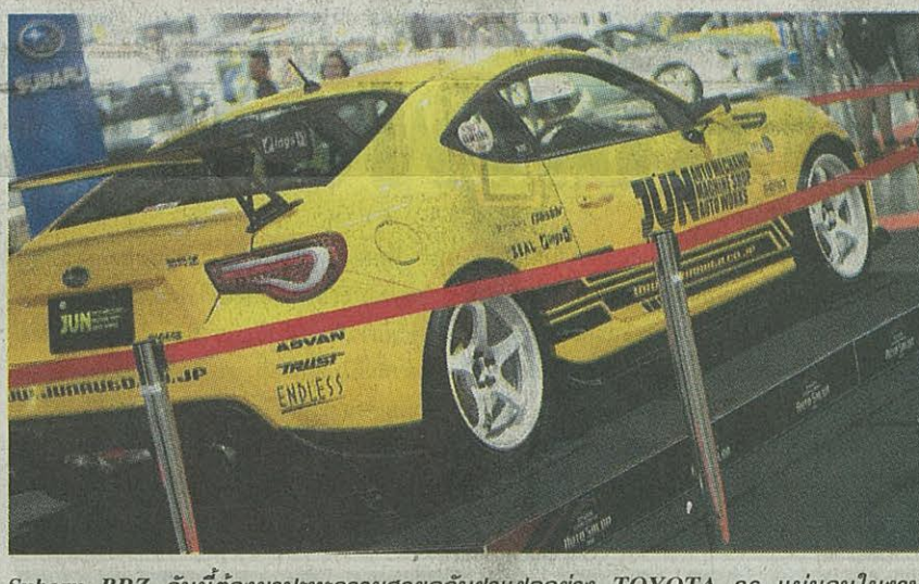
Subaru BRZ คันนี้ต้องมาปะความสวยดูกับฝาแฝดอย่าง TOYOTA 86 แน่นนอนในงานบางกอก อินเตอร์เนชั่นแนล ออโต ซาลอน 2016 ที่อาคารชาเลนเจอร์ อิมแพ็ค เมืองทองธานี