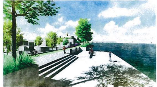
PERSPECTIVE : Sanaa

โมเดลพัฒนาที่กำลังจะเสร็จสิ้นภายในเดือน ก.ย.นี้!