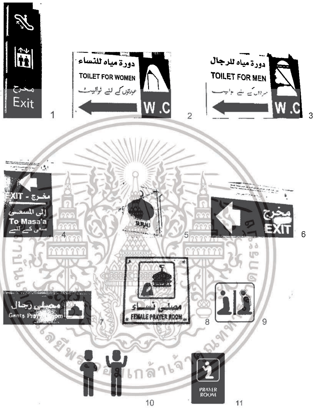
ภาพที่ 4.2 แสดงรายละเอียดของรูปภาพ บ้าย สัญลักษณ์ ที่มีในแบบสอบถาม

ในรายละเอียดของรูปภาพ บ้าย สัญลักษณ์ ที่มีในแบบสอบถาม ดังนี้