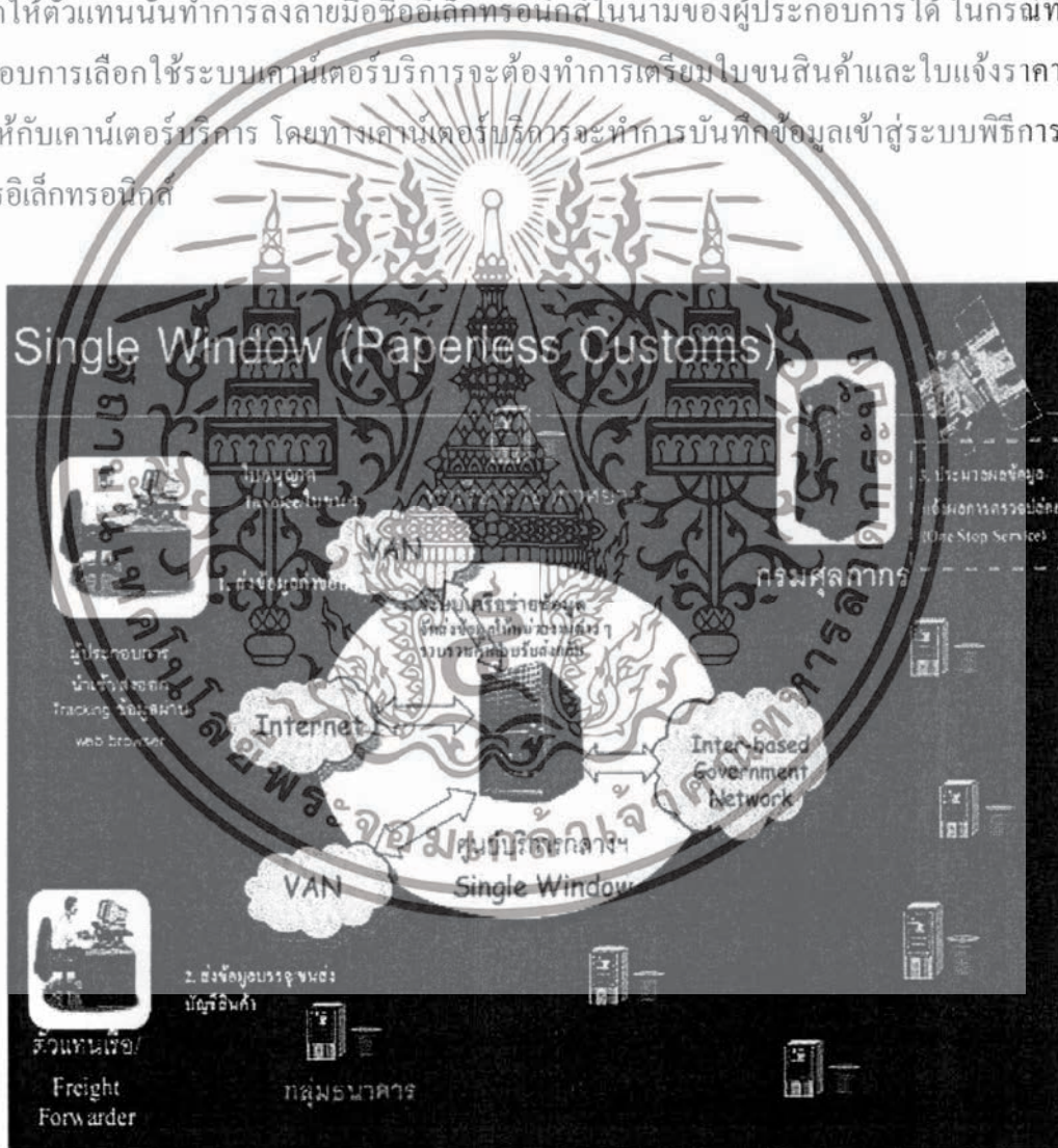
ภาพที่ 2.2 การเชื่อมโยงของระบบพิธีการศุลกากรอิเล็กทรอนิกส์ (Paperless Customs) ที่มา : กรมศุลกากร (2548)

2.4.3.2 การรับ-ส่งข้อมูลโดยทางอ้อม ผู้ประกอบการไม่ต้องทำการรับ-ส่งข้อมูลกับทางกรมศุลกากรโดยตรงซึ่งผู้ประกอบการสามารถใช้บริการผ่านตัวแทนหรือเคาน์เตอร์บริการในกรณีที่ผู้ประกอบการตัดสินใจใช้บริการพิธีการศุลกากรอิเล็กทรอนิกส์ผ่านตัวแทนนั้น ผู้ประกอบการสามารถให้ตัวแทนนั้นทำการลงลายมือชื่ออิเล็กทรอนิกส์ในนามของผู้ประกอบการได้ ในกรณีที่ผู้ประกอบการเลือกใช้ระบบเคาน์เตอร์บริการจะต้องทำการเตรียมใบขนสินค้าและใบแจ้งราคาสินค้าให้กับเคาน์เตอร์บริการ โดยทางเคาน์เตอร์บริการจะทำการบันทึกข้อมูลเข้าสู่ระบบพิธีการศุลกากรอิเล็กทรอนิกส์