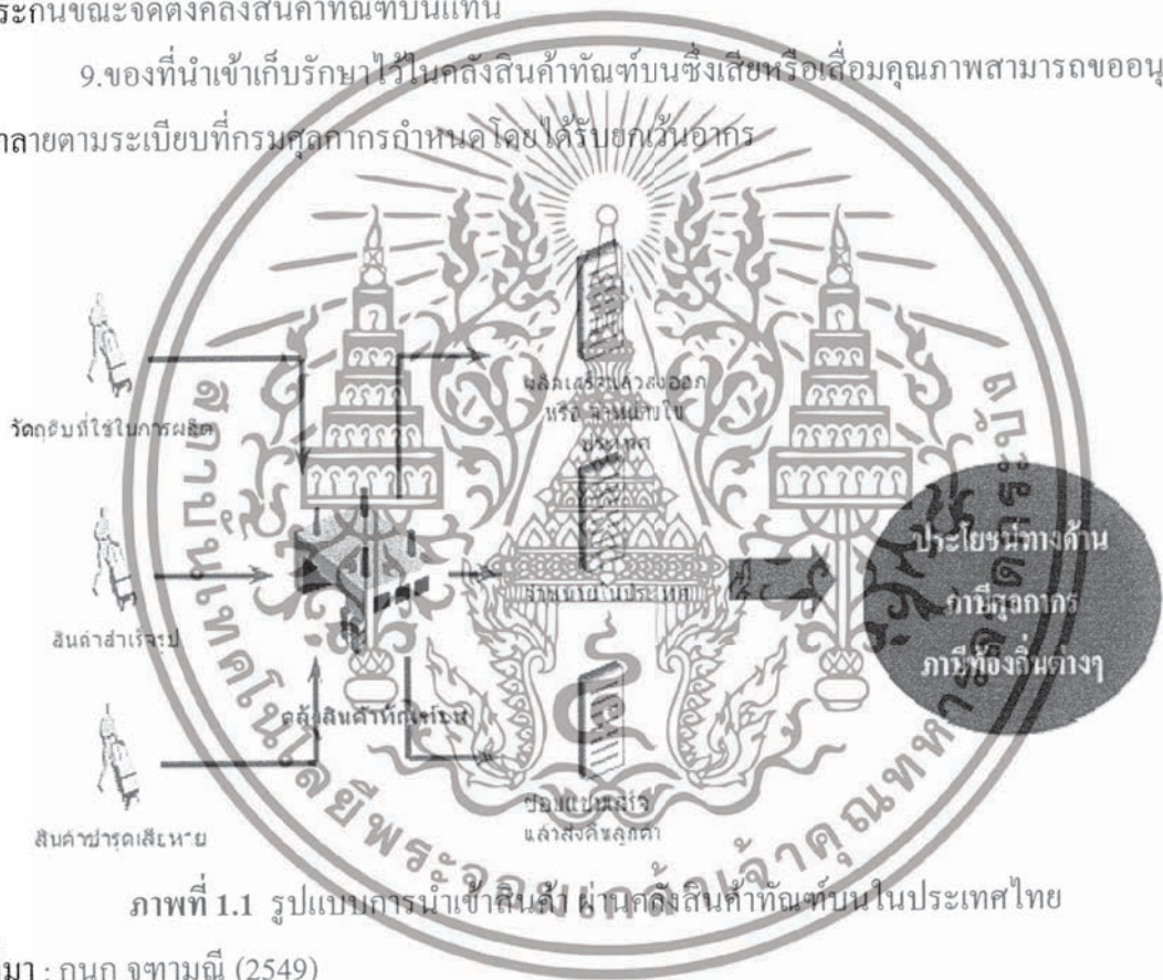
ภาพที่ 1.1 รูปแบบการนำเข้าสินค้า ผ่านคลังสินค้าทัณฑ์บนในประเทศไทย

9. ของที่นำเข้าเก็บรักษาไว้ในคลังสินค้าทัณฑ์บนซึ่งเสียหรือเสื่อมคุณภาพสามารถขออนุมัติทำลายตามระเบียบที่กรมศุลกากรกำหนดโดยได้รับยกเว้นอากร