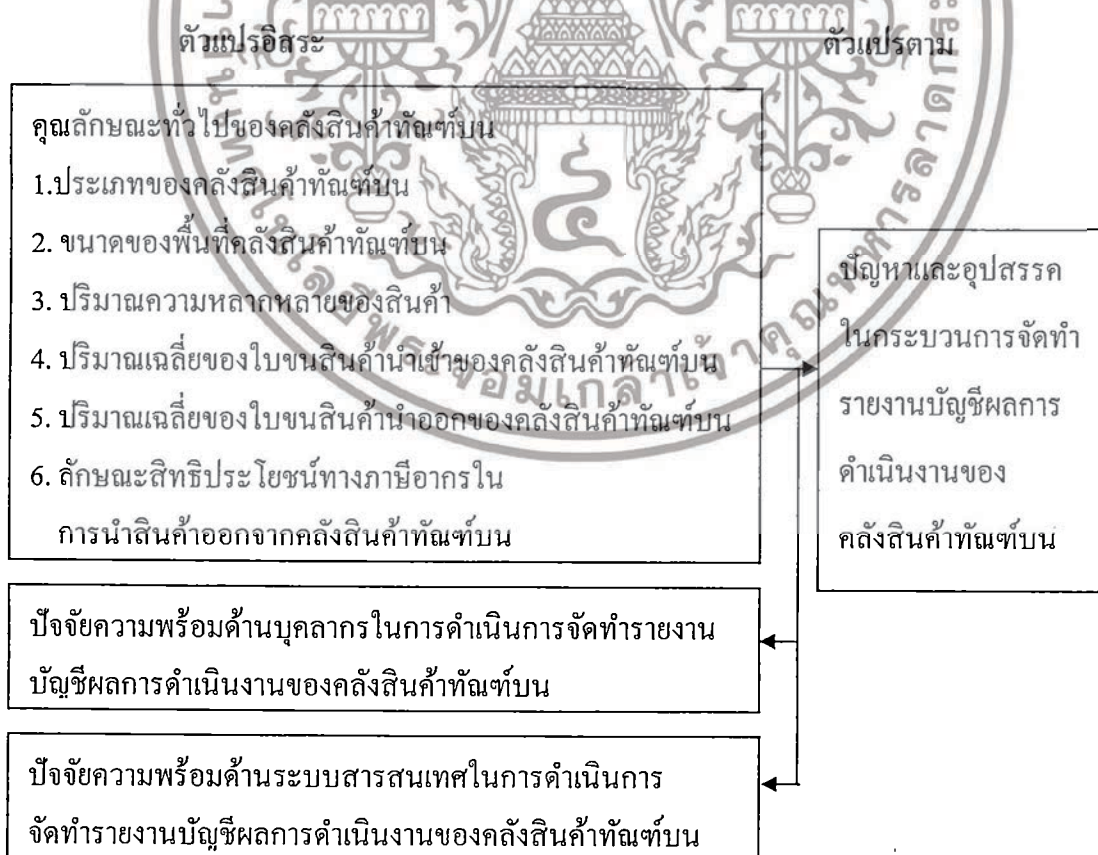
ภาพที่ 1.3 กรอบแนวคิดที่ใช้ในการวิจัย

ในการศึกษาครั้งนี้ผู้วิจัยต้องการศึกษาระดับปัญหาและอุปสรรคของกระบวนการจัดทำรายงานผลการดำเนินงานของคลังสินค้าทัณฑ์บนและศึกษาเปรียบเทียบระดับปัญหาและอุปสรรคของกระบวนการจัดทำรายงานผลการดำเนินงานของคลังสินค้าทัณฑ์บนจำแนกตามคุณลักษณะทั่วไปของคลังสินค้าทัณฑ์บน รวมทั้งศึกษาความสัมพันธ์ของปัจจัยความพร้อมด้านบุคลากรและด้านระบบสารสนเทศในการจัดทำรายงานผลการดำเนินงานของคลังสินค้าทัณฑ์บนกับปัญหาและอุปสรรคของกระบวนการจัดทำรายงานผลการดำเนินงานของคลังสินค้าทัณฑ์บน ทั้งนี้ผู้วิจัยจึงได้กำหนดกรอบแนวคิดที่ใช้ในการวิจัยไว้ดังแสดงในภาพที่ 1.3