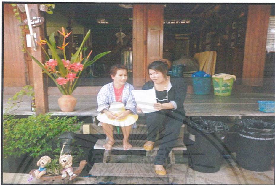
ภาพผนวกที่3 แสดงการสัมภาษณ์ชาวบ้านชุมชนโรงเจ