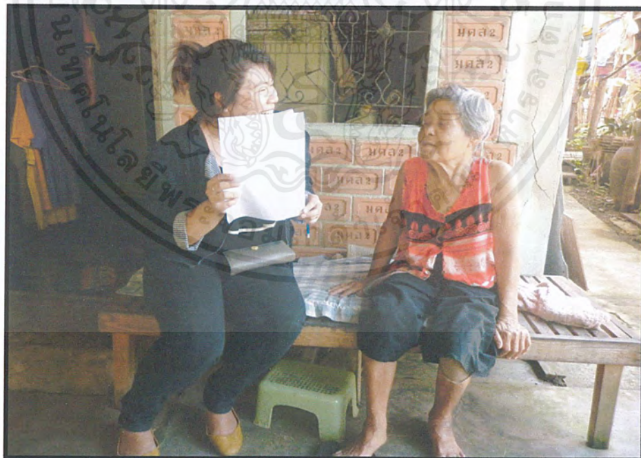
ภาพผนวกที่4 แสดงการสัมภาษณ์ชาวบ้านชุมชนวัดอัมพวัน

เอกสารนี้เป็นเอกสารที่สงวนไว้สำหรับการใช้งานเพื่อการศึกษาเท่านั้น ไม่อนุญาตให้นำไปใช้ประโยชน์ด้านการค้า ไม่ว่าจะกรณีใดๆ ทั้งสิ้น อีกทั้งห้ามมิให้ดัดแปลงเนื้อหาและต้องอ้างอิงถึงเจ้าของเอกสารทุกครั้งที่มีการนำไปใช้