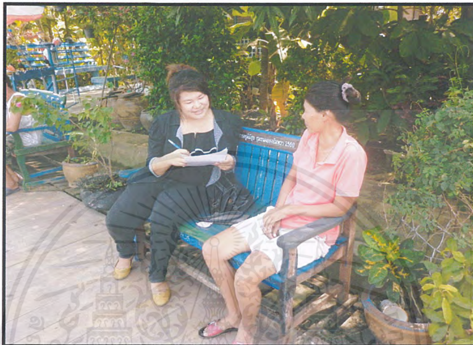
ภาพผนวกที่1 แสดงการสัมภาษณ์ชาวบ้านชุมชนคลองอัมพวา