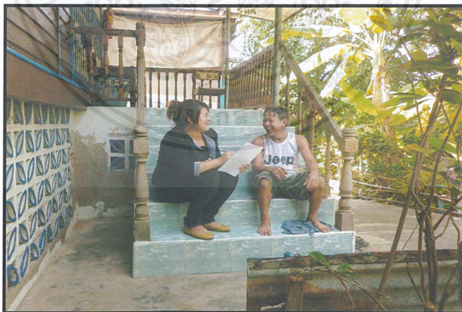
ภาพผนวกที่2 แสดงการสัมภาษณ์ชาวบ้านชุมชนตลาดอัมพวา

เอกสารนี้เป็นเอกสารที่สงวนไว้สำหรับการใช้งานเพื่อการศึกษาเท่านั้น ไม่อนุญาตให้นำไปใช้ประโยชน์ด้านการค้า ไม่ว่าจะกรณีใดๆ ทั้งสิ้น อีกทั้งห้ามมิให้ดัดแปลงเนื้อหาและต้องอ้างอิงถึงเจ้าของเอกสารทุกครั้งที่มีการนำไปใช้