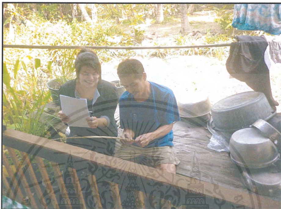
ภาพผนวกที่5 แสดงการสัมภาษณ์ชาวบ้านชุมชนประชาอุทิศ

เอกสารนี้เป็นเอกสารที่สงวนไว้สำหรับการใช้งานเพื่อการศึกษาเท่านั้น ไม่อนุญาตให้นำไปใช้ประโยชน์ด้านการค้า ไม่ว่ากรณีใดๆ ทั้งสิ้น อีกทั้งห้ามมิให้ดัดแปลงเนื้อหาและต้องอ้างอิงถึงเจ้าของเอกสารทุกครั้งที่มีการนำไปใช้