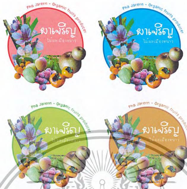
ภาพที่ 14 ตัวอย่างโลโก้ผลิตภัณฑ์ชุมชน