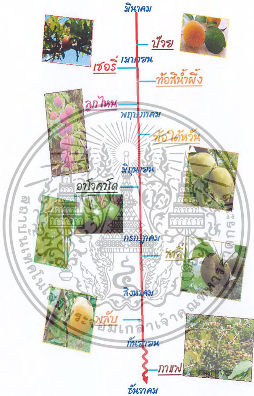
ภาพที่ 13 ปฏิทินผลผลิต