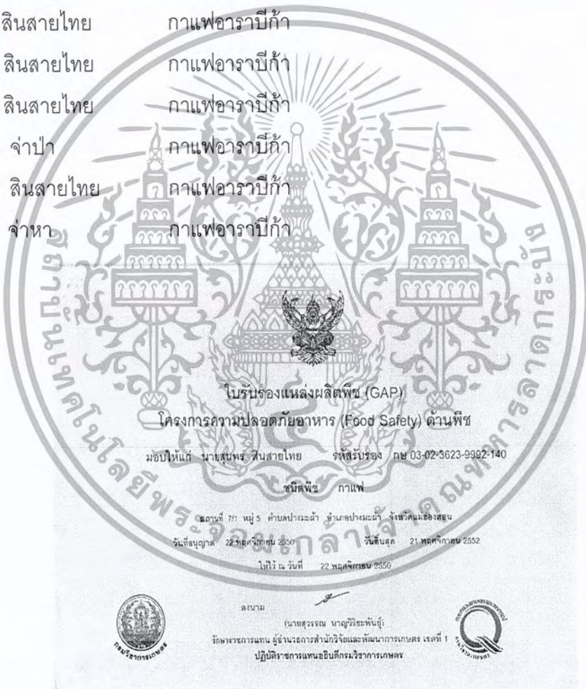
ภาพที่ 18 ตัวอย่างใบรับรองแหล่งผลิตพืช ( GAP ) ชนิดพืชกาแฟ