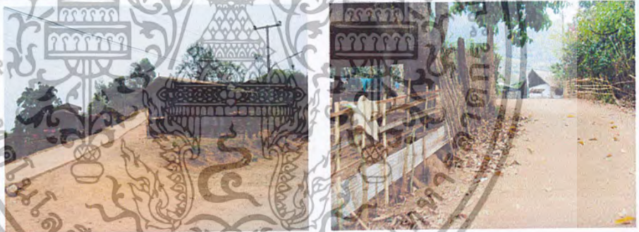
ภาพที่ 3,4 สภาพถนนในหมู่บ้าน

ชุมชนบ้านผาเจริญตั้งอยู่กึ่งกลางระหว่างหมู่ที่ 1 บ้านแม่ละนา กับ หมู่ที่ 5 บ้านยาป่าแหน ต.ปางมะผ้า อ.ปางมะผ้า จ.แม่ฮ่องสอน ระยะทางห่างจากทั้ง 2 หมู่บ้านเพียง 2 กิโลเมตร ถนนสร้างด้วยคอนกรีตเสริมเหล็กตลอดทาง การเดินทางสะดวกชาวบ้านนิยมการเดินทางเดินทางด้วยรถจักรยานยนต์เมื่อเข้าสู่หมู่บ้านใกล้เคียง และตัวอำเภอปางมะผ้า แต่ชาวบ้านบางกลุ่มที่ไม่มีรถจักรยานยนต์ก็เดินทางด้วยเท้า ส่วนใหญ่ชาวบ้านจะเดินทางไปสถานีอนามัยที่บ้านแม่ละนา และไปติดต่อธุระที่บ้านยาป่าแหนระยะทางประมาณ 2 - 3 กิโลเมตร (ภาพที่ 3-4)