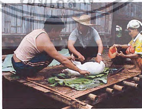
ภาพที่ 7 การทำหมูลแล้วแบ่งกันหลายบ้านเพื่อทำอาหาร

วิถีชีวิตของชาวบ้านจะเป็นในแนวดั้งเดิม คือ การคบหาสมาคมแบบปฐมภูมิ ช่วยเหลือซึ่งกันและกัน มีการร่วมมือกันทำงานของส่วนรวม มีความสัมพันธ์อย่างแน่นแฟ้นในระบบเครือญาติ กล่าวคือ มีการแบ่งปัน ช่วยเหลือดูแลกันฉันท์อยู่ในครอบครัวเดียวกัน มีการตั้งกลุ่มออมทรัพย์เพื่อการผลิตไม้ผลเมืองหนาวของชุมชน กลุ่มออมทรัพย์รวม และกลุ่มสตรีของชุมชน ระบบการจัดการกลุ่มมีการตั้งคณะกรรมการฝ่ายต่าง ๆ เพื่อแบ่งหน้าที่กันทำอย่างมีระบบและด้วยความโปร่งใส สมาชิกในชุมชนให้ความร่วมมือกันอย่างดี (ภาพที่ 7)