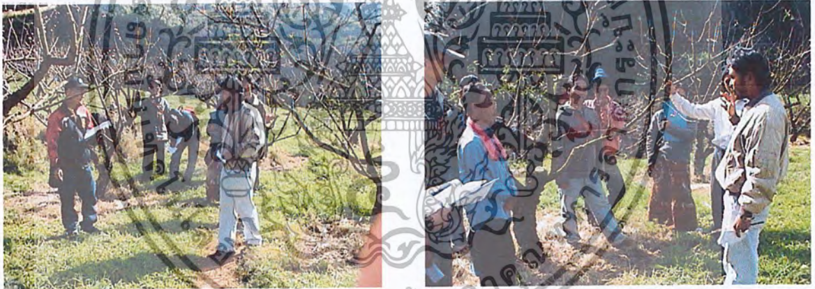
ภาพที่ 9,10 ชาวบ้านไปศึกษาดูงานที่สถานีเกษตรหลวงดอยอ่างขาง

นายนายแสนสะอาด ดินสายไทย, สัมภาษณ์ (30 มีนาคม 2553)