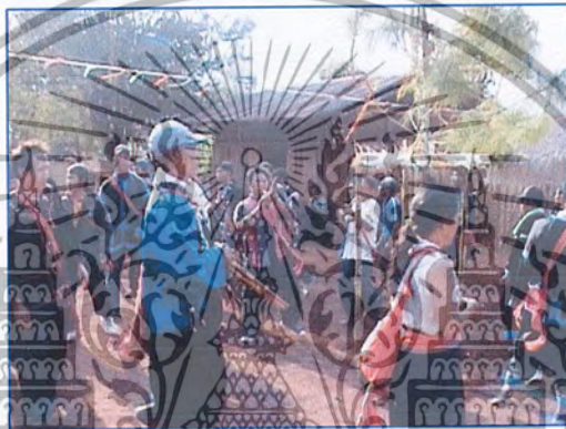
ภาพที่ 5 ประเพณีปีใหม่

ประเพณีปีใหม่ (ภาษาลahuเรียกว่า เขะซี คำว่า เขะแปลว่าปี ซี้แปลว่าใหม่) เป็นประเพณีที่สืบทอดกันมาตั้งแต่อดีตกาลและมีการสืบทอดอย่างเข้มแข็งของชุมชน จะจัดกิจกรรมช่วงเดือนกุมภาพันธ์ของทุกปี เป็นเวลา 7 วัน 7 คืน มีการเต้นจะคี รอบ ๆ ต้นสนหรือต้นไม้ใหญ่ที่ตัดมาจากป่า แล้วมาปลูกไว้ที่ลานเอนกประสงค์ของหมู่บ้าน วัดอุประสงค์ของประเพณีดังกล่าวคือ เพื่อให้ชาวบ้านได้พักผ่อนจากการทำไร่ทำสวน และใช้เวลานี้รดน้ำดำหัวผู้เฒ่าผู้แก่หรือพ่อแม่ เพื่อใช้เวลาในการสร้างความสามัคคีทางศาสนา ขอบพระคุณพระเจ้า(ภาพที่5)