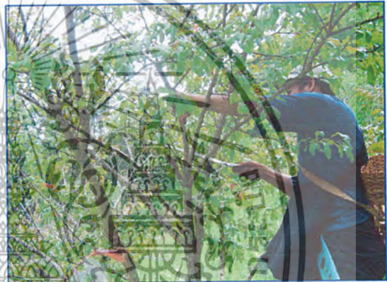
ภาพที่ 12 การตัดแต่งกิ่งต้นพลัม

“เมื่อก่อนคิดจะปลูกก็ปลูกเลย ขุดปลูกๆ โดยไม่มีการวางแผน ทำให้ปลูกได้น้อย การจัดการลำบาก แต่ตอนนี้ไม่ใช่แล้ว ทางชุมชนมีการจัดตั้งกลุ่มขึ้นมา เพื่อรับผิดชอบด้านการจัดการพื้นที่ปลูกโดยตรง ผมก็ทำอยู่ในจุดนี้กลุ่มเรามีคนรับผิดชอบอยู่ 4 คน พื้นที่หลังจากปลูกไม้ผลแล้วยังมีพื้นที่เหลืออยู่ก็จะปลูกผักสวนครัวบ้าง สมุนไพรบ้าง ไม้ผลบางอย่างที่โตช้าก็จะปลูกพืชอื่นแซมก่อน เช่นปลูก อโวคาโด ซึ่งใช้เวลา 3 ปีกว่าจะได้เก็บ แต่เราก็ปลูกกล้วย ปลูกผักสวนครัวแซม เป็นต้น ทำให้มีรายได้ตลอด และเรายังรับผิดชอบในการให้ความรู้เรื่องการให้น้ำ การใช้ปุ๋ย การตัดแต่งกิ่ง เรื่องโรคต่างๆ อีกด้วย ส่วนเรื่องผลตอบแทนของกลุ่มนั้นในแต่ละเดือนจะมีเงินสนับสนุนจากชุมชนให้มาเดือนละ พันบ้าง สองพันบ้าง ตามที่ชุมชนจะให้ แต่ที่เราได้คือ ถ้าบ้านเราจะปลูกอะไร หรือมีงานอะไร ชาวบ้านก็จะมาช่วยเราโดยไม่คิดผลตอบแทน ผมคิดว่าดินะ ที่ทุกคนยังช่วยเหลือซึ่งกันและกันอยู่ และทางกลุ่มของเราก็จะไปดูงาน หาความรู้จากแหล่งต่างๆ เพื่อที่จะทำให้ดีกว่าเดิมด้วย”