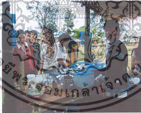
ภาพที่ 16 ร้านกาแฟสดที่บ้านสันติชน

ตลาดกลุ่มที่ 4 การทำร้านกาแฟสด ในช่วงหน้าท่องเที่ยวที่บ้านสันติชล อ.ปาย ถือเป็นตลาดที่ประชาสัมพันธ์ชุมชนเกษตรอินทรีย์ และขั้นตอน วิธีการผลิตไม้ผลเมืองหนาว เช่น รูปแบบวิธีการเก็บเกี่ยวผลผลิตกา กาสีเปลือก การตากแห้ง การตำเมล็ดคั่ว การคั่วที่ใช้วัสดุที่มีอยู่ในท้องถิ่นคือไม้ไผ่แห้งที่อาจเป็นเชื้อเพลิงในการเกิดไฟป่ามาใช้เป็นเชื้อเพลิงในการคั่วกา รวมไปถึงการบดเมล็ดและการชงกาแฟสด จากกิจกรรม ทำกาแฟสดนี้ ได้มีนักท่องเที่ยวผู้บริโภคสั่งซื้อทางไปรษณีย์อีกด้วย จึงเป็นการตลาดอีกรูปแบบหนึ่งที่ชุมชนบ้านผาเจริญมีกำลังทำได้ (ภาพที่ 16)