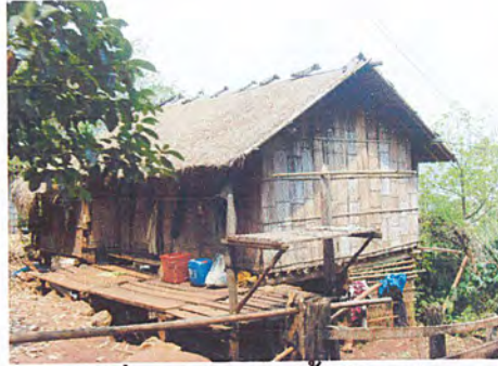
ภาพที่2 สภาพการตั้งบ้านเรือน

เส้นทางคมนาคม และการติดต่อสื่อสารกับภายนอก