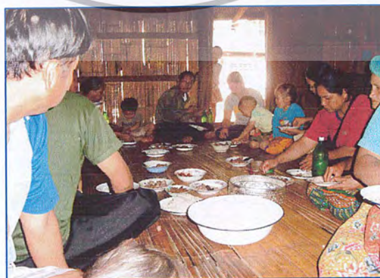
ภาพที่ 6 ประเพณีกินข้าวใหม่

ประเพณีกินข้าวใหม่ (ภาษาลahuเรียกว่า จ่าซื่อจ้อจ้อ คำว่าจ่าซื่อ แปลว่าข้าวใหม่ คำว่าจ้อจ้อ แปลว่ากิน) สำคัญสำคัญของประเพณีนี้คือการนำผลผลิตทางการเกษตรมารวมกันไว้ที่โบสถ์ แล้วอธิษฐานเพื่อขอขอบคุณพระเจ้า ที่พระองค์ทรงกระทำให้ผลผลิตเจริญเติบโต และเพื่อส่งเสริมให้ชาวบ้านได้มีใจรักที่จะทำตามคำสอนของพระเยซู และมีใจรักเพื่อนบ้านด้วย โดยการแบ่งปันของที่ถวายแล้วให้แก่คนยากคนจน หรือแขกที่มาช่วยงาน จะจัดกิจกรรมช่วงเดือนตุลาคมของทุกปี (ภาพที่ 6)