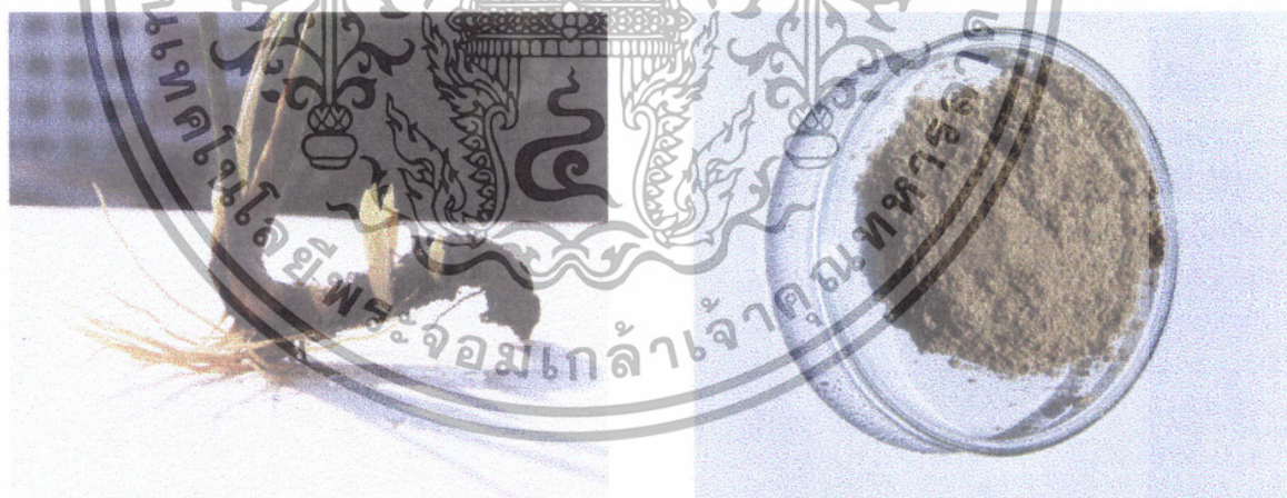
ภาพที่ 2 ว่านน้ำ (sweet flag)