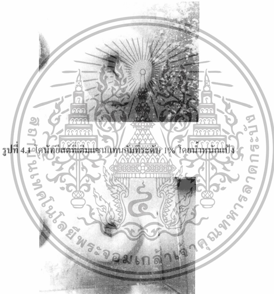
รูปที่ 4.1 โดนต์ยีสต์ที่เติมแซนแทนกัมที่ระดับ 1% โดยน้ำหนักแป้ง

สำหรับผลของการเติมแซนแทนกัมในส่วนผสมของโดนต์ยีสต์ที่ระดับ 1 และ 2% โดยน้ำหนักแป้ง ต่อคุณภาพของโดนต์ที่ได้นั้น พบว่า การเติมแซนแทนกัม 2% โดยน้ำหนักแป้งจะช่วยลดการแตกของผิวโดนต์หลังจากการขึ้นรูปและตั้งทิ้งไว้ให้ขึ้นฟูได้ดีกว่าการเติมแซนแทนกัม 1% โดยน้ำหนักแป้ง นอกจากนี้โดนต์ที่ได้หลังทอดก็มีลักษณะการดูดซับน้ำมันน้อยกว่าด้วย อย่างไรก็ตาม รอยแตกของผิวโดนต์ก็ยังคงเกิดขึ้นอยู่ ทำให้ผิวโดนต์หลังทอดมีความเรียบเนียนน้อย การเติมแซนแทนกัมจึงช่วยแก้ปัญหาได้เพียงบางส่วนเท่านั้น