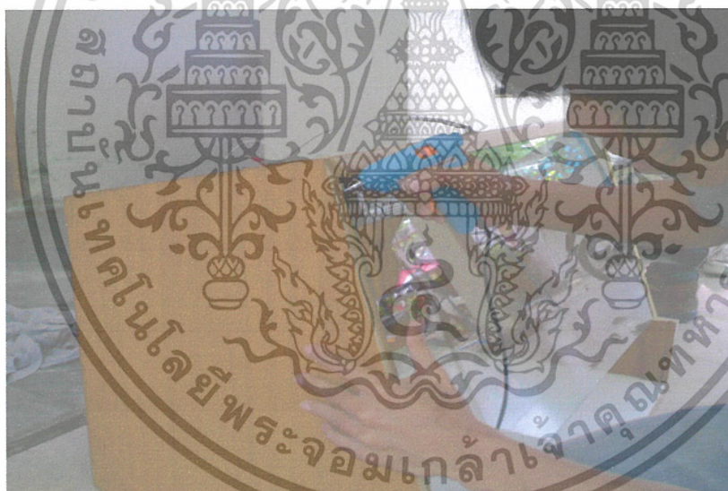
ภาพที่ 2 การติดกระจกเข้ากับตู้ปลอดเชื้อ

เอกสารนี้เป็นเอกสารที่สงวนไว้สำหรับการใช้งานเพื่อการศึกษาเท่านั้น ไม่อนุญาตให้นำไปใช้ประโยชน์ด้านการค้า ไม่ว่ากรณีใดๆ ทั้งสิ้น อีกทั้งห้ามมิให้ดัดแปลงเนื้อหาและต้องอ้างอิงถึงเจ้าของเอกสารทุกครั้งที่มีการนำไปใช้