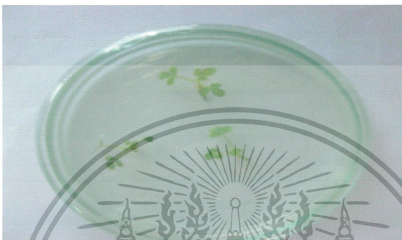
ภาพที่ 12 ลักษณะของต้นกุหลาบที่ดี

ลักษณะการตายของต้นกุหลาบจากการย้ายลงในจานเพาะเลี้ยง ต้นกุหลาบจะเป็นสีเขียวโดยเริ่มจาก โคนแล้วจะเหลืองขึ้นตามยอด จากนั้นต้นจะเริ่มเน่าและมีสีดำ ดังในรูปภาพเปรียบเทียบลักษณะของต้นที่ดี และต้นที่ตาย