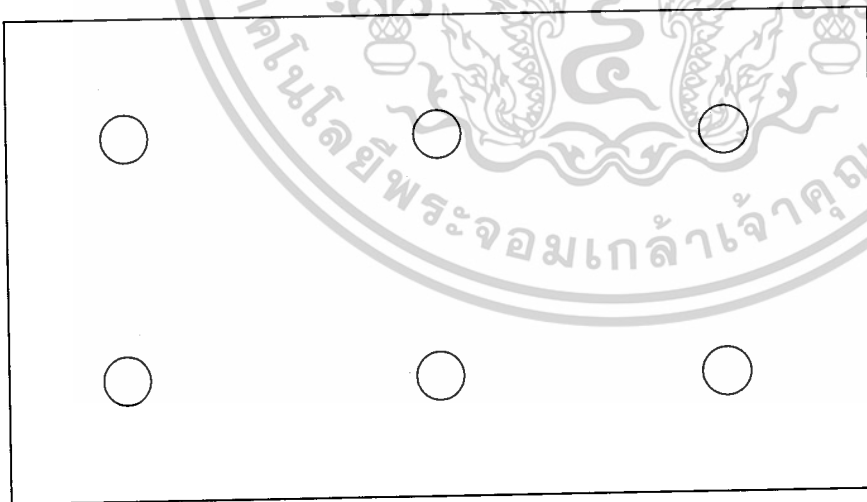
ภาพที่ 9 แสดงตำแหน่งการวางงานเพาะเลี้ยง

เอกสารนี้เป็นเอกสารที่สงวนไว้สำหรับการใช้งานเพื่อการศึกษาเท่านั้น ไม่อนุญาตให้นำไปใช้ประโยชน์ด้านการค้า ไม่ว่ากรณีใดๆ ทั้งสิ้น อีกทั้งห้ามมิให้ดัดแปลงเนื้อหาและต้องอ้างอิงถึงเจ้าของเอกสารทุกครั้งที่มีการนำไปใช้