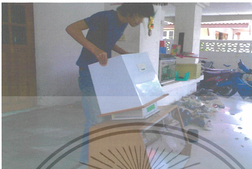
ภาพที่ 8 การประกอบฝาครอบแผ่นกรองเข้ากับตู้ปลอดเชื้อ