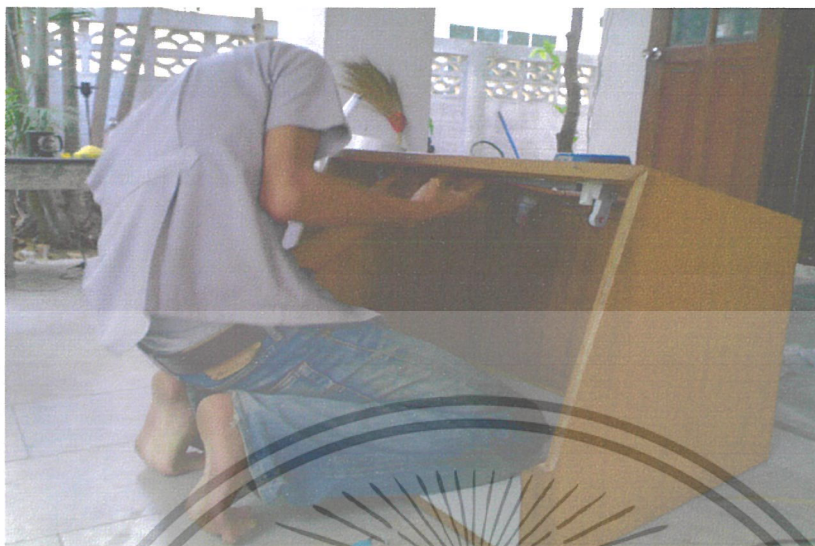
ภาพที่ 4 การติดตั้งหลอด FLUORESCENT LAMP และหลอด ULTRA VIOLET LAMP