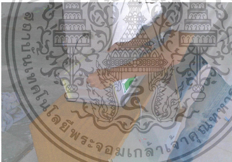
ภาพที่ 5 การติดตั้งแผ่นกรอง HEPA FILTER