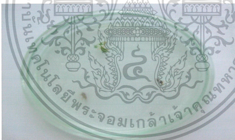
ภาพที่ 13 ลักษณะของต้นกุหลาบที่ตาย

เอกสารนี้เป็นเอกสารที่สงวนไว้สำหรับการใช้งานเพื่อการศึกษาเท่านั้น ไม่อนุญาตให้นำไปใช้ประโยชน์ด้านการค้า ไม่ว่ากรณีใดๆ ทั้งสิ้น อีกทั้งห้ามมิให้นำเอกสารเนื้อหาและต้องอ้างอิงถึงเจ้าของเอกสารทุกครั้งที่มีการนำไปใช้