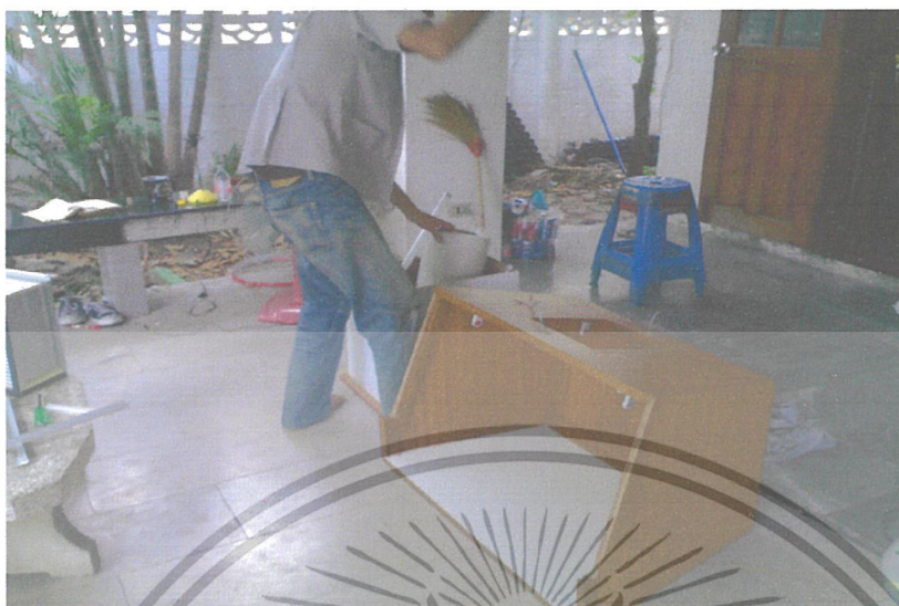
ภาพที่ 1 การประกอบตู้ปลอดเชื้อ