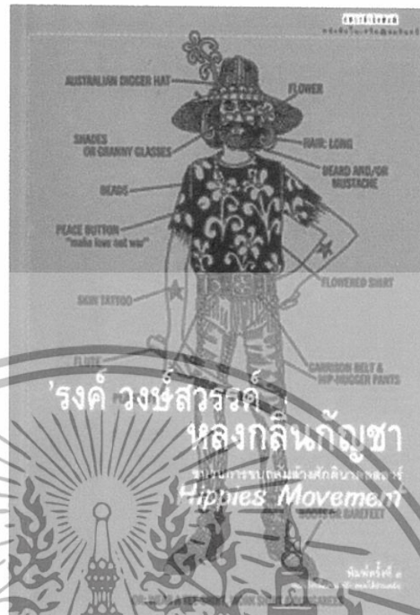
ภาพที่ 2 ภาพตัวอย่างของหนังสือ “หลังกลืนกัญชา” ที่ตีพิมพ์เมื่อปี พ.ศ. 2545