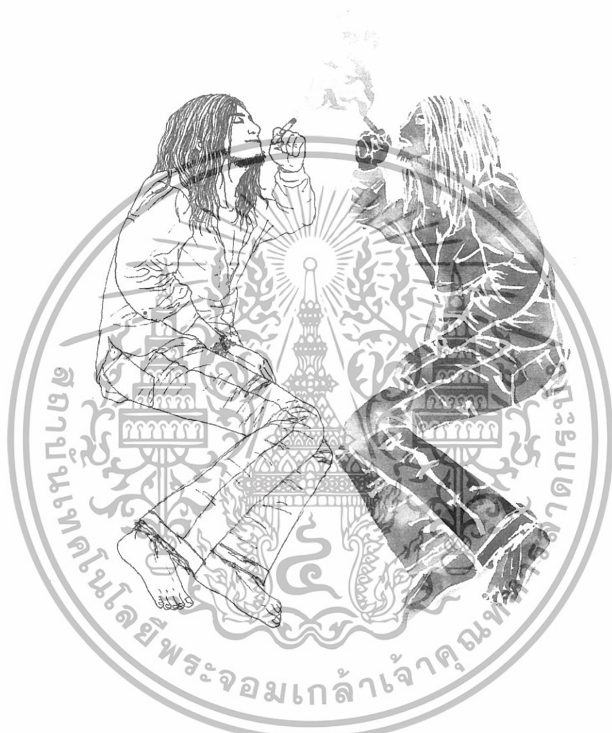
ภาพที่ 7 ภาพผู้ไขว่คว้าความว่างเปล่า