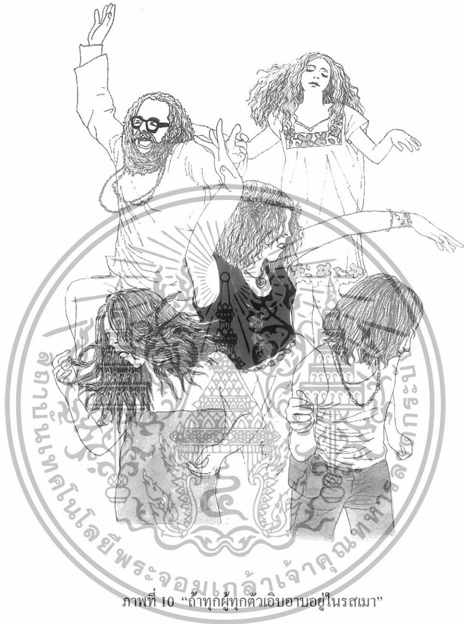
ภาพที่ 10 “ถ้าทุกผู้ทุกตัวเอิบอาบอยู่ในรสเมา”