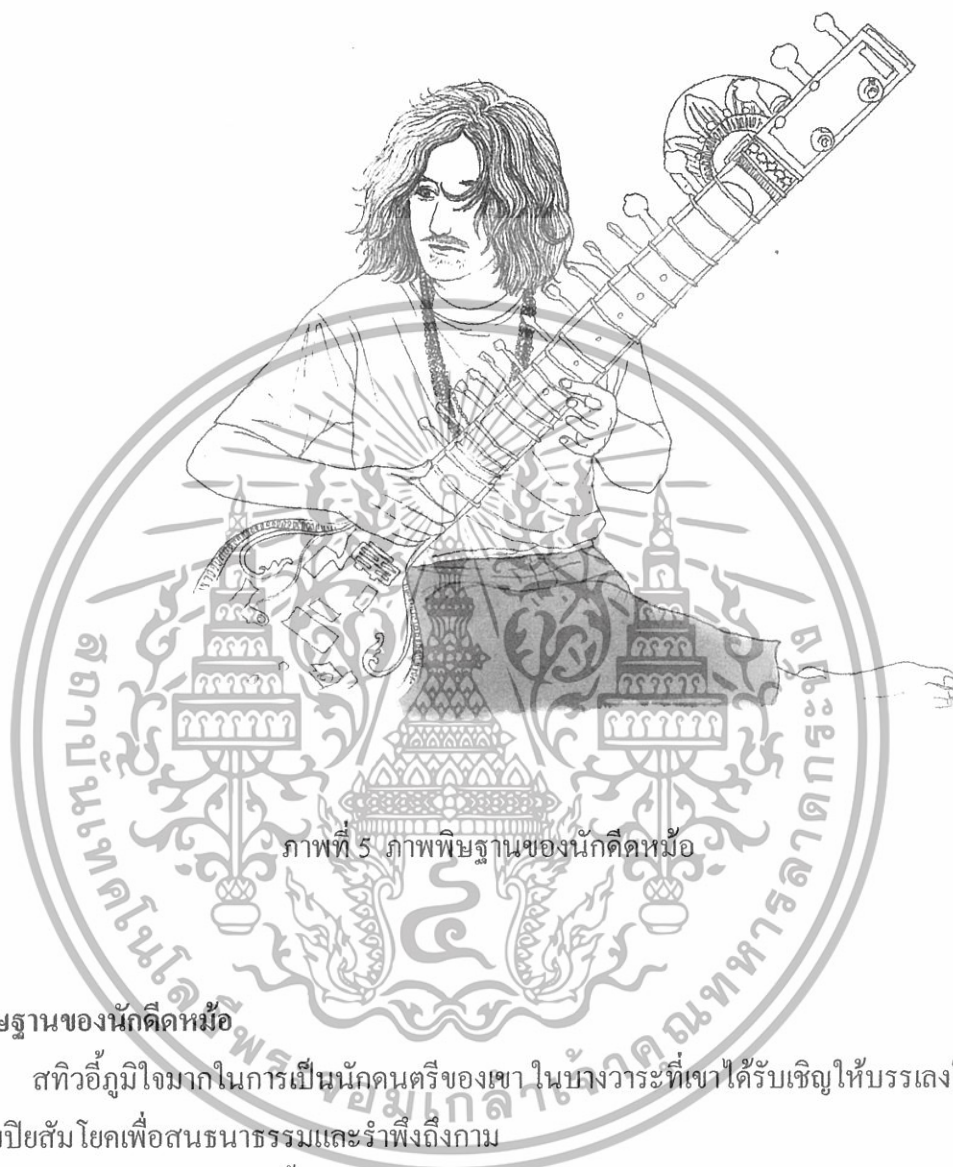
ภาพที่ 5 ภาพพิณฐานของนักคิดหม้อ