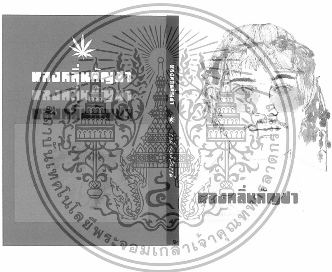
ภาพที่ 13 ภาพ ปกด้านหลัง – ปกด้านหน้า

เอกสารนี้เป็นเอกสารที่สงวนไว้สำหรับการใช้งานเพื่อการศึกษาเท่านั้น ไม่อนุญาตให้นำไปใช้ประโยชน์ด้านการค้า ไม่ว่าจะกรณีใดๆทั้งสิ้น อีกทั้งห้ามมิให้ดัดแปลงเนื้อหา และต้องอ้างอิงถึงเจ้าของเอกสารทุกครั้งที่มีการนำไปใช้