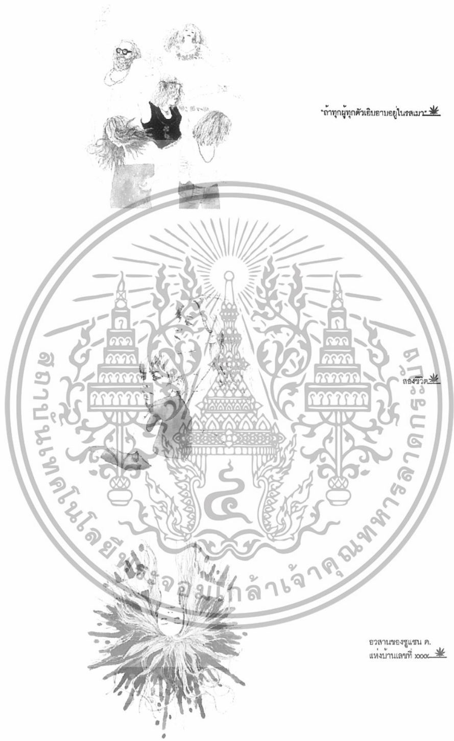
ภาพที่ 18 ภาพการจัดวางตัวอักษร 3

เอกสารนี้เป็นเอกสารที่สงวนไว้สำหรับการใช้งานเพื่อการศึกษาเท่านั้น ไม่อนุญาตให้นำไปใช้ประโยชน์ด้านการค้า ไม่ว่าจะกรณีใดๆทั้งสิ้น อีกทั้งห้ามมิให้ดัดแปลงเนื้อหา และต้องอ้างอิงถึงเจ้าของเอกสารทุกครั้งที่มีการนำไปใช้