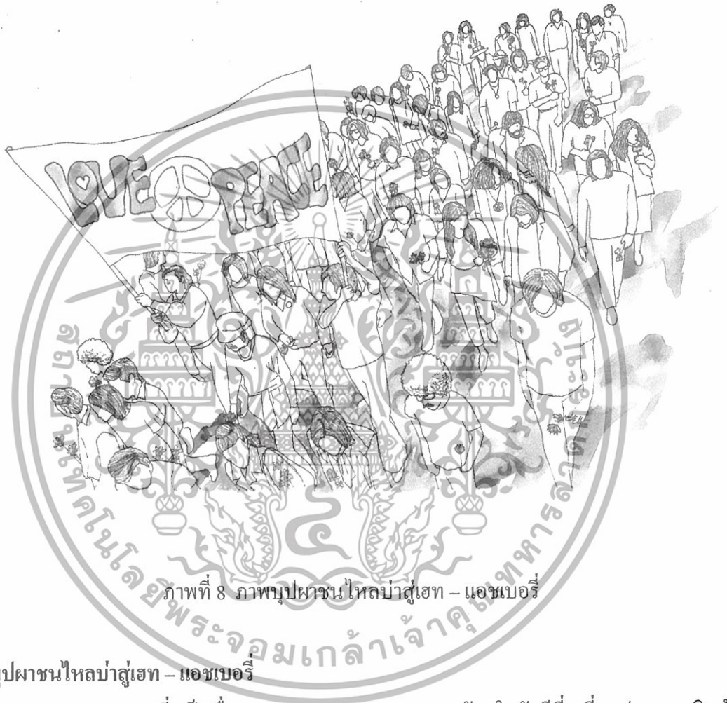
ภาพที่ 8 ภาพนุปผาชนไหลบ่าสู่เฮท – แอชเบอร์รี่