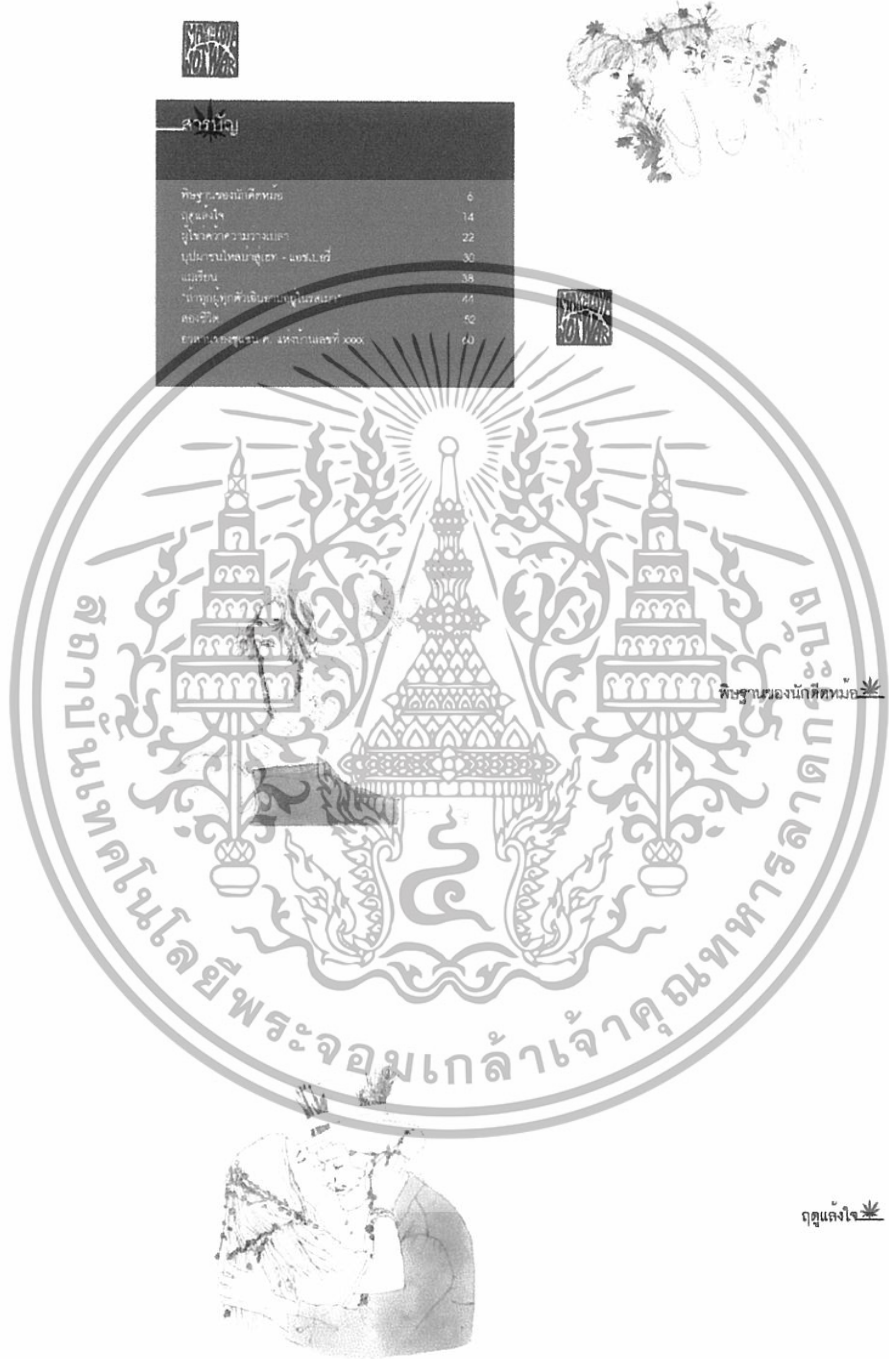
ภาพที่ 16 ภาพการจัดวางตัวอักษร 1

เอกสารนี้เป็นเอกสารที่สงวนไว้สำหรับการใช้งานเพื่อการศึกษาเท่านั้น ไม่อนุญาตให้นำไปใช้ประโยชน์ด้านการค้า ไม่ว่าจะกรณีใดๆทั้งสิ้น อีกทั้งห้ามมิให้ดัดแปลงเนื้อหา และต้องอ้างอิงถึงเจ้าของเอกสารทุกครั้งที่มีการนำไปใช้