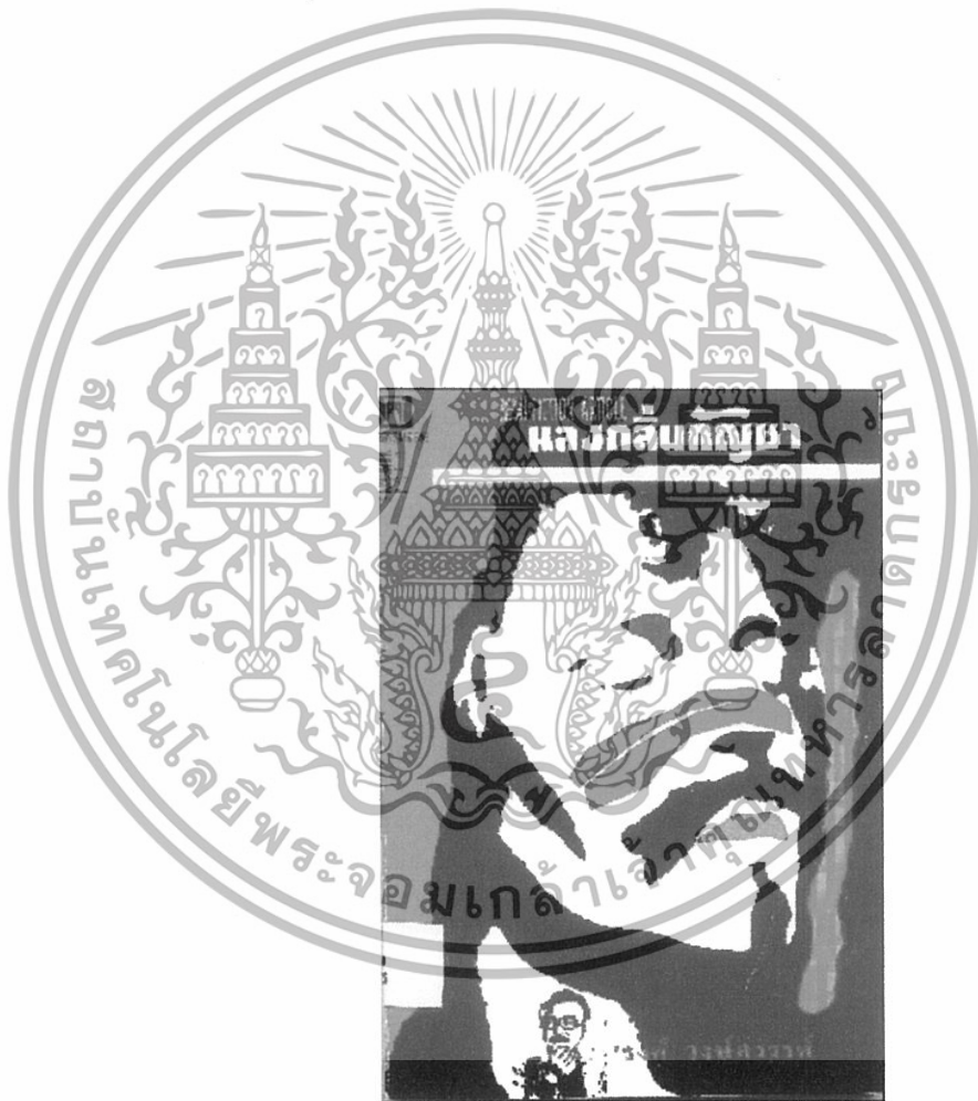
ภาพที่ 1 ภาพตัวอย่างของหนังสือ “หลวงกลั่นกัญญา” ที่ตีพิมพ์เมื่อปี พ.ศ. 2533

เอกสารนี้เป็นเอกสารที่สงวนไว้สำหรับการใช้งานเพื่อการศึกษาเท่านั้น ไม่อนุญาตให้นำไปใช้ประโยชน์ด้านการค้า ไม่ว่าจะกรณีใดๆทั้งสิ้น อีกทั้งห้ามมิให้ดัดแปลงเนื้อหา และต้องอ้างอิงถึงเจ้าของเอกสารทุกครั้งที่มีการนำไปใช้