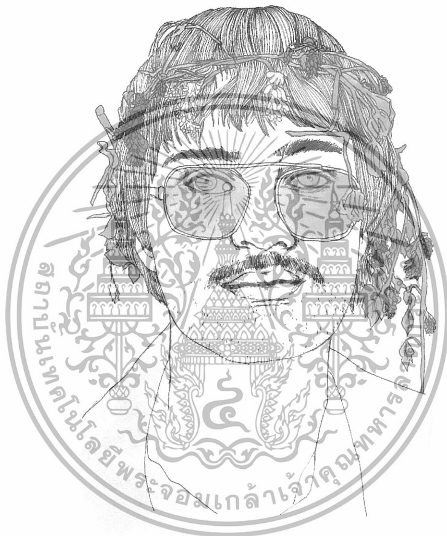
ภาพที่ 3 ภาพปก