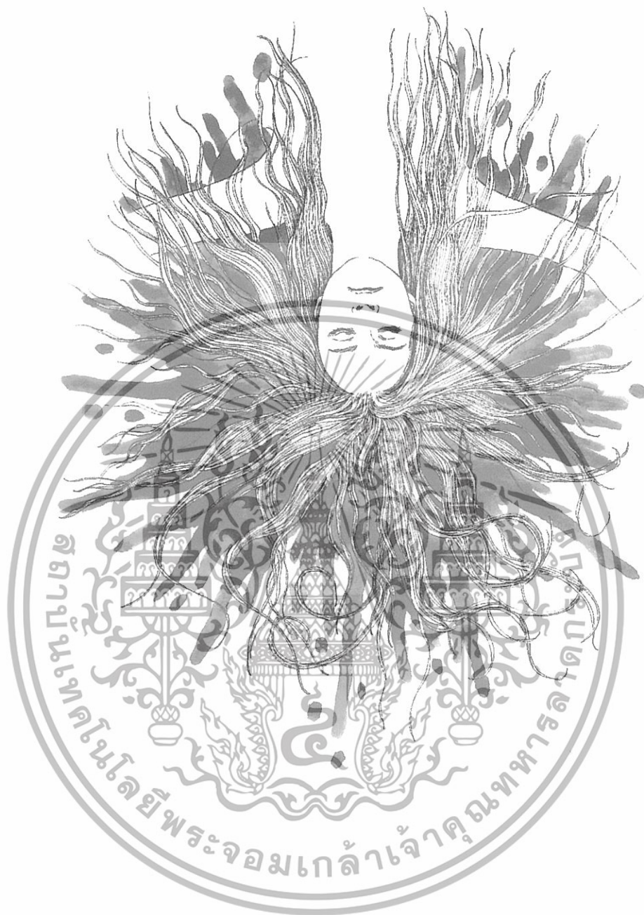
ภาพที่ 12 ภาพอวสานของชูแซน ค. แห่งบ้านเลขที่ xxxx