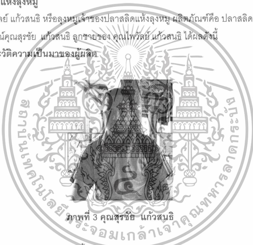
ภาพที่ 3 คุณสุรัชย์ แก้วสนธิ

เริ่มผลิตพลาสติกหอมมาตั้งแต่ พ.ศ.2515 โดยทำเป็นแบบธุรกิจแบบครอบครัว ใช้สมาชิกในครอบครัวช่วยเหลือกันและมีการจ้างคนเข้ามาช่วยบ้าง เริ่มต้นก่อนที่จะมาทำพลาสติก คุณสุรัชย์กล่าวว่า เริ่มต้นทำนามาก่อนแต่ประสบปัญหาเรื่องข้าวจึงหันเหตัวเองมาผลิตพลาสติกหอม