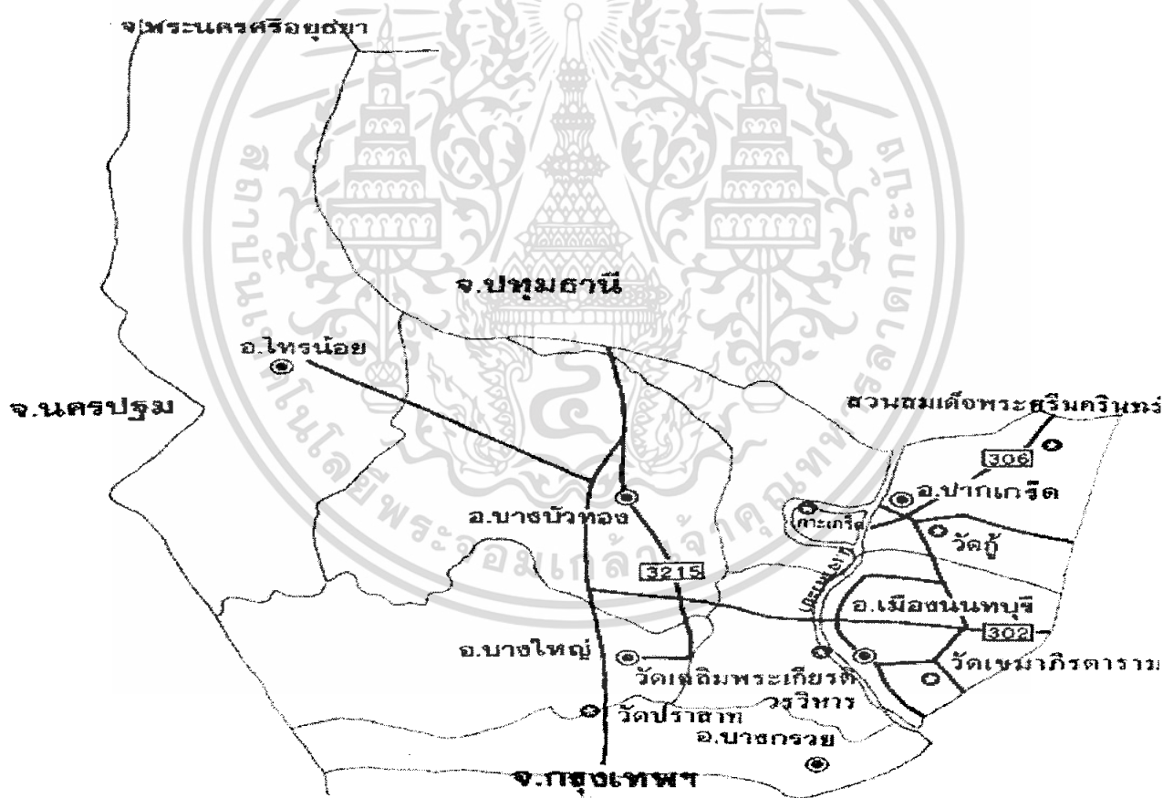
ภาพที่ 3 แผนที่แสดงเส้นทางการเดินทางในจังหวัดนนทบุรี