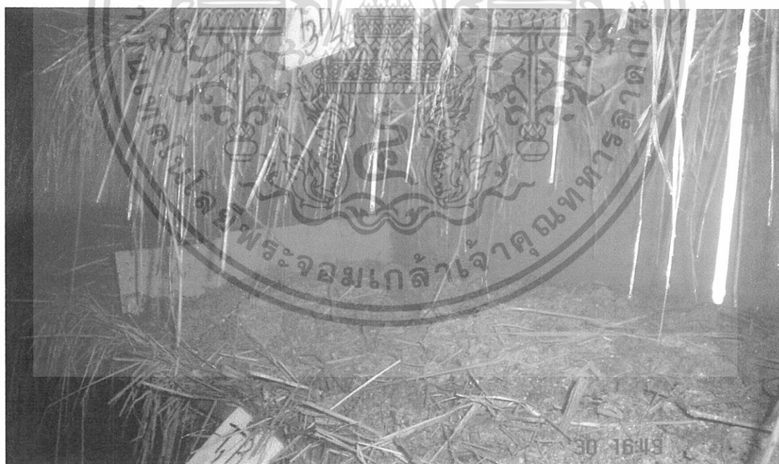
ภาพผนวกที่ 5 แสดงลักษณะภายในโรงเรือนแบบอุตสาหกรรมขณะทำการอบฆ่าเชื้อด้วยไอน้ำ

เอกสารนี้เป็นเอกสารที่สงวนไว้สำหรับการใช้งานเพื่อการศึกษาเท่านั้น ไม่อนุญาตให้นำไปใช้ประโยชน์ด้านการค้า ไม่ว่ากรณีใดๆทั้งสิ้น อีกทั้งห้ามมิให้ดัดแปลงเนื้อหา และต้องอ้างอิงถึงเจ้าของเอกสารทุกครั้งที่มีการนำไปใช้