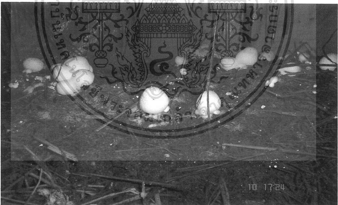
ภาพผนวกที่ 7 แสดงการเจริญเติบโตในระยะกระดุมและระยะพร้อมเก็บเกี่ยว

เอกสารนี้เป็นเอกสารที่สงวนไว้สำหรับการใช้งานเพื่อการศึกษาเท่านั้น ไม่อนุญาตให้นำไปใช้ประโยชน์ด้านการค้า ไม่ว่ากรณีใดๆทั้งสิ้น อีกทั้งห้ามมิให้ดัดแปลงเนื้อหา และต้องอ้างอิงถึงเจ้าของเอกสารทุกครั้งที่มีการนำไปใช้