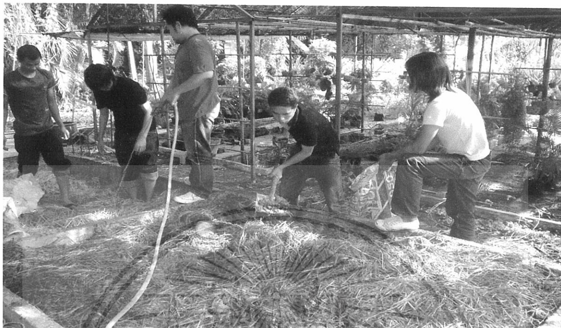
ภาพผนวกที่ 2 แสดงการแช่ฟางข้าวก่อนนำไปวางบนชั้นเพาะเห็ดฟางในโรงเรือนแบบอุตสาหกรรม