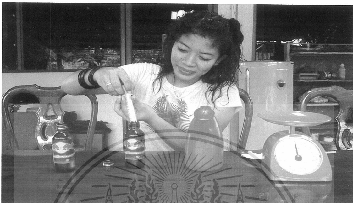
ภาพผนวกที่ 4 แสดงการตวงสารน้ำตาลกลูโคส (กระทิงแดง) ในอัตราส่วนต่างๆ