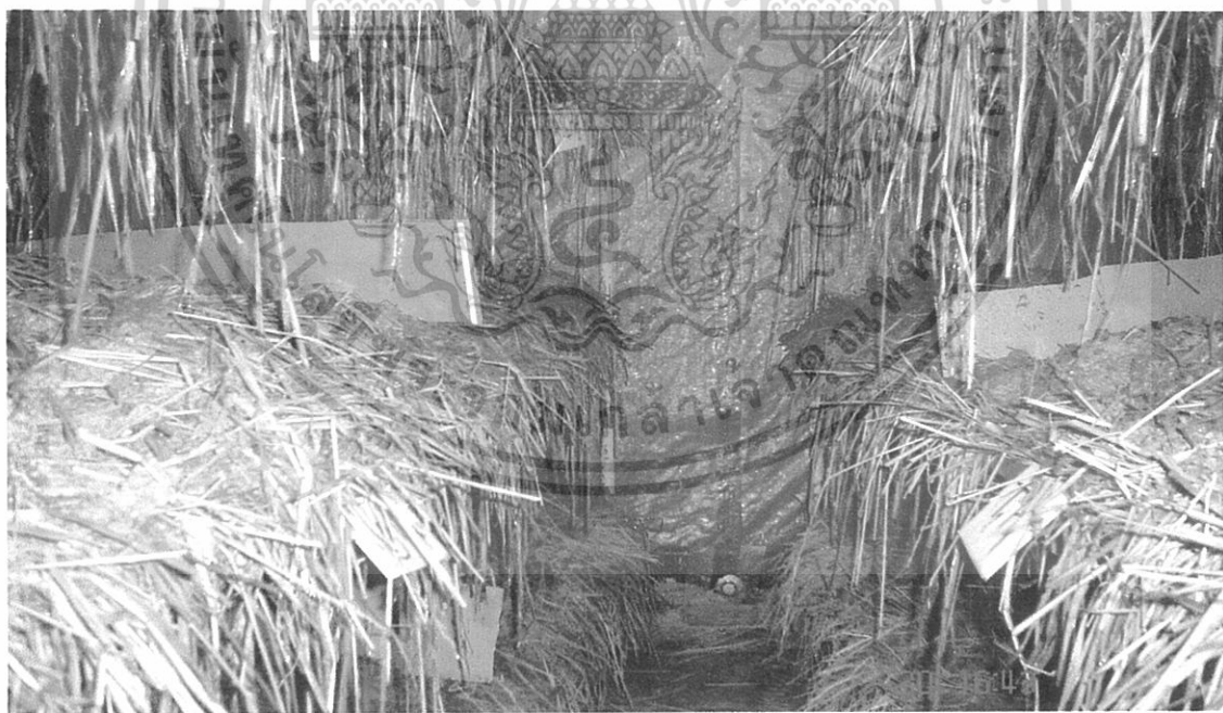
ภาพผนวกที่ 3 แสดงลักษณะโรงเรือนแบบอุตสาหกรรม

เอกสารนี้เป็นเอกสารที่สงวนไว้สำหรับการใช้งานเพื่อการศึกษาเท่านั้น ไม่อนุญาตให้นำไปใช้ประโยชน์ด้านการค้า ไม่ว่ากรณีใดๆทั้งสิ้น อีกทั้งห้ามมิให้ดัดแปลงเนื้อหา และต้องอ้างอิงถึงเจ้าของเอกสารทุกครั้งที่มีการนำไปใช้