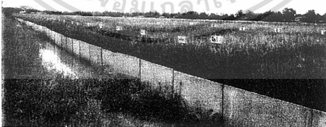
ภาพผนวกที่ 1 การปักดำและการกั้นแนวป้องกันศัตรูข้าว

เอกสารนี้เป็นเอกสารที่สงวนไว้สำหรับการใช้งานเพื่อการศึกษาเท่านั้น ไม่อนุญาตให้นำไปใช้ประโยชน์ด้านการค้า ไม่ว่ากรณีใดๆทั้งสิ้น อีกทั้งห้ามมิให้ดัดแปลงเนื้อหา และต้องอ้างอิงถึงเจ้าของเอกสารทุกครั้งที่มีการนำไปใช้