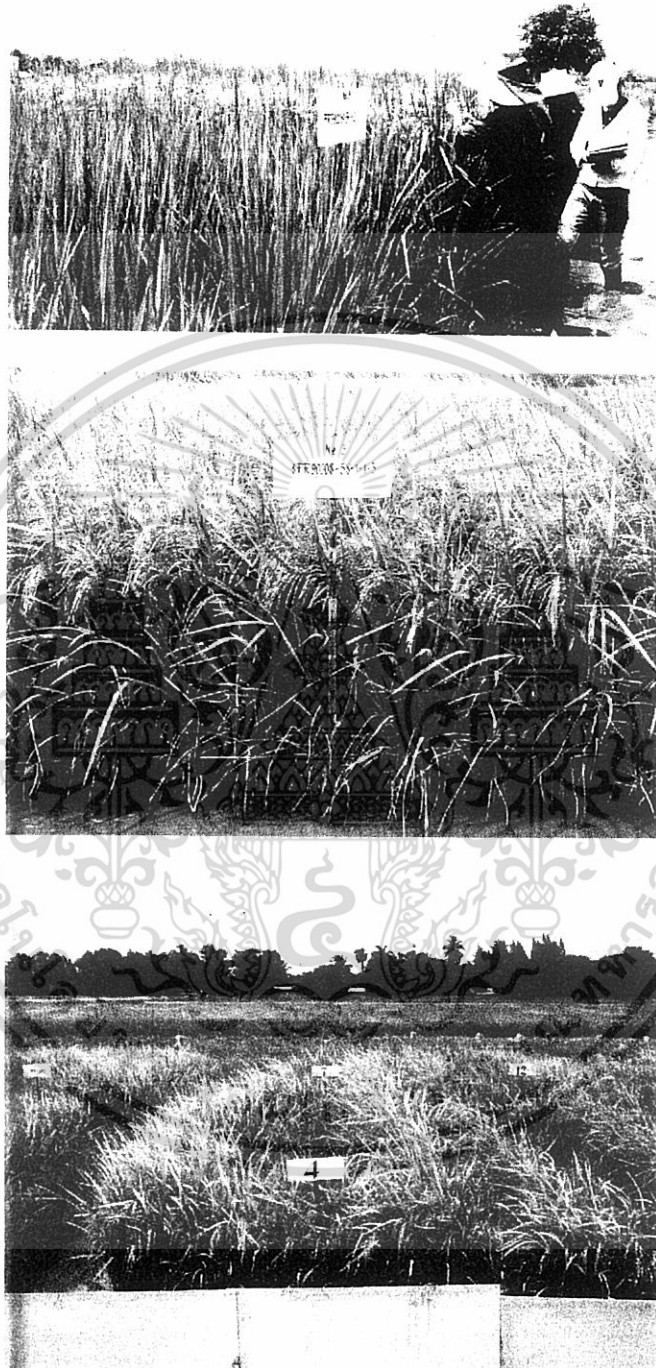
ภาพผนวกที่ 2 การสุ่มวัดความสูงของข้าว

เอกสารนี้เป็นเอกสารที่สงวนไว้สำหรับการใช้งานเพื่อการศึกษาเท่านั้น ไม่อนุญาตให้นำไปใช้ประโยชน์ด้านการค้า ไม่ว่ากรณีใดๆทั้งสิ้น อีกทั้งห้ามมิให้ดัดแปลงเนื้อหา และต้องอ้างอิงถึงเจ้าของเอกสารทุกครั้งที่มีการนำไปใช้