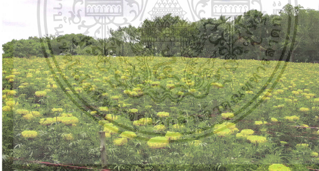
ภาพที่ 2 เกษตรกรนิยมปลูกดาวเรืองพันธุ์ซอเฟอร์เรนส์