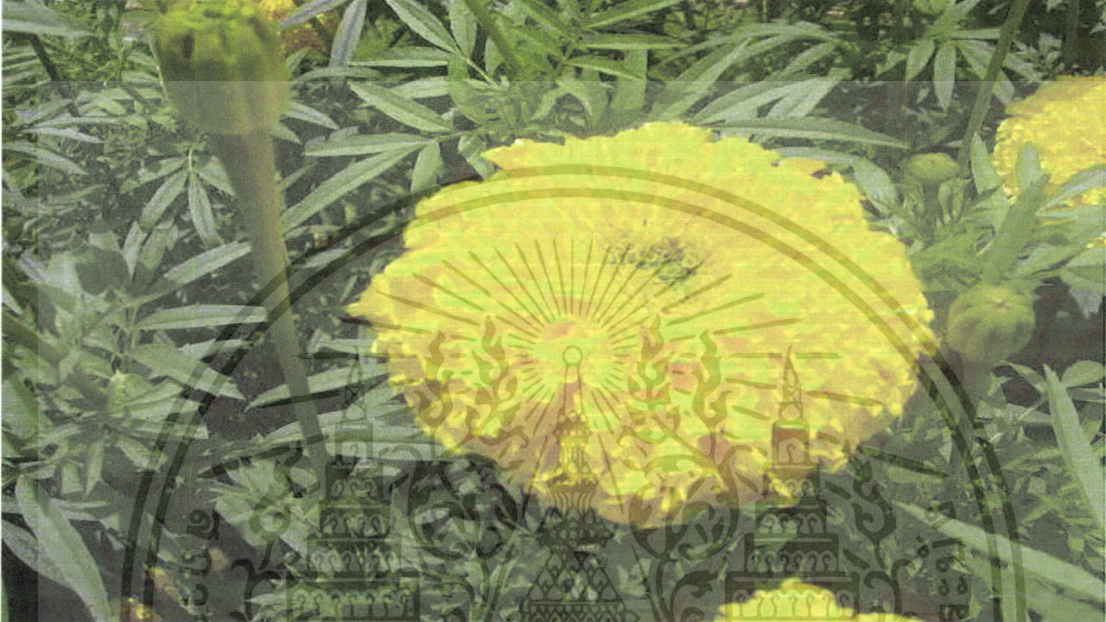
ภาพที่ 3 ดอกดาวเรืองพันธุ์ซอเฟอร์เรนส์ที่มีขนาดใหญ่ สวยงาม