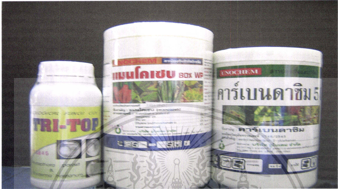
ภาพที่ 4 สารป้องกันกำจัดโรคพืช