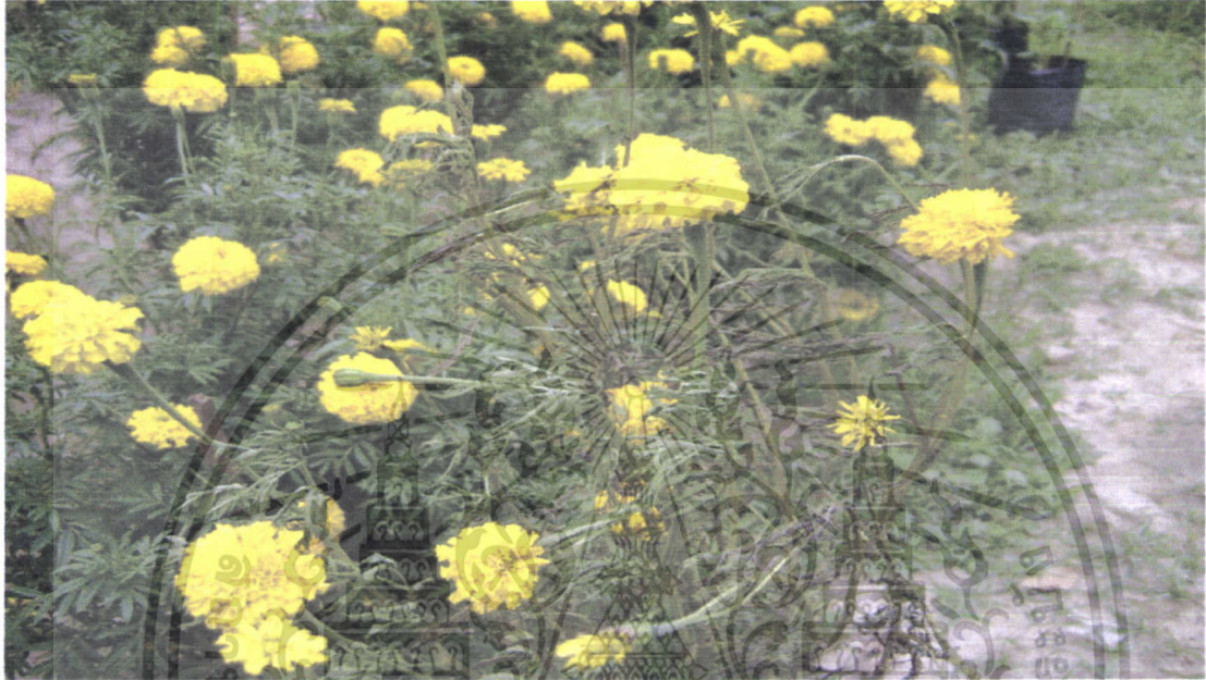
ภาพที่ 7 โรคเหี่ยวของดาวเรือง