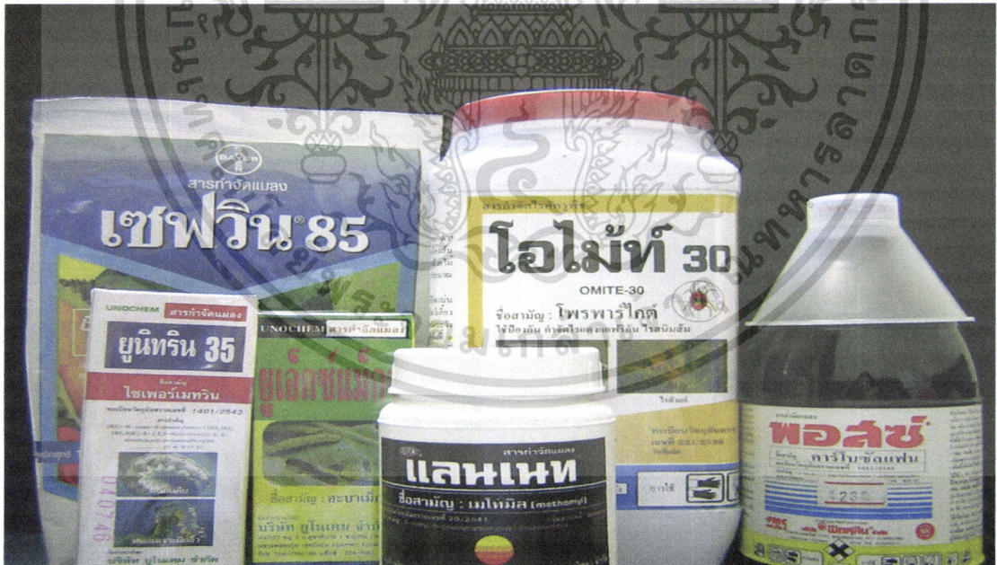
ภาพที่ 5 สารป้องกันกำจัดแมลง