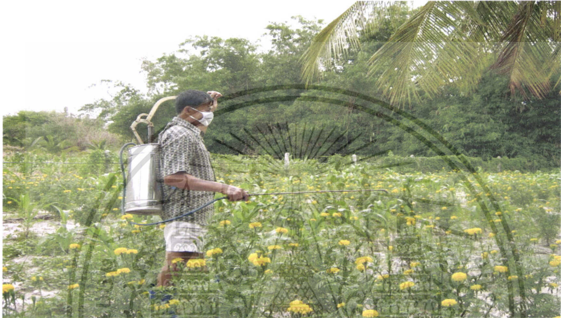
ภาพที่ 6 เครื่องพ่นสารปราบศัตรูพืชแบบถังโยก