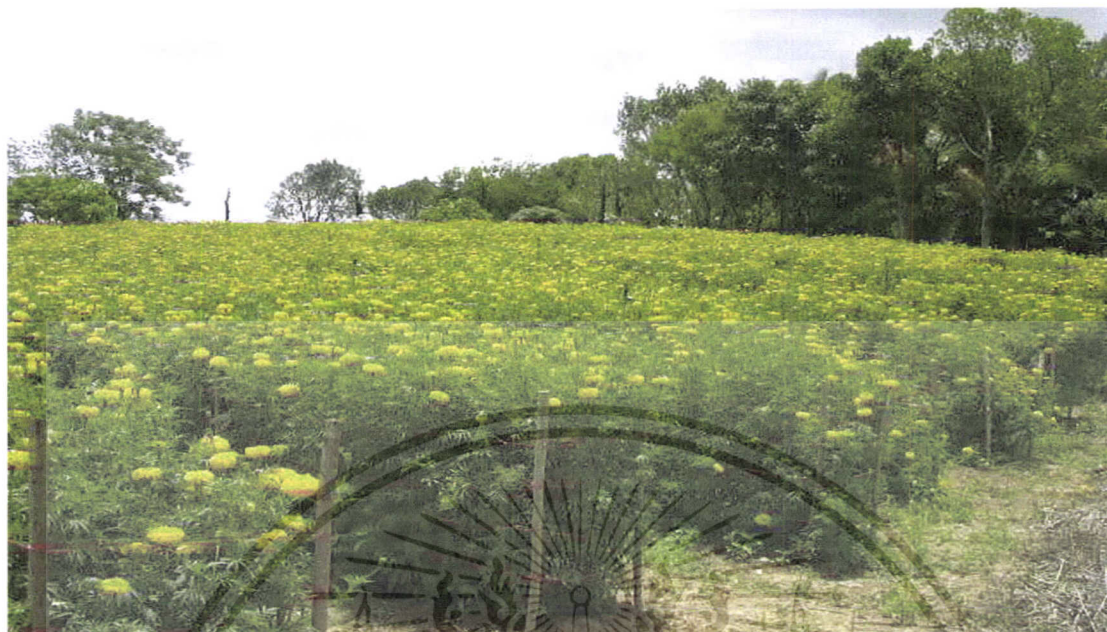
ภาพที่ 1 สภาพแปลงปลูกดาวเรืองในพื้นที่จังหวัดนครราชสีมา