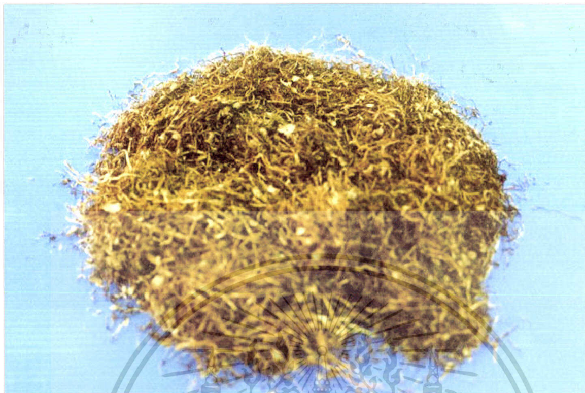
ภาพที่ 7 ยาสูบ ( Nicotina tabacum Linn. : Solanaceae)