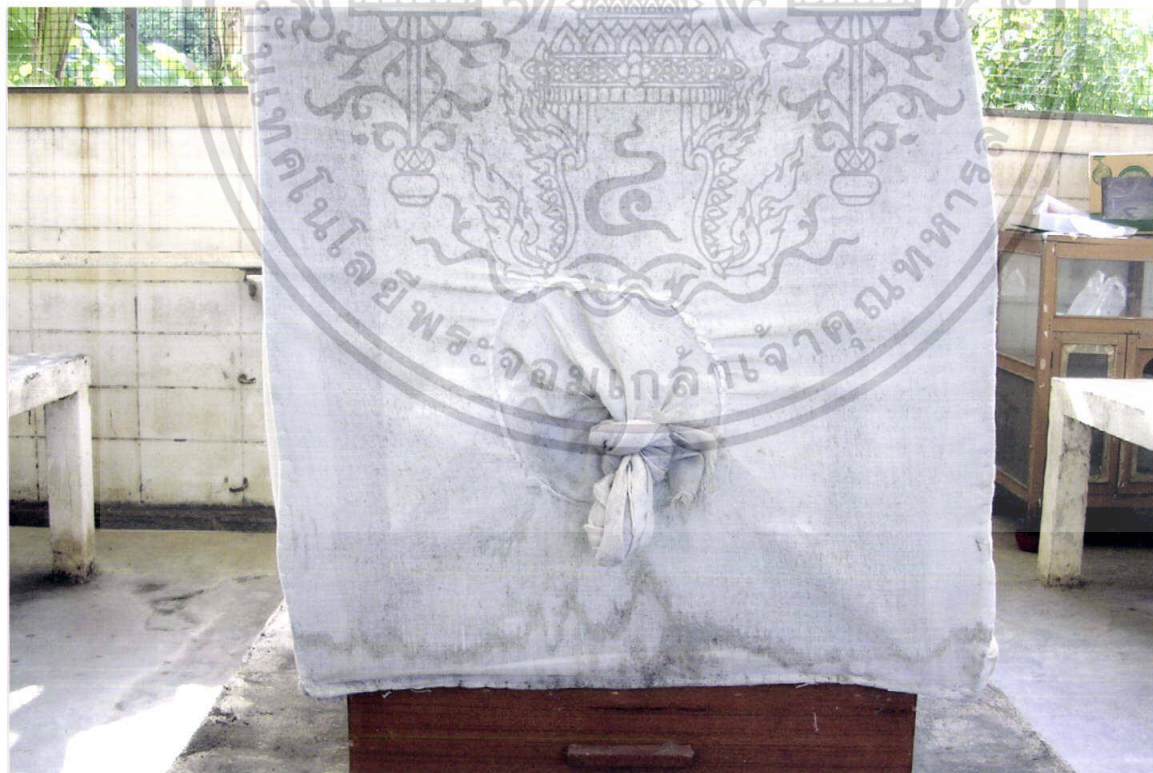
ภาพที่ 4 กรงเลี้ยงแมลงวันบ้าน ขนาด 60 x 60 x 60 เซนติเมตร

เอกสารนี้เป็นเอกสารที่สงวนไว้สำหรับการใช้งานเพื่อการศึกษาเท่านั้น ไม่อนุญาตให้นำไปใช้ประโยชน์ด้านการค้า ไม่ว่าจะกรณีใดๆทั้งสิ้น อีกทั้งห้ามมิให้ดัดแปลงเนื้อหา และต้องอ้างอิงถึงเจ้าของเอกสารทุกครั้งที่มีการนำไปใช้