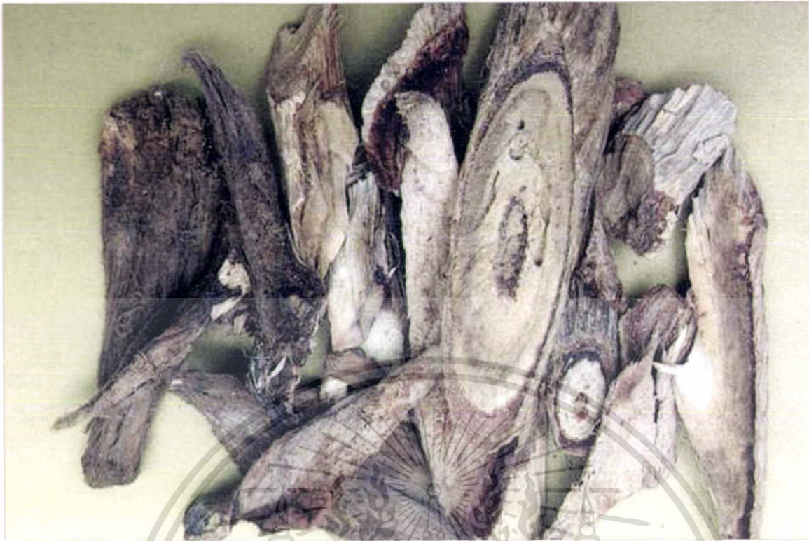
ภาพที่ 5 กวาวเครือแดง ( Pueraria mirifica Airy-shaw et Suvatabandhu. : Leguminosae)