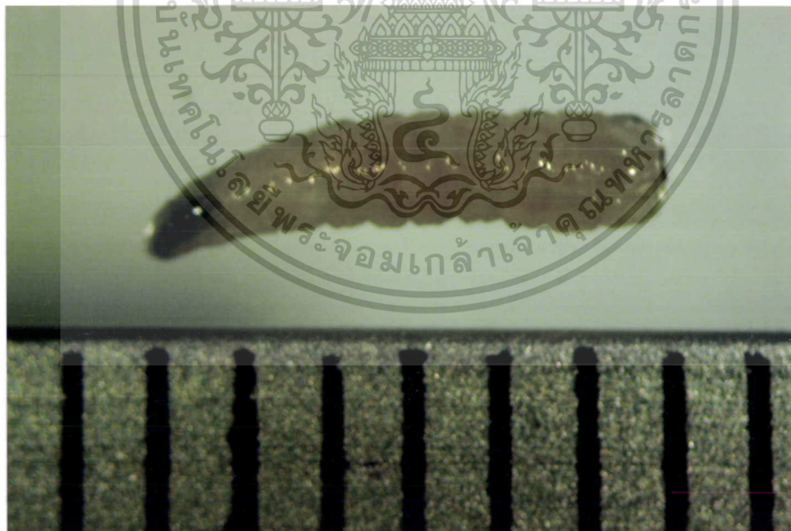
ภาพที่ 2 ตัวหนอนแมลงวันบ้านวัยที่ 2

เอกสารนี้เป็นเอกสารที่สงวนไว้สำหรับการใช้งานเพื่อการศึกษาเท่านั้น ไม่นิยมนำไปใช้ประโยชน์ด้านการค้า ไม่ว่าจะกรณีใดๆทั้งสิ้น อีกทั้งห้ามมิให้ตัดแปลงเนื้อหา และต้องอ้างอิงถึงเจ้าของเอกสารทุกครั้งที่มีการนำไปใช้