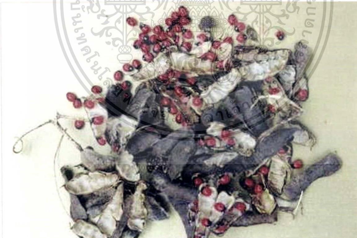
ภาพที่ 6 มะกล่ำตาหนู ( Abrus precatorius Linn. : Papilionaceae)

เอกสารนี้เป็นเอกสารที่สงวนไว้สำหรับการใช้งานเพื่อการศึกษาเท่านั้น ไม่อนุญาตให้นำไปใช้ประโยชน์ด้านการค้า ไม่ว่าจะกรณีใดๆทั้งสิ้น อีกทั้งห้ามมิให้ดัดแปลงเนื้อหา และต้องอ้างอิงถึงเจ้าของเอกสารทุกครั้งที่มีการนำไปใช้