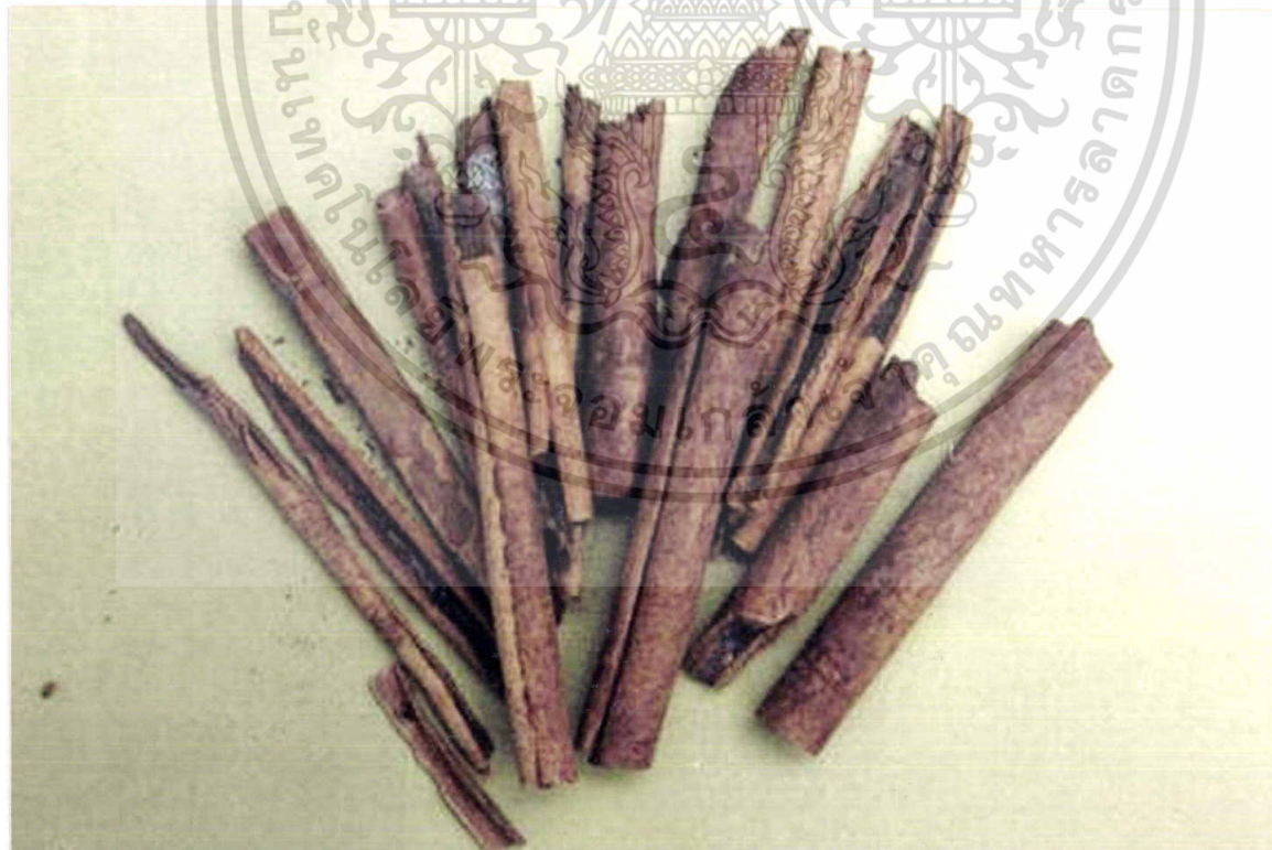
ภาพที่ 8 อบเชย ( Cinamomum verum (Ham.) : Lauraceae )

เอกสารนี้เป็นเอกสารที่สงวนไว้สำหรับการใช้งานเพื่อการศึกษาเท่านั้น ไม่อนุญาตให้นำไปใช้ประโยชน์ด้านการค้า ไม่ว่ากรณีใดๆทั้งสิ้น อีกทั้งห้ามมิให้ดัดแปลงเนื้อหา และต้องอ้างอิงถึงเจ้าของเอกสารทุกครั้งที่มีการนำไปใช้